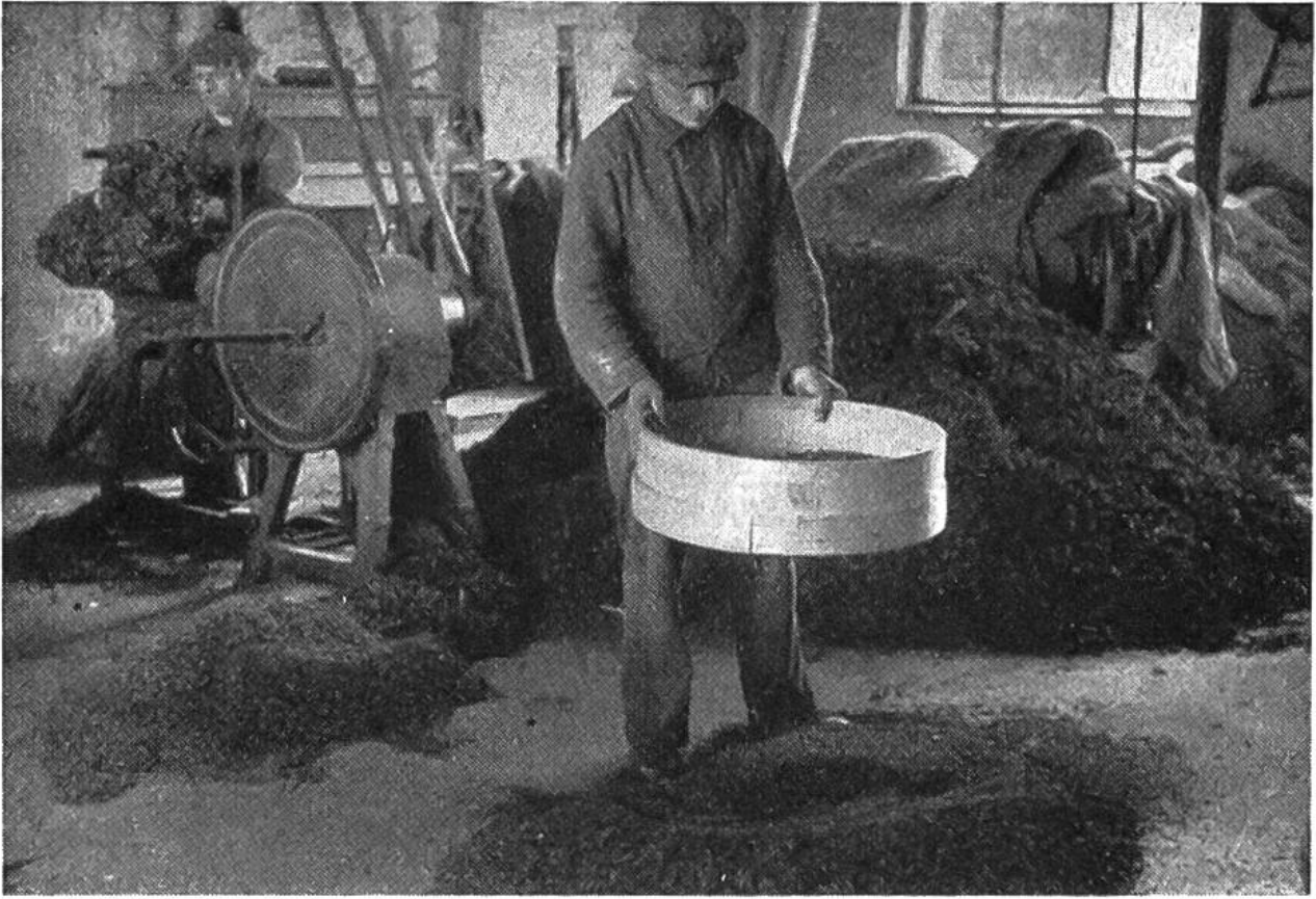
Zerkleinern und Reinigen der Drogen geschieht im Grossbetrieb durch Maschinen.

mian, Eibisch und Liebstöckel. Für die Beschaffung von Pfeffermünzstecklingen sind wir auf gute Kultursorten angewiesen und hüten uns vor dem Sammeln wilder Pflanzen.