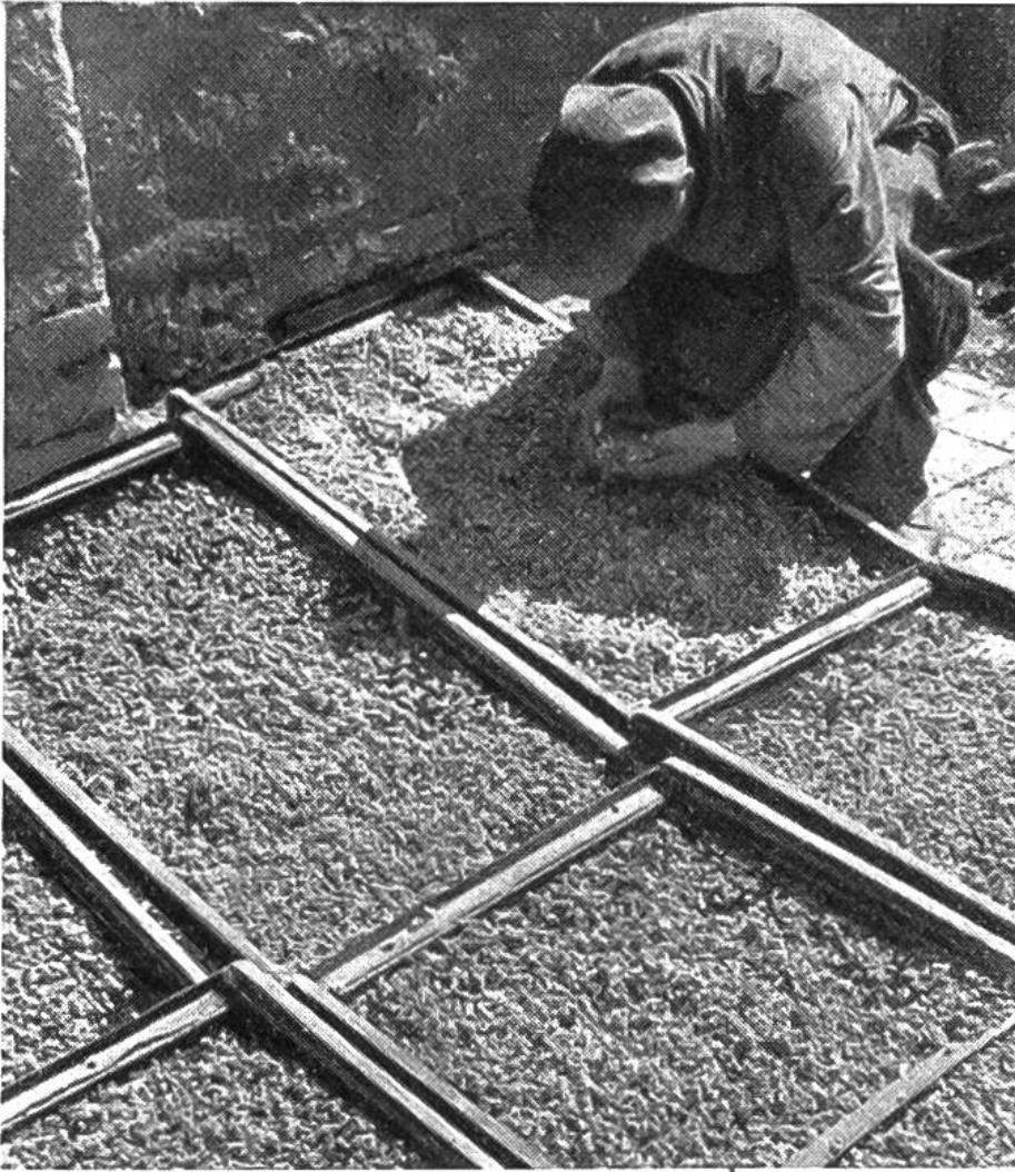
Trockenhurden sind an der Sonne ausgelegt. Durch öfteres Wenden wird die Trocknung beschleunigt.

wird der Mutter durch Anpflanzung von Heilpflanzen und Teekräutern viel Freude bereiten.