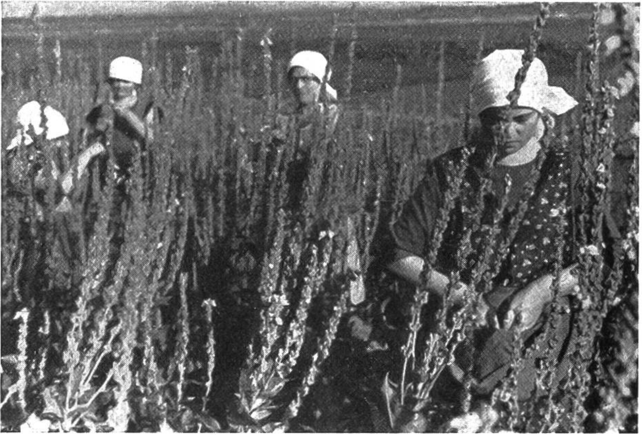
Königskerzenblüten müssen während der Blütezeit jeden Morgen abgezapft werden.

lichen Drogen ernsthaft gefährdet. Hier öffnet sich nun ein weites und dankbares Feld für hilfsbereite Buben und Mädchen, die sich mit ihrer Arbeit für die Gesundheit ihrer Familie und des ganzen Schweizervolkes einsetzen wollen. Das Sammeln von wildwachsenden Heilpflanzen ist der längst bekannte Weg, den wohl viele von euch, liebe Leser, schon beschritten haben. Es setzt vor allem eine genaue Kenntnis der heilkräftigen Arten und das Vertrautsein mit deren Vorkommen voraus. Das Sammeln ergibt oft nur minderwertige und vor allem ungleichmässige Ware. Zudem gefährdet ihr damit leicht den Bestand unserer Wildflora, die ohnehin durch die vielen Kulturmassnahmen schon stark in Mitleidenschaft gezogen wurde.