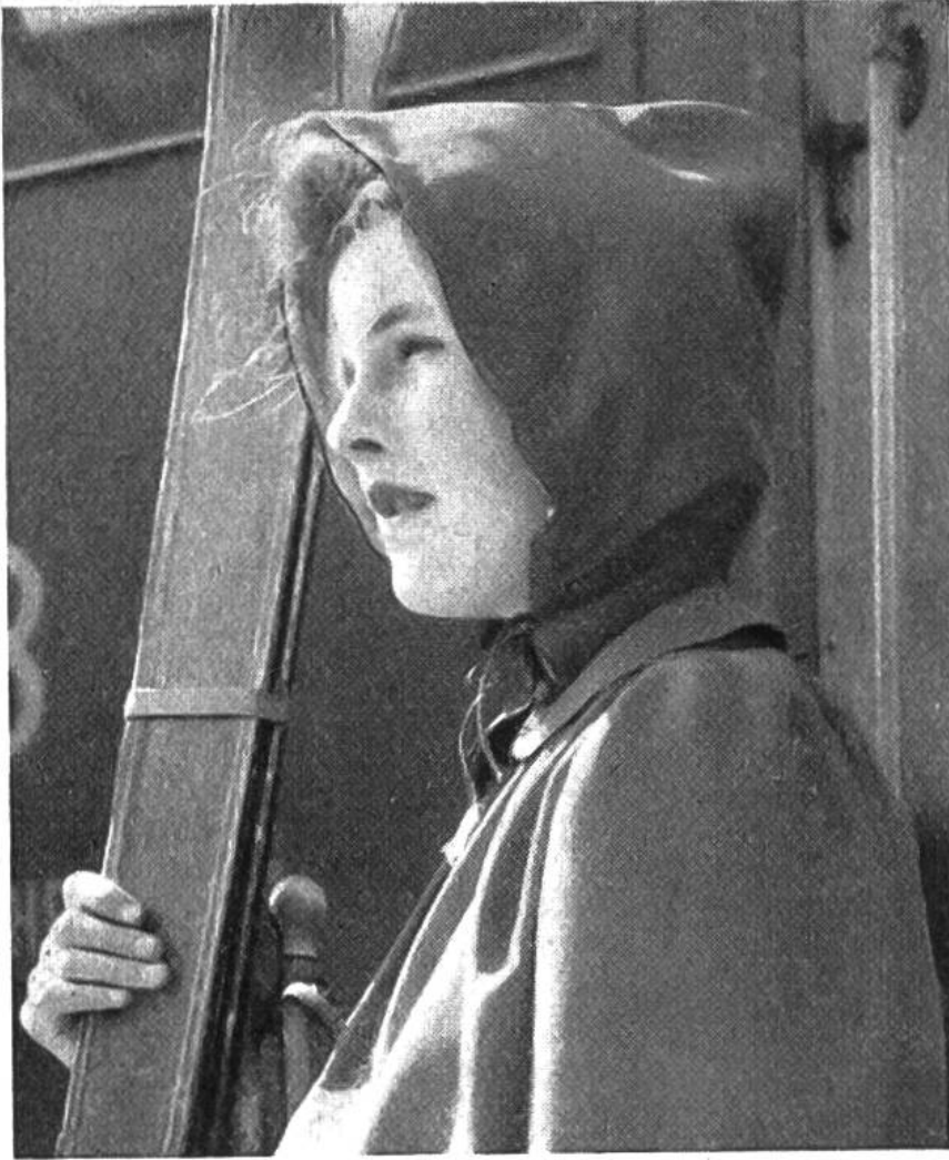
Kapuze, passend zur Skibluse.

A u s f ü h r u n g : Alle Änderungen müssen bezeichnet und auf die andere Blusenhälfte übertragen werden. Die Achselpasse wird weggenommen und das Stickereimuster \frac{1}{2} cm vom vorderen Rand entfernt aufgezeichnet, an der Tasche 1\frac{1}{2} cm wegen Reissverschluss. Am Verschluss vorne ist zu beachten, dass beim Aufzeichnen des Musters am Hals oder an der Saumkante gleich