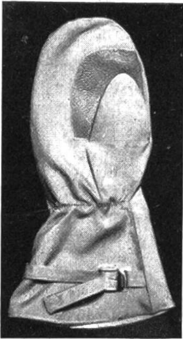
Skihandschuh aus imprägniertem Stoff mit aufgestepptem Lederteil.

5 cm vom Halsansatz vorne ein rundes Loch ausnähen und das Schnürchen durchziehen. Der Kragen ist aus einfachem Stoff, hat eine Naht in der Mitte und ein schmales Säümchen aussen. Die Kapuze wird dem Halsausschnitt nach umbogen, Futter für sich. Die äussere Kapuze auf den Kragenansatz aufsteppen und das Futter hinuntersäumen. Sie schliesst mit Knopf und Riegeli.