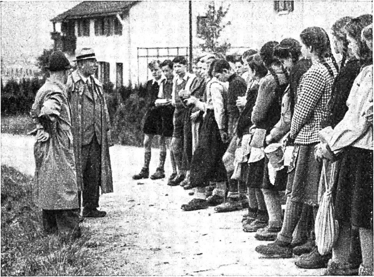
Die Sekundarschülerklasse einer Zürcher Aussen- gemeinde „einsatzbereit zur Jagd auf den Händöpfelfeind“. Lehrer und Ackerbauleiter geben die letzten Anweisungen.

Stück an die Unterseite der Kartoffelblätter. Nach etwa einer Woche schlüpfen daraus die rotgefärbten Larven, die unter ständigem Fressen innert 14 Tagen bis 12 mm gross werden und sich dann 15—20 cm tief im Boden verpuppen. Nach weitem 10—12 Tagen kriechen die fertigen Käfer aus, und der Kreislauf beginnt von neuem. Infolge dieser ausserordentlichen Vermehrungsfähigkeit und Fressgier des Schädling können ganze Kartoffelfelder in kurzer Zeit kahlgefressen werden, wenn die Bekämpfung nicht rechtzeitig einsetzt. Die natürlichen Feinde des Kartoffelkäfers, wie die Vögel, die Larven des Marienkäferchens, verschiedene Schreitwanzen usw., richten bei plötzlichem massenhaftem Auftreten des Käfers nicht viel aus.