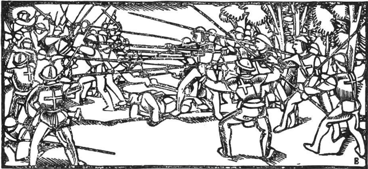
Kampf im Schwabenkrieg, 1499.