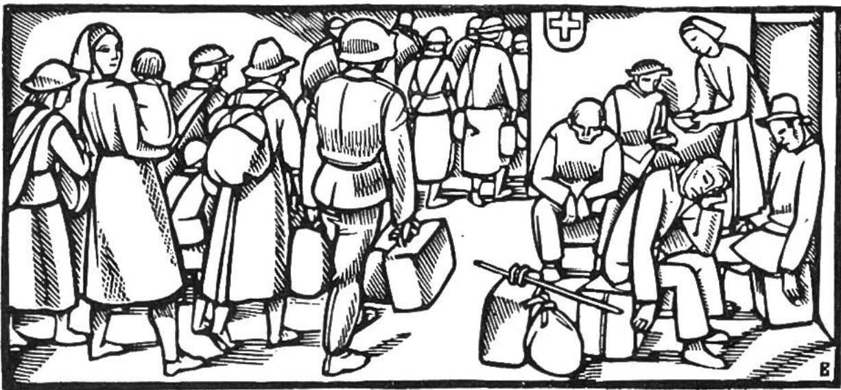
Zivilflüchtlinge erreichen die Schweizer Grenze.

auf Belgien, Holland, Luxemburg. Churchill wird engl. Ministerpräsident. 11.: 2. Generalmobilmachung d. schweiz. Armee. 15.: Holland u. 28.: Belgien kapitulieren. Juni 6.: Beginn der neuen deutschen Offensive gegen Frankreich. 10.: Norwegen kapituliert. 11.: Italien erklärt Grossbritannien u. Frankreich d. Krieg. 14.: Einmarsch deutscher Truppen in Paris. 17.: Russland besetzt nach Litauen auch Lettland u. Estland. 18.-21.: nahezu 40000 alliierte Truppen überschreiten die Schweizergrenze im Berner Jura. 22.: Waffenstillstand zw. Deutschland u. Frankreich u. 24.: zw. Italien u. Frankreich. 28.: Rumänien tritt Gebiete Bessarabiens u. der Nordbukowina an Russland ab. Sept. 6.: Abdankung König Carols von Rumänien zugunsten seines Sohnes Michael. 27.: Abschluss des Drei-Mächte-Paktes in Berlin zw. Deutschland, Italien u. Japan. Nov. 5.: Einmarsch ital. Truppen in griechisches Gebiet. Roosevelt wird zum 3. Mal als Präsident der U.S.A. gewählt. 7.: Beginn der allnächtlichen Verdunkelung in der Schweiz. 20.-24.: Ungarn, Rumänien u. die Slowakei treten dem Drei-