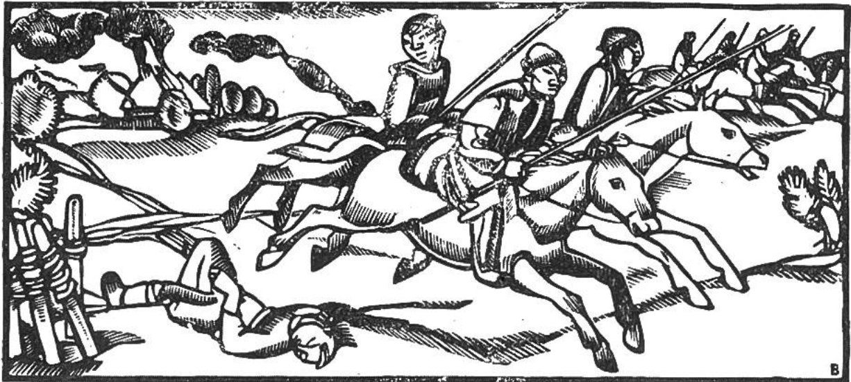
Mongolenvölker dringen in Europa ein.

oberung Galliens durch Julius Cäsar. 49–45 Bürgerkrieg zw. Cäsar u. Pompejus. Triumvirat. 44 Ermordung Cäsars. 30–476 n. Chr. Rom unter Kaisern. 29 Augustus röm. Kaiser. Blüte der römisch. Literatur. Virgil, Ovid, Horaz, Titus Livius. Nach Christus. 9 Der röm. Feldherr Quintilius Varus wird vom Cheruskerfürsten Arminius (Hermann) im Teutoburgerwalde besiegt. 64–311 Zeit der Christenverfolgungen durch verschiedene römische Kaiser. 69 Helvetischer Aufstand, Julius Alpinus. 313 Kaiser Konstantin erhebt das Christentum z. Staatsreligion. 337 Teilung des röm. Reiches. 375 Beginn d. Völkerwanderung.