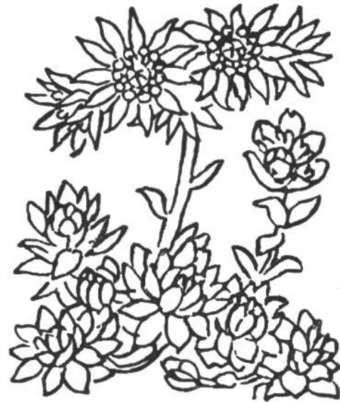
Spinnwebige Hauswurz ( Sempervivum arachnoideum ). Blüht Juli-August auf Felsen der höheren Alpen. Die saftigen Blätter bilden Rosetten. Geschützt.