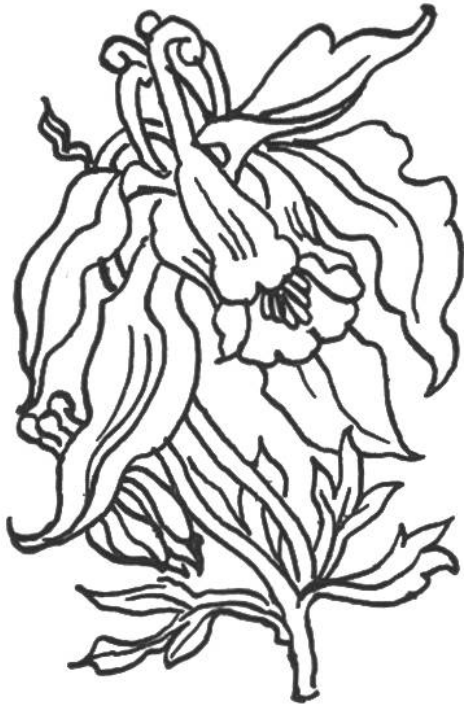
Alpenakelei ( Aquilegia alpina ). Selten schöne Zierde der Krummholz- und Grünerlen-Hänge unserer Alpen. Blüht im Juli und August. Geschützt.