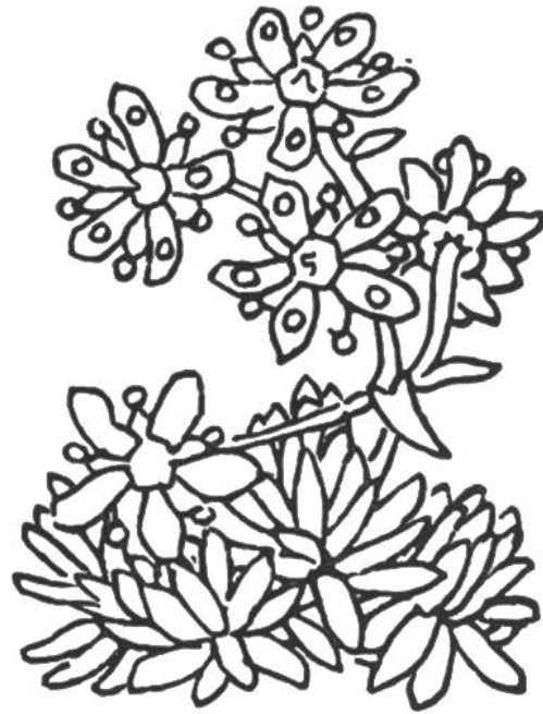
Immergrüner Steinbrech ( Saxifraga aizoides ). Die lockeren Polster blühen vom Juni bis zum Herbst längs Wasserläufen und im durchfeuchteten Felsgrus.