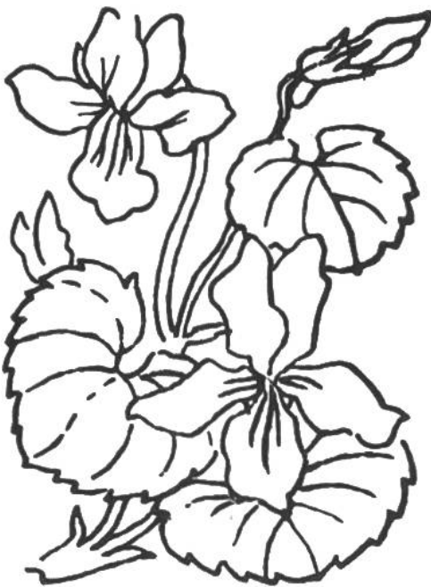
Zweiblütiges Veilchen ( Viola biflora ). Gedeiht an feuchten, schattigen Orten der Berge. Blüht Juni bis August.