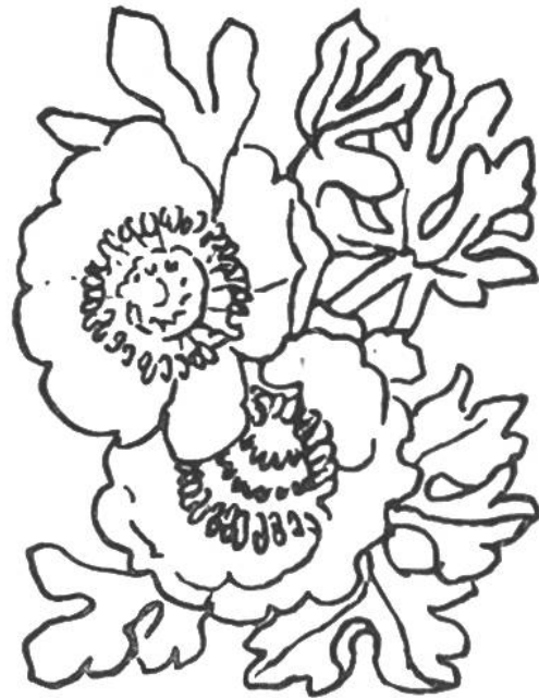
Gletscher-Hahnenfuss ( Ranunculus glacialis ). Dieser kleine Hahnenfuss gedeiht im durchfeuchteten Felschutt in der Region der dauernden Schneeflecken. Steigt bis 4000 m.