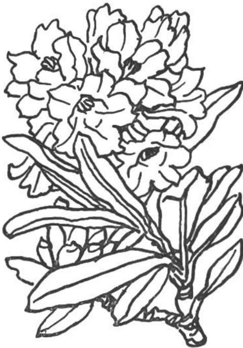
Rostblättrige Alpenrose ( Rhododendron ferrugineum ). Dieser Kleinstrauch bildet in unsern Alpen oberhalb des Waldes einen geschlossenen Gürtel. Blüht im Juni und Juli. Geschützt.