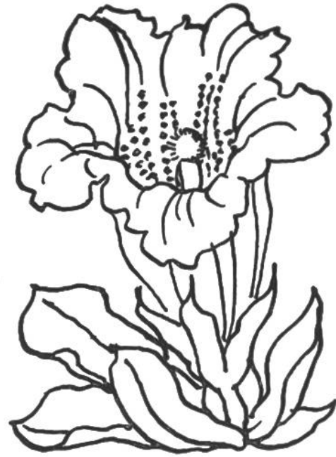
Grossblütiger Enzian ( Gentiana Clusii ). Die tiefblauen Glocken zählen zu den schönsten Frühlingsblumen. Geschützt.