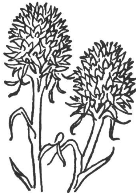
Bränderli, Männertreu ( Nigritella nigra ). Dieses stark wohlriechende Kraut blüht auf sonnigen, hochgelegenen Matten vom Juni bis August. Geschützt.