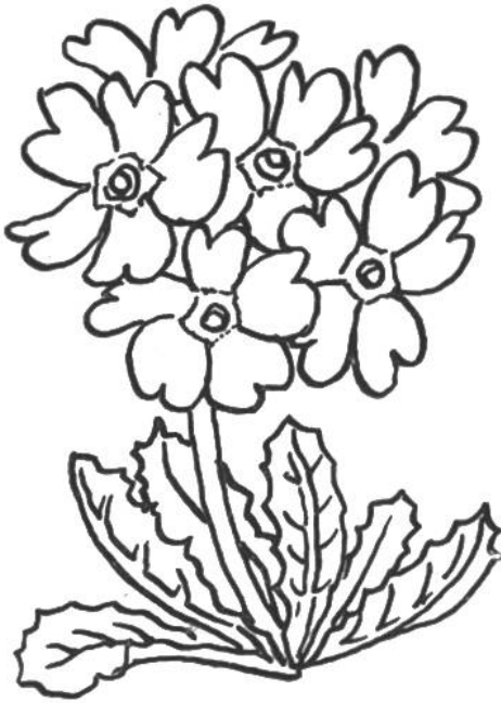
Mehlprimel ( Primula farinosa ). An sumpfigen Stellen von der Ebene bis ins Gebirge verbreitet. Frühlingsblüher. Geschützt.