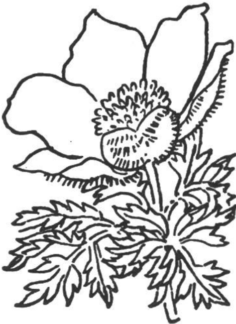
Schwefelanemone ( Anemone sulfurea ). Verwandte der weissblühenden Alpenanemone. Ersetzt diese auf Urgestein. Geschützt.