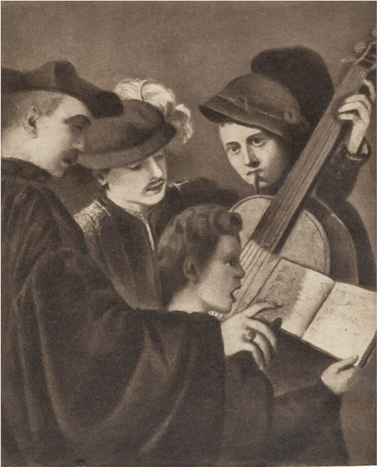
Das Konzert, von Tizian, Venedig, 1477-1576.