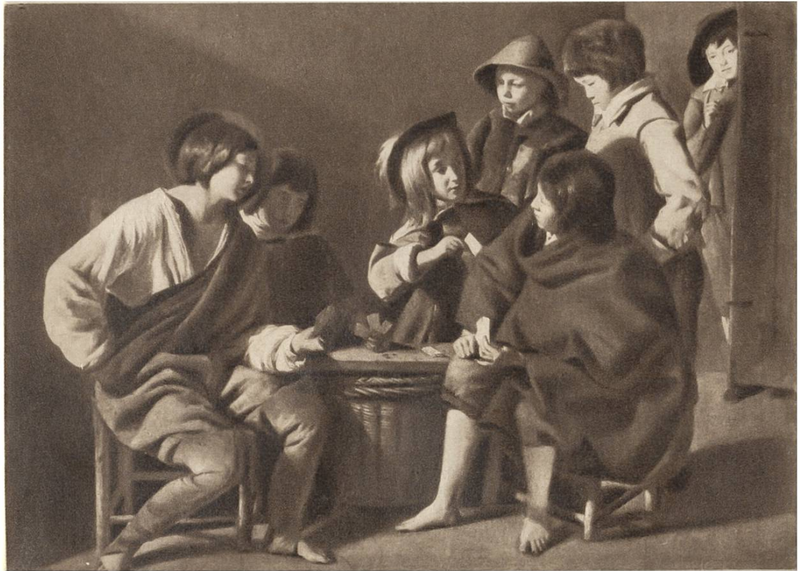
Die jungen Kartenspie- ler, v. Le Nain, Paris, um 1600.