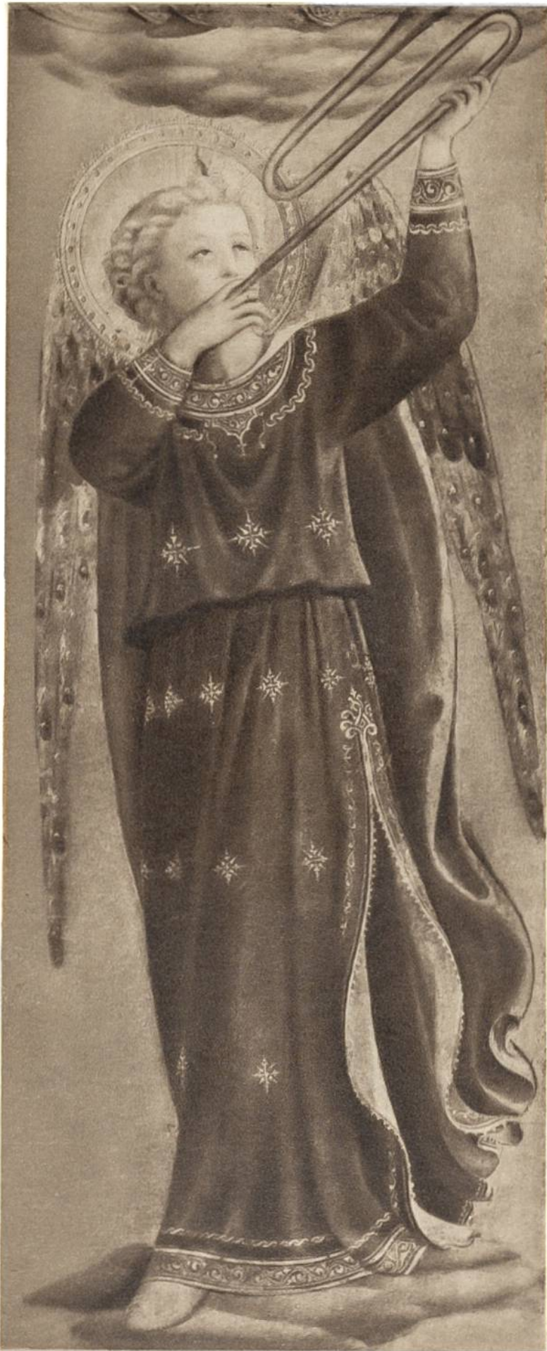
Musizierender Engel, von Fra Angelico da Fiesole, Florenz, 1387-1455.