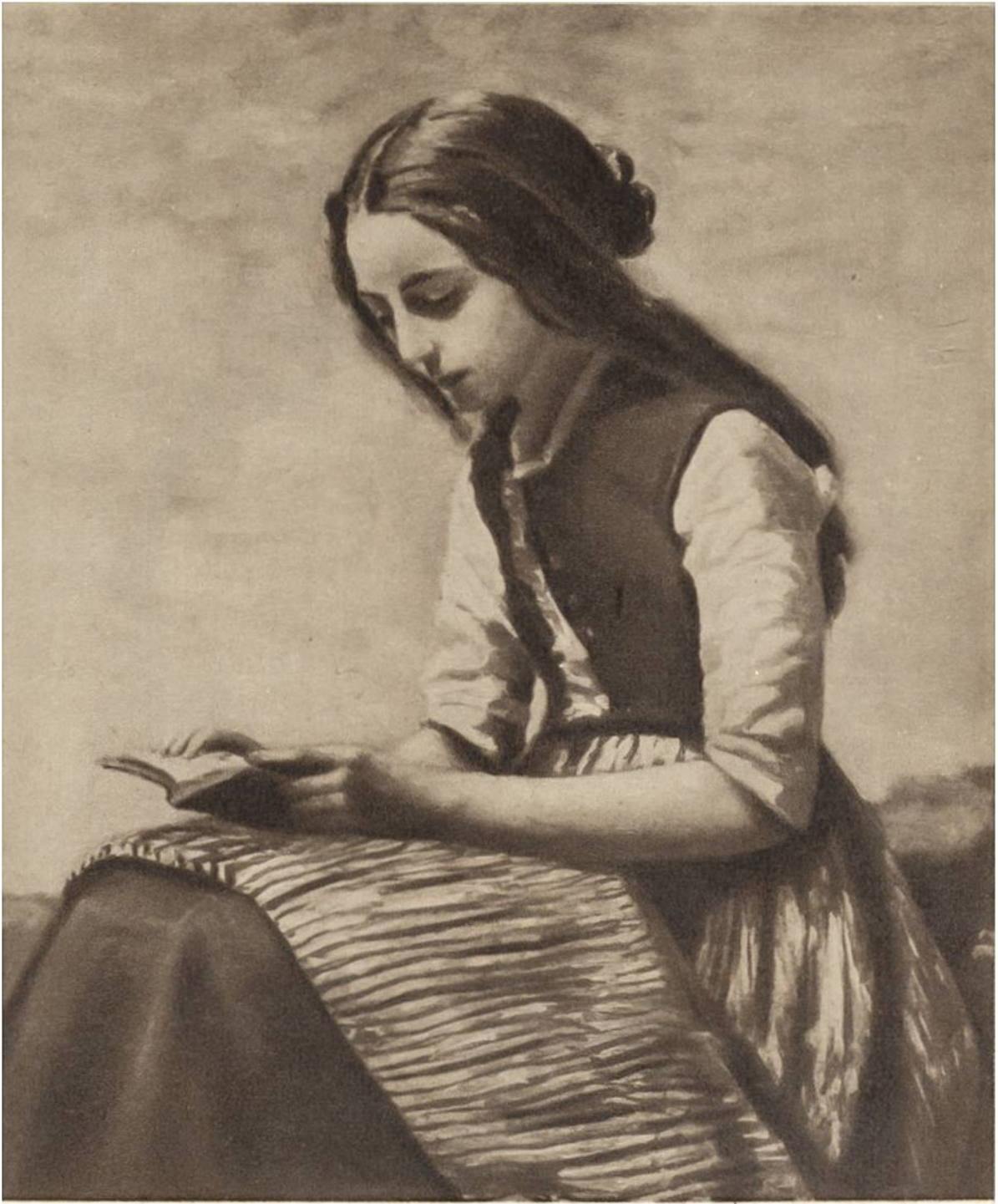
Lesendes Mädchen, von Camille Corot, Paris, 1796-1875. (Privatbesitz Winterthur.)