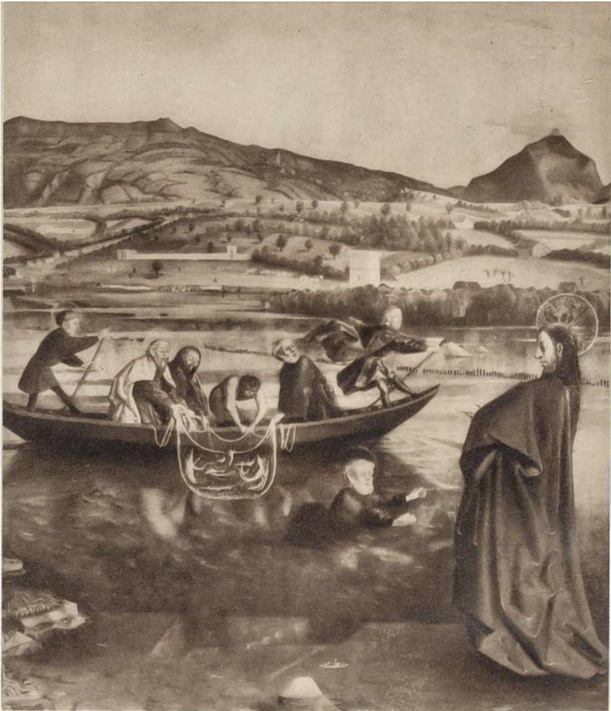
Der wunderbare Fischzug (Teilstück), von Konrad Witz, Basel, um 1395-1446. (Kunstmuseum Genf.)