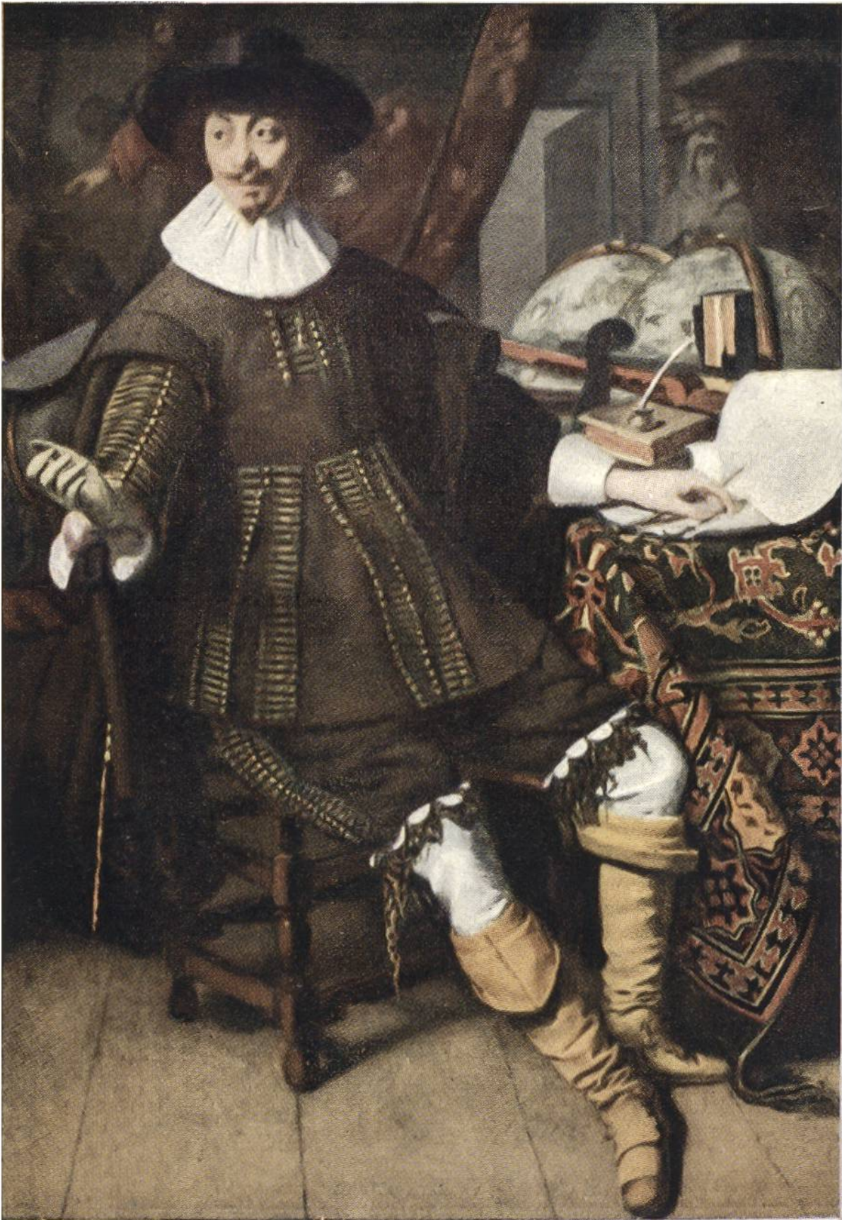
DER KAUFMANN von Thomas de Keyser, Amsterdam, 1596—1667.