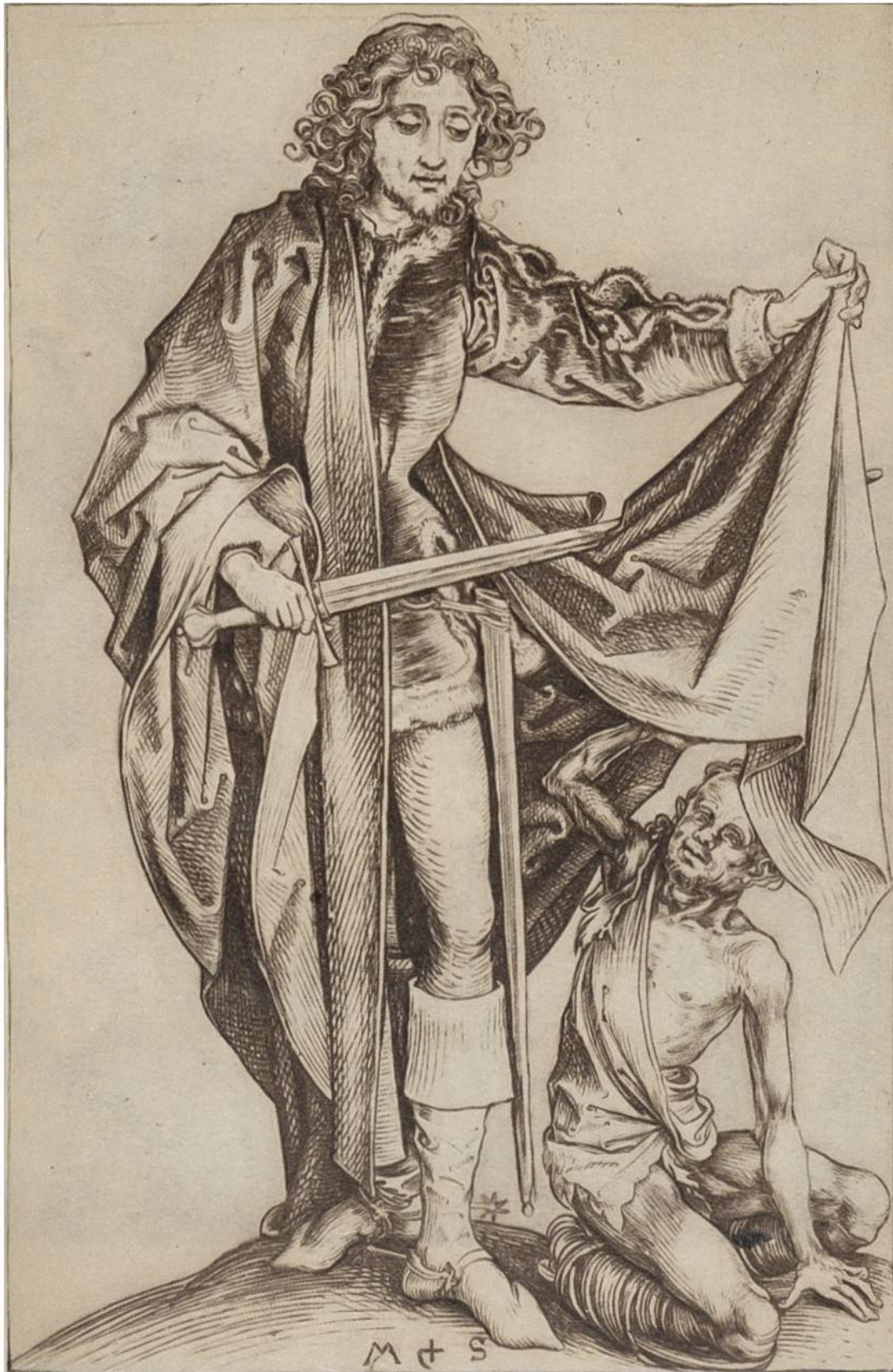
Der hl. Martin von Tours (4. Jahrhundert) schenkt dem Armen ein Stück seines Mantels, Kupferstich von Martin Schongauer, Colmar, um 1445-1491.