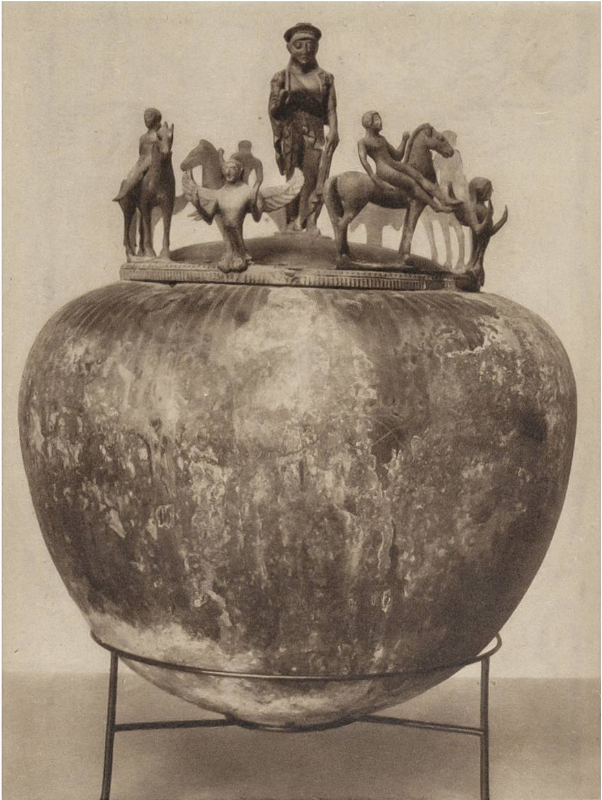
Etruskische Bronze-Urne aus dem 6. Jahrhundert v. Chr.