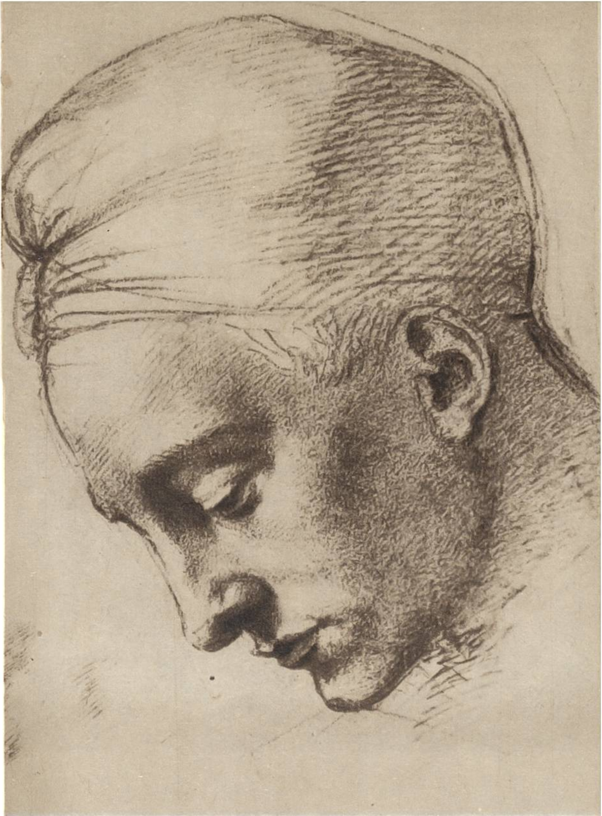
Studienkopf, Rötzelzeichnung von Michelangelo, Rom, 1475-1564.