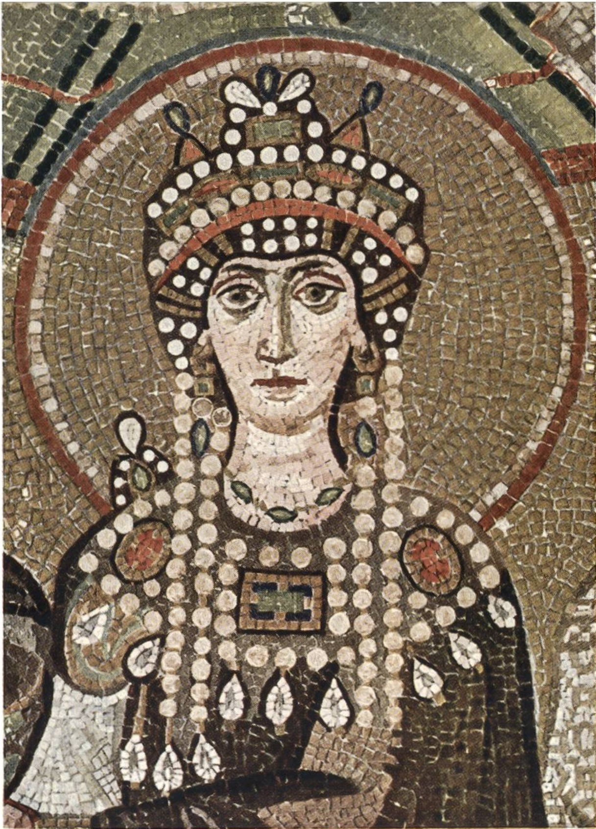
KOPF DER BYZANTINISCHEN KAISERIN THEODORA Mosaik in Ravenna aus dem Jahre 548 n. Chr.