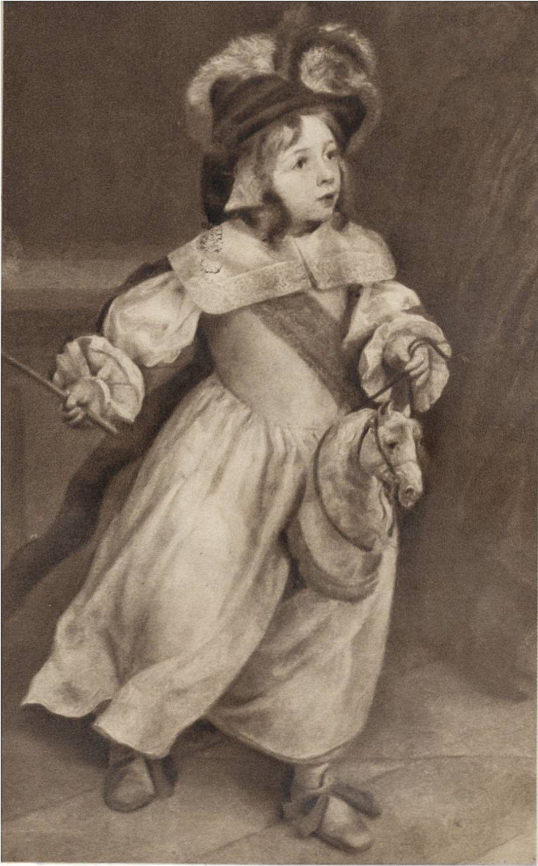
Mädchen mit Steckenpferd, aus einem Familienbild, von Gonzales Coques, Antwerpen, 1614-1684.