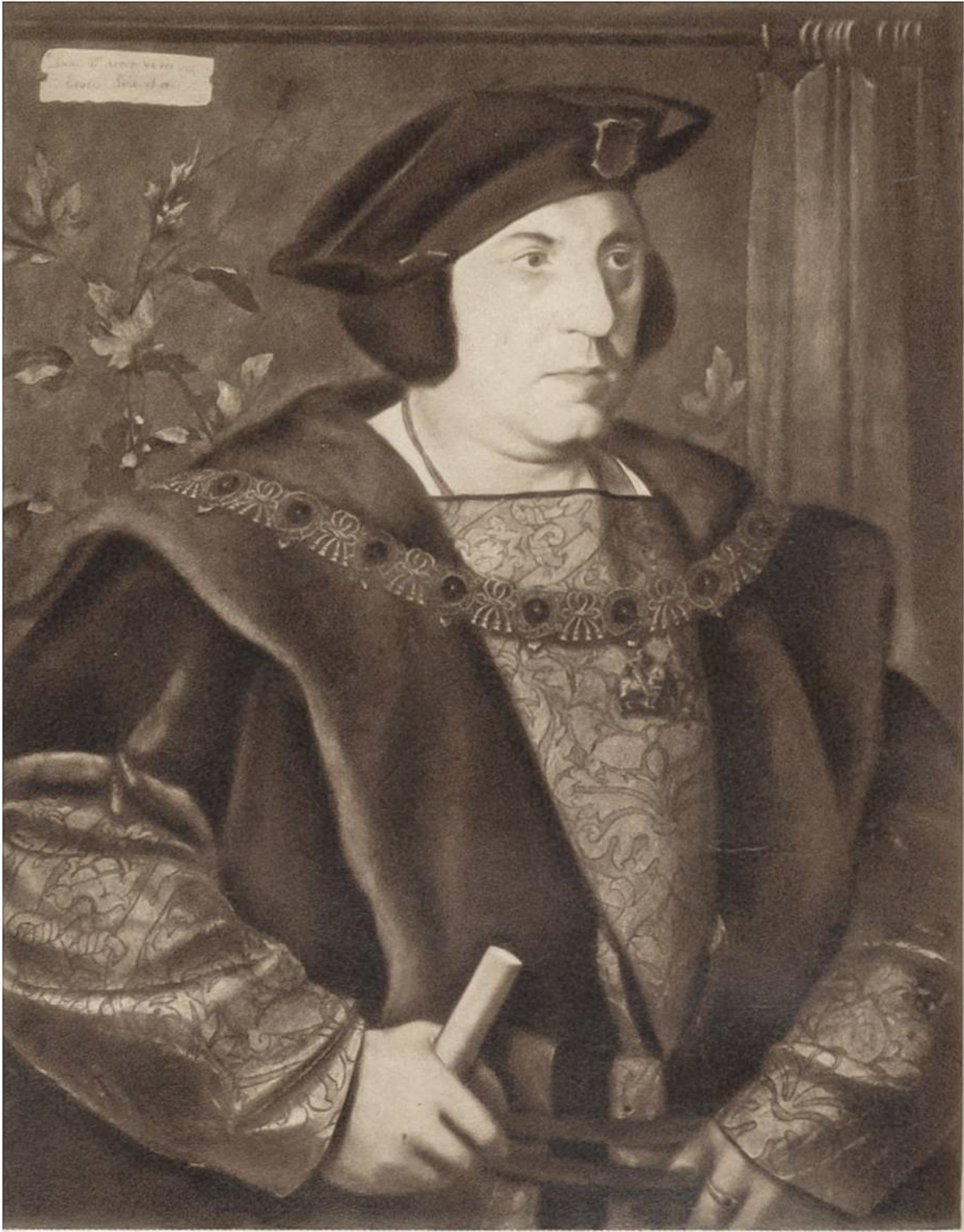
Bildnis eines englischen Adligen, von Hans Holbein d. J., Basel und London, 1497-1543.