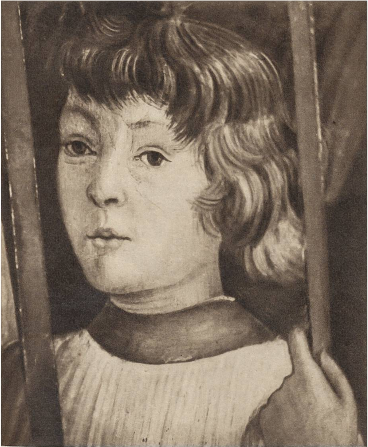
Chorknabe aus dem Freskengemälde «Tod der Santa Fina» in S. Gimignano, von Ghirlandajo, Florenz, 1449-1494.