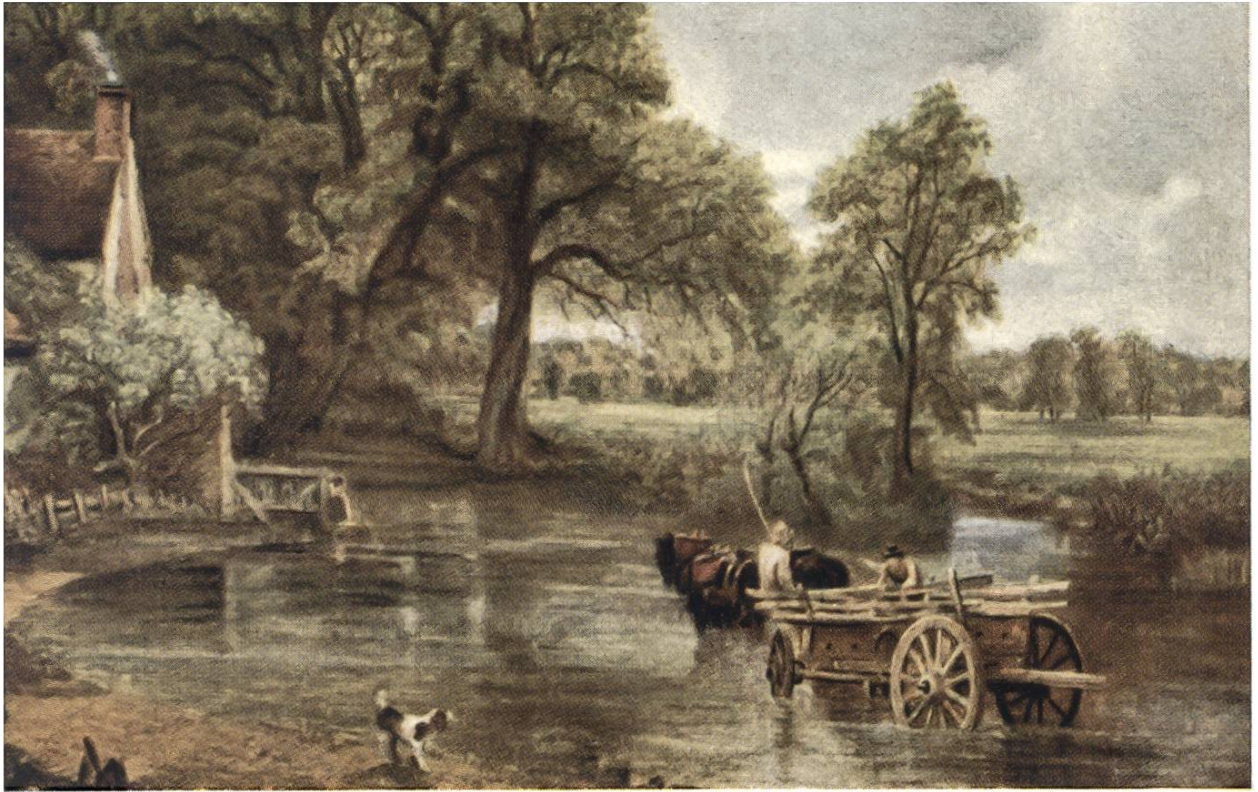
HEUWAGEN, von John Constable, London, 1776—1837.