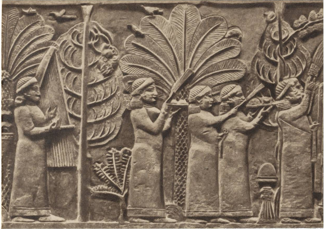
Gartenszene mit Dattelpalme, Feige und Weinstock, assyrisches Steinrelief aus dem 7. Jahrhundert v. Chr.