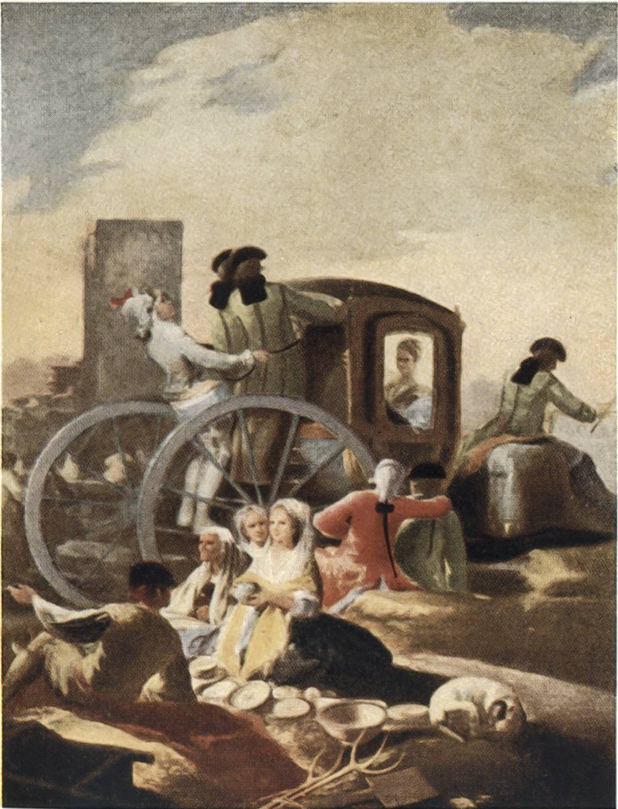
DER TÖPFERWARENHÄNDLER von Francisco Goya, Madrid, 1746—1828.