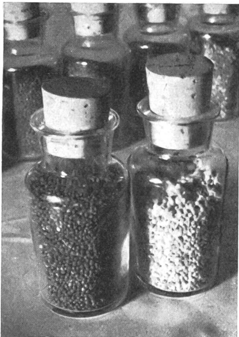
Die dunkle Rapssaat links entspricht den Qualitätsanforderungen; die Probe rechts mit den hellen Samen ist vollständig verschimmelt.

Verlustgeschäft. So war auch die besondere Anbau-, Ernte- und Nachbehandlungstechnik der alten Ölfrüchte allmählich in Vergessenheit geraten. Da die Ölgewächse vor allem während der Ernte- und Trocknungszeit sorgfältig behandelt sein wollen, wurden bei der behördlich angeordneten, starken Ausdehnung des Ölpflanzenbaus im Jahre 1944 landauf, landab Rapserntekurse durchgeführt. Dieser Aufklärungstätigkeit ist es zuzuschreiben, dass dann auch anfangs Juli im ganzen Land ungefähr die gleichartigen Erntebilder zu sehen waren. Der Raps verlangt eine frühzeitige Ernte, da die Schoten in vollreifem Zustand aufspringen und die runden schwarzen Samen mit ihrem kostbaren Ölgehalt auf die Erde kugeln und verloren gehen. Der in der Taufrische gemähte Raps wird in kleine Gärbchen gebunden und zu sogenannten „Puppen“ zusammengestellt. Acht bis zehn Tage später sind die anfangs