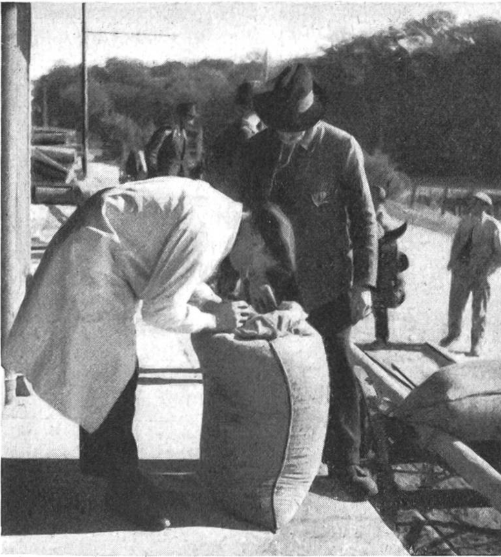
Der Aufkäufer kontrolliert jeden einzelnen Sack, der von den Rapsplanzern abgeliefert wird.

noch grünen Bäckchen der Samen einem samtigen Schwarz gewichen. Jetzt ist die Zeit der Einfahrt da. Die Puppen werden auf eine ausgelegte Blache geworfen und die Gärbchen sorgfältig auf die mit Tüchern ausgeschlagenen Wagen geladen. Die grosse Sorgfalt bei der Behandlung des Erntegutes ist notwendig, weil bei jeder heftigen Bewegung die Schoten aufspringen und die Samen raschelnd zu Boden fallen.