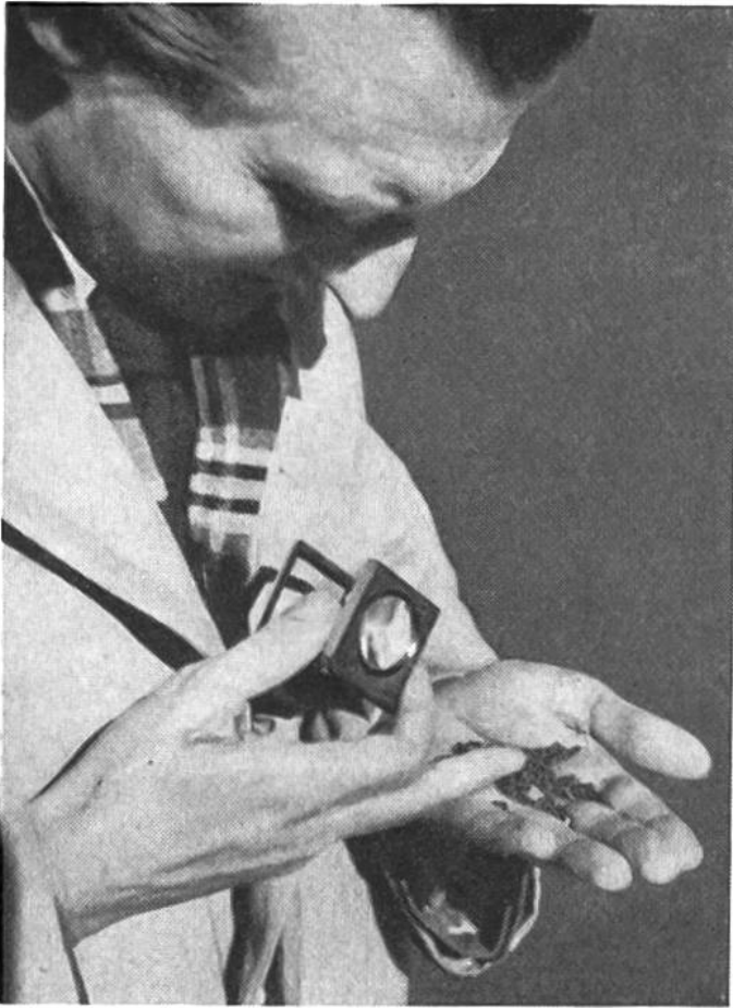
Sogar das Vergrößerungsglas dient zur Prüfung der vom Bunde zu übernehmenden Ölsaaten.

Die Eidgenossenschaft hat die Übernahme der Ölsaaten für die Landesversorgung ähnlich organisiert wie die seit dem ersten Weltkrieg bestehende Getreideübernahme. Die landwirtschaftlichen Genossenschaften nehmen als Sammelstellen die Ölsaaten der umliegenden Landwirte entgegen und leiten sie an die vom Kriegsernährungsamt bezeichneten Ölraffinerien weiter. Jeder angelieferte Rapsosten muss eine eingehende Qualitätskontrolle über sich ergehen lassen. Den offiziellen Preis von Fr. 1.50 pro Kilo erhält