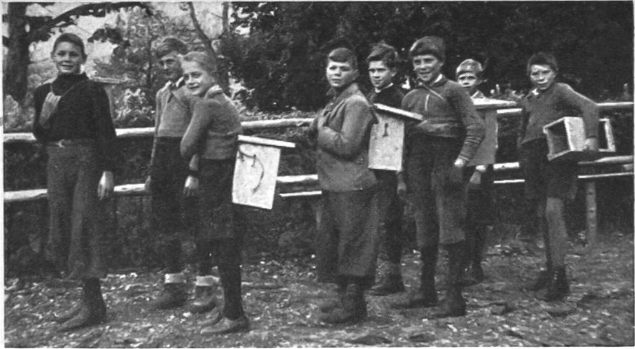
Knaben einer Primarschulklasse haben sich zu einer Vogelschutzgruppe zusammengetan. Sie rücken hier mit Nisthöhlen und Futtergeräten aus, um die aufgehängten Höhlen nachzusehen, beschädigte Kästen zu ersetzen und neue anzubringen. In der Gemeinde sind über 400 Höhlen zu kontrollieren.

Nutzpflanzen nach Beute absuchen. Jedermann vermag so zu ermessen, welch ungeheure Mengen schädlichen Getiers vernichtet werden, handelt es sich doch nicht nur um ein Meisenpaar und eine Vogelart. Die Stare sollen ebenso eifrig und die Gartenrotschwänzchen gar noch fleissiger sein. Es sind auch nicht bloss die kleinen Singvögel, die uns im Kampfe gegen die Schädlinge beistehn; die meisten Raubvögel, besonders Eulen, Bussarde und Turmfalken verdienen als eifrige Mäusejäger nicht weniger unsern Schutz. Magenuntersuchungen an toten und verunglückten Vögeln haben gezeigt, dass einige Eulenarten beinahe ausschliesslich tierische Schädlinge vertilgen, vor allem Mäuse und Ratten.