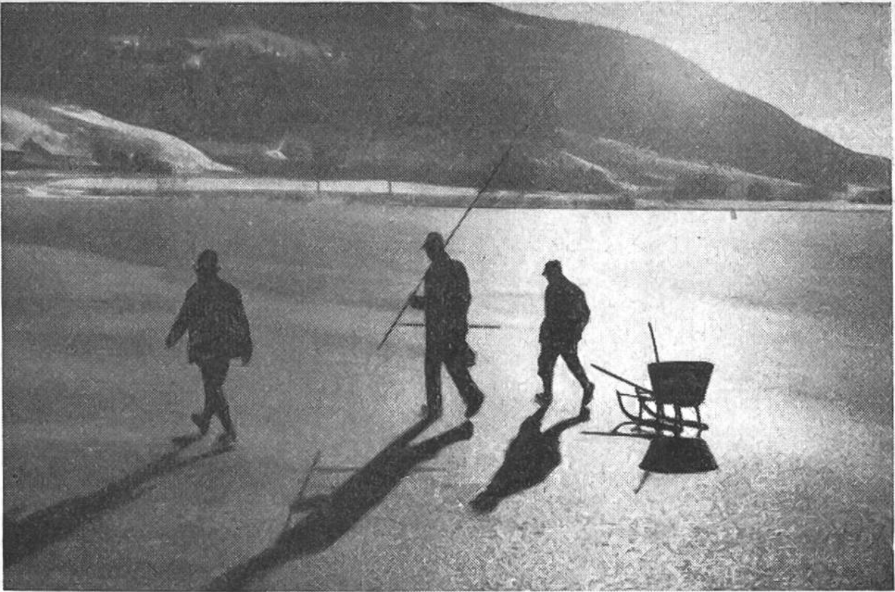
Die Netzfischer ziehen mit Schlitten zum Fischfang im zugefrorenen Lac de Joux (Jura) aus. Sie tragen Netze, lange Stangen, Äxte und Seile mit sich.