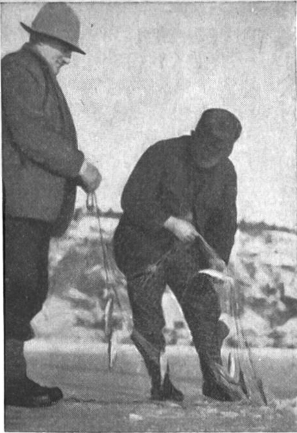
Nach einigen Stunden, wohl auch erst nach Tagen, wird das Netz aus dem Zugloch herausgezogen.