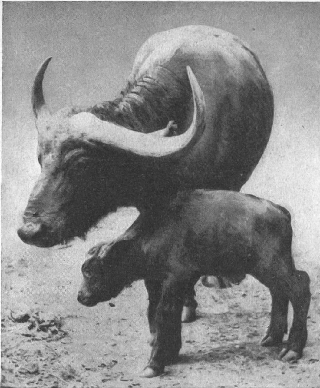
Indische Wasserbüffel-Kuh mit Kalb.

nämlich den Wasserbüffel oder Kerabau, der überall dort gewaltige Bedeutung besitzt, wo Reis angebaut wird. Als ein schweres, gern im Sumpf lebendes Tier eignet sich der Wasserbüffel wie kein anderes Geschöpf zur Bearbeitung der unter Wasser stehenden Reisfelder; aber auch als Zug- und Reittier, als Fleisch- und Milchlieferant leistet er dem Menschen unschätzbare Dienste. Seine Verbreitung erstreckt sich von Japan und Südchina bis nach Ägypten und Oberitalien, wo er überall den Menschen beim Anbau von Reis, diesem überaus wichtigen Nahrungsmittel, unterstützt. H.