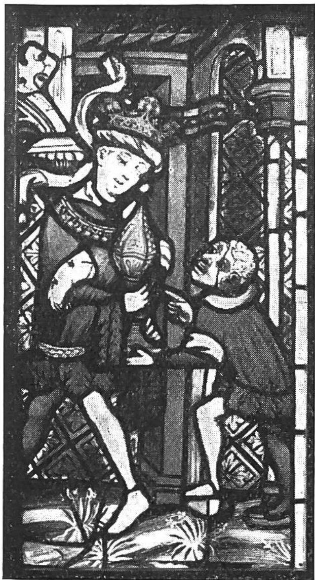
König Kaspar betritt den Stall von Bethlehem. Ausschnitt aus der Anbetung der heiligen Drei Könige in der Nikolauskirche auf dem Staufberg. 15. Jahrhundert.

ne jüngste König, um sein Versäumnis nicht zu mehrer, das Prunkgeschenk für den Christusknaben gleichsam im „Stafettenlauf“ übernehmen muss.