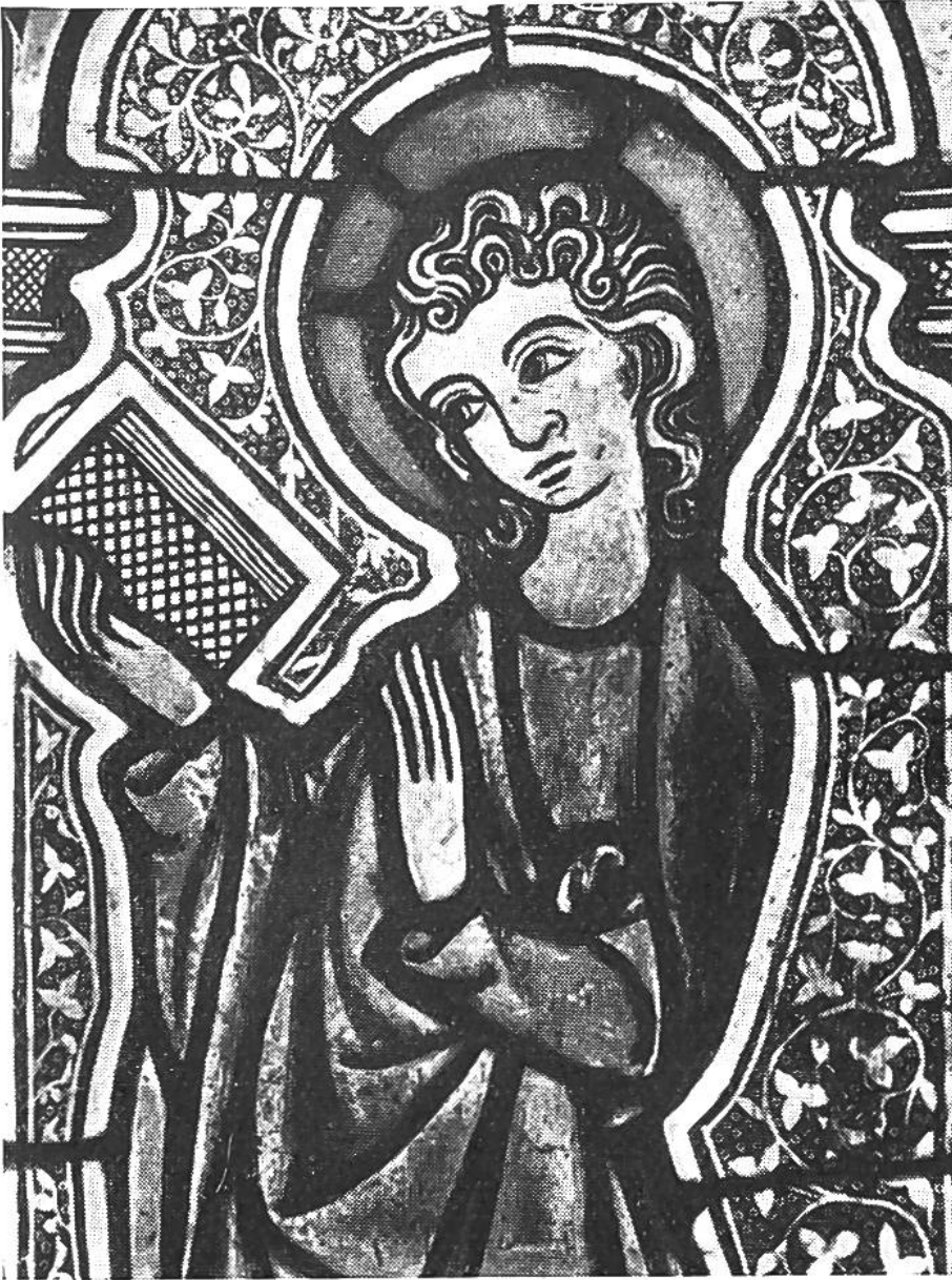
Der Evangelist J o h a n n e s. Ausschnitt aus der Kreuzigung Christi in der Laurentiuskirche von Oberkirch. 14. Jahrhundert.

Dreizahl voll zu machen, die Figur des hl. Laurentius beigesellt. Obschon die sechs Gestalten durch weite Abstände voneinander getrennt sind, so erscheinen sie trotzdem nicht als stark gesonderte Einzelwesen. In stiller Demut sanft sich neigend, zeigen sie alle dasselbe Gepräge. Ihre Umrisse werden von einer Strömung bewegt, deren anmutiges Spiel den Betrachter mehr und mehr anzieht. Er vernimmt eine leise schmachtende Musik und wird durch solche Klänge aus dem Alltagsleben emporgehoben.