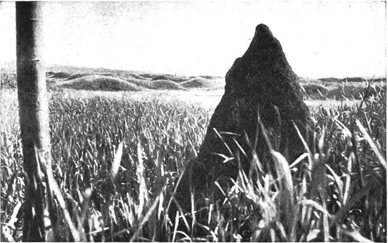
Übermannshoher Termitenhügel in der afrikanischen Steppe.