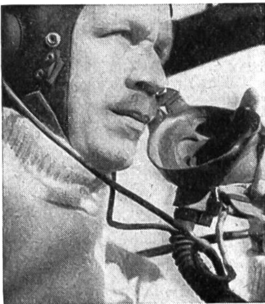
Ein Teilnehmer am Flug in die nördlichen Polargebiete mit dem Sauerstoffgerät für die Atmung in grossen Höhen.

interessantes Erlebnis hatte der Funker dieser Expedition: er war beim Überfliegen des Pols der erste Radio-Operator der Welt, der bei der Anpeilung das Ergebnis „Null-null-null“ erhielt.