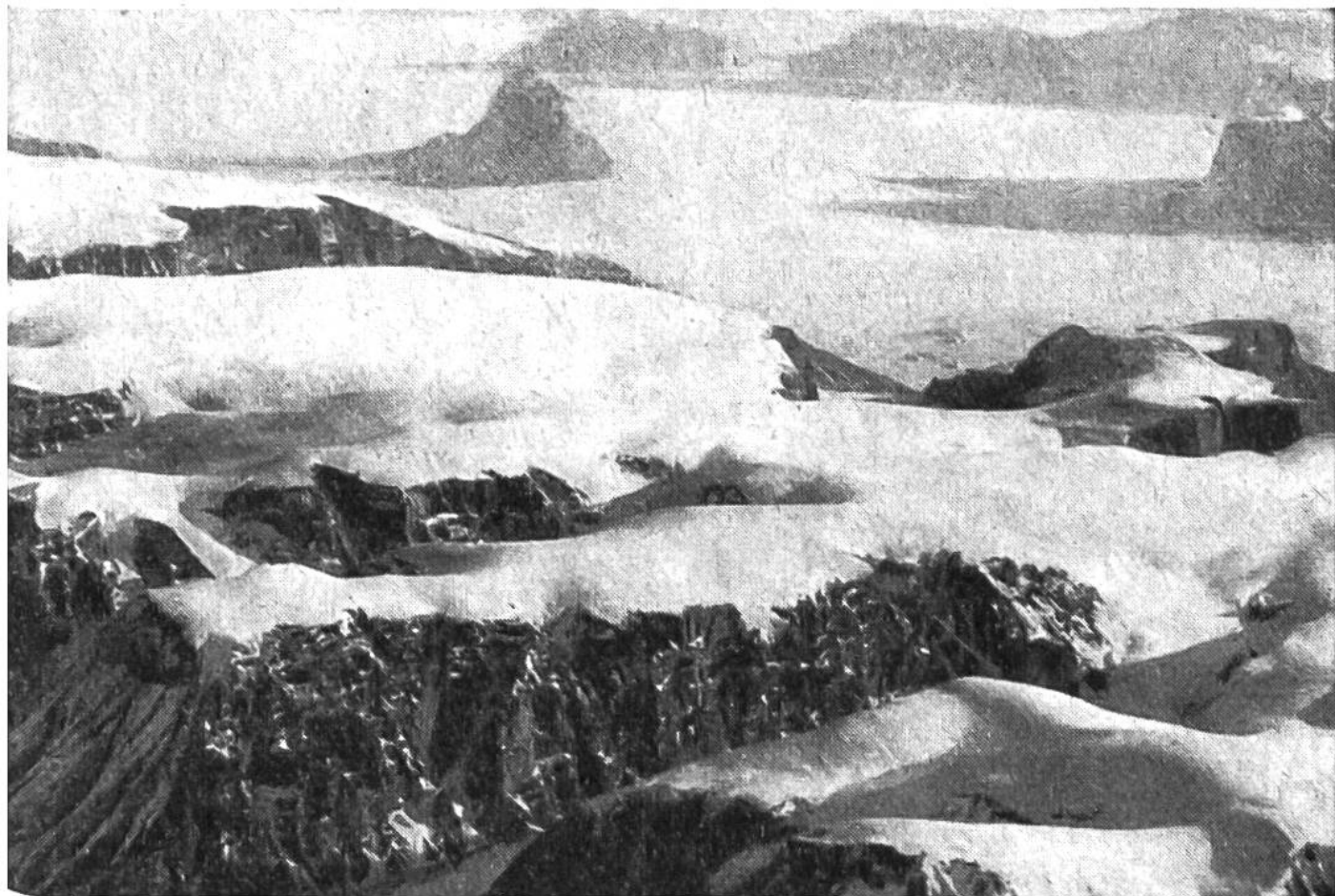
Beim Flug zum magnetischen Südpol der Erde breitete sich unter den Flügeln des Flugzeugs ein grandioses Panorama von unberührten Schneebergen aus.

„Erde“ liegen. Er fällt allerdings nicht mit dem geographischen Nordpol zusammen und ändert seine Lage ständig. (Der magnetische Nordpol liegt entsprechend in der Nähe des geographischen Südpols.) Für die Schifffahrt und die Luftfahrt ist es aber von grosser Wichtigkeit zu wissen, wie gross die Abweichung ist. Die Ross-Expedition hatte im Jahre 1831 bei der Entdeckung der Halbinsel Boothia Felix in Nordkanada die Lage des magnetischen Südpols beim Kap Adelaide mit 68^{\circ} 18' nördl. Breite und 96^{\circ} 27' westl. Länge angegeben. 1928 wurde seine Lage mit 70^{\circ} 30' nördl. Breite und 96^{\circ} 46' westl. Länge festgestellt. Eine kanadische Luftexpedition, die im Mai 1945 in das nördliche Polargebiet flog, konnte eine neuerlich veränderte Lage beobachten; der verantwortliche Meteorologe fand nach genauen Messungen den magnetischen Südpol etwa 400 km weiter nordwestlich und zwar 2400 km vom geographischen Nordpol entfernt. Ein