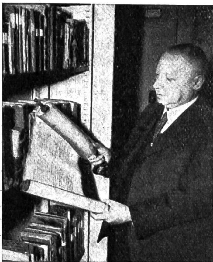
Der Leiter der hebräischen und jiddischen Abteilung liest auf einer Schriftrolle das „Buch Esther“.

Bibliotheken haben die Aufgabe zu erfüllen, die seit Jahrhunderten gedruckten und seit Jahrtausenden geschriebenen Werke der Menschen zu sammeln, vor dem Untergang zu retten und, gemeinsam mit zeitgenössischen Druckschriften, den heutigen Lesern zugänglich zu machen. Selbstverständlich berücksichtigt das Bibliothekswesen jedes einzelnen Landes in erster Linie die Leistungen des eigenen Volkes; so auch die Schweizerische Landesbibliothek in Bern. Je grösser aber die zur Verfügung stehenden finanziellen Mittel, desto umfangreicher und mannigfaltiger vermag sich die Sammlertätigkeit der beauftragten Büchereibeamten zu entfalten. Amerika, das Land der Rekorde, hat daher in weniger als 150 Jahren eine der grössten Bibliotheken der Welt zusammengetragen lassen können. Die im Jahr 1800 gegründete Kongress-Bibliothek in Washington beherbergt heute rund 7 Millionen Bü-