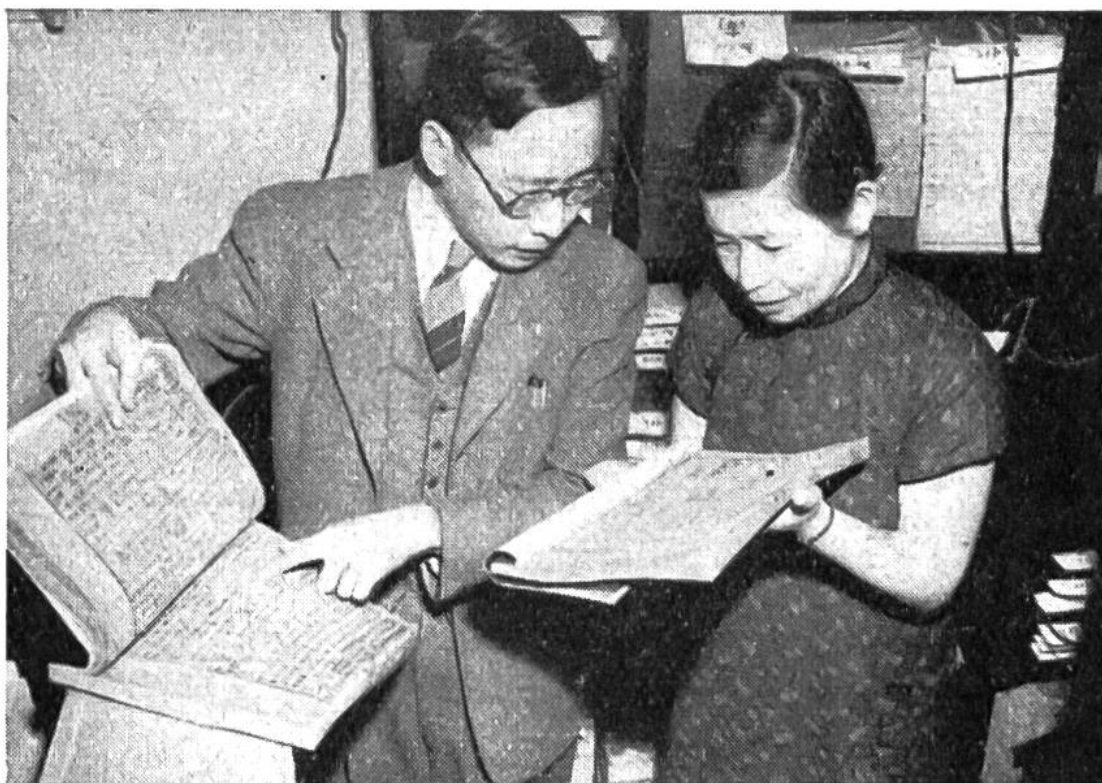
Die chinesische Abteilung birgt viele kostbare Schätze alten und neuen ostasiatischen Schrifttums.