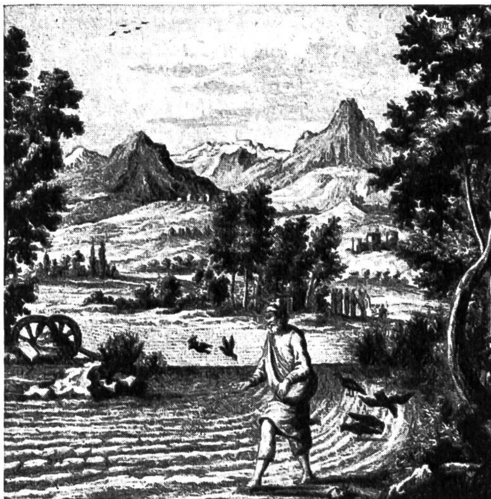
Ein Sämann gehet aus zu säen. Aus der Physica sacra von J. J. Scheuchzer, 1735.