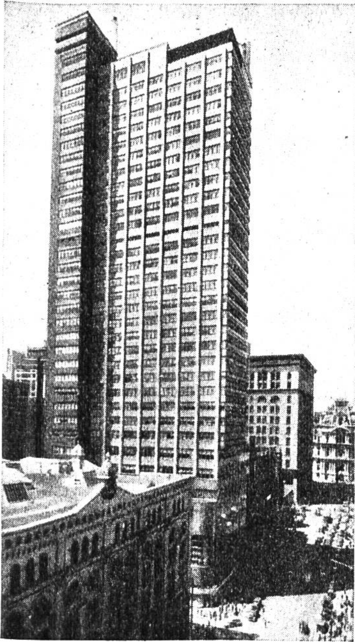
Die „Sparkasse“ von Philadelphia braucht nicht so sehr Schalterhallen als vielmehr eine Unzahl Büroräume.

eines Jahrhunderts zur angesehenen Stadt auswachsen sollte. Im gleichen freiheitlichen Geist versammelte sich hier 1774 der nordamerikanische Kongress, um am Nationaltag des 4. Juli 1776 die Unabhängigkeit von 13 nordamerikanischen Staaten zu verkünden. In Philadelphia wurde kurz darauf auch die Verfassung dieser ursprünglich 13 Vereinigten Staaten von Amerika entworfen, nachdem dort der treffliche Benjamin Franklin als Kongressmitglied gewirkt und George Washington, in eben dieser Stadt zum Oberbefehlshaber der