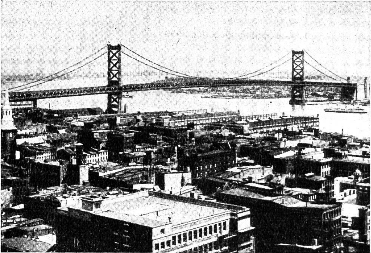
Jenseits der 583 m langen Hängebrücke über den Delaware erstreckt sich die Stadt Philadelphia (in Pennsylvania) sogar in einen andern Bundesstaat (New Jersey).

Truppen gewählt, den Sieg errungen hatte. Unter diesem bedeutenden ersten Präsidenten der Vereinigten Staaten war Philadelphia sogar von 1790–1800 Bundeshauptstadt.