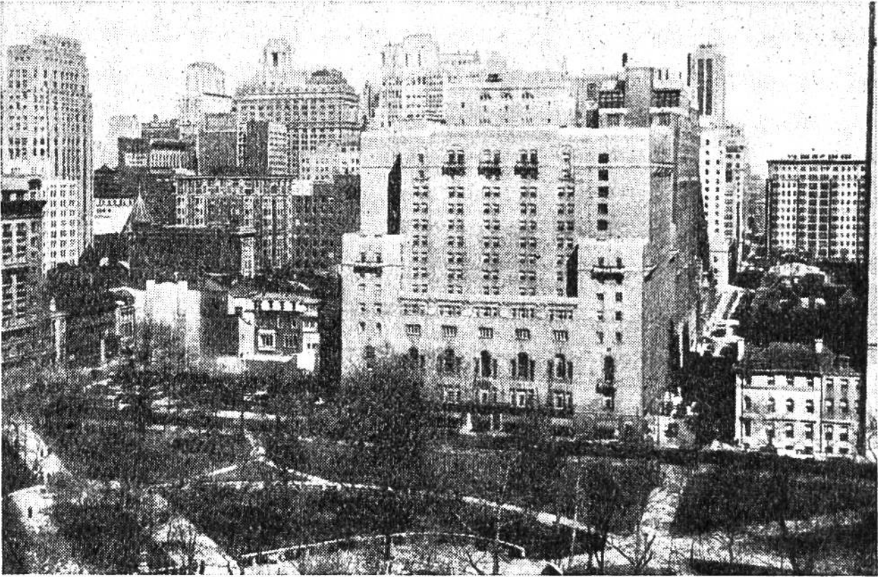
Als Oase im dicht gedrängten, modernen Geschäftsviertel liegt der alte Ritterhouse-Platz.

Sternwarte, Wasserversorgungswerke und Gemäldegalerien befinden, während sich ein zoologischer Garten dem grünen Areal anschliesst. Doch auf dem Delaware-Fluss, der nach 50 Kilometern schon die Bay und den Atlantischen Ozean erreicht, herrscht keineswegs die zu erwartende Stille: da laufen im modernen und gross angelegten Binnenhafen jährlich 12 000 Frachtschiffe durch die über 11 m tiefe Fahrrinne ein, bringen Zucker, Chemikalien, Wolle, Baumwolle und nehmen vor allem Kohle, Erdöl und Tabak mit sich. Und auch hinter den Schiffswerften wird in riesigen Fabriken gearbeitet, an Eisen und Stahl, im Lokomotivbau, in chemischer Industrie, im Textilgewerbe, im Verlagswesen. Wir aber auf dem europäischen Festland vernehmen durch den Äther aus jener werkenden, praktischen, nüchternen Stadt als einzigen und wunderschönen Gruss die Konzerte des berühmten Philadelphia-Orchesters mit den ausgesuchtesten Streichern der Welt!