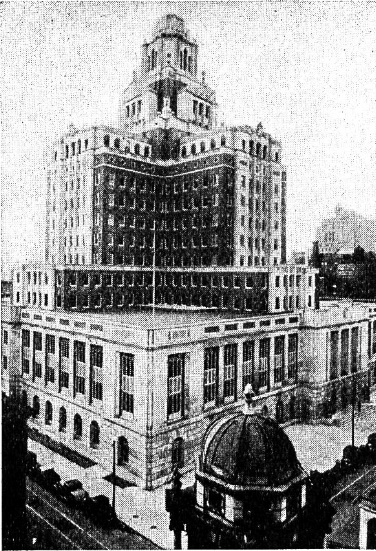
Terrassierung und Gliederung des Zollhauses von Philadelphia ermöglichen das Einfallen des Lichts in möglichst viele Arbeitsräume und auf die Strasse.

nenstadt Washington zurücklegen, so würden wir in fast gerader Linie ausser den beiden genannten noch eine ganze Reihe von ausgedehnten Großstädten zu sehen bekommen, darunter Baltimore, das bald die Millionengrenze erreichen wird, und Philadelphia, welches in seinem Häusermeer rund zwei Millionen Menschen beherbergt.