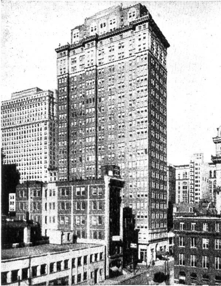
Vierundzwanzig Stockwerke neben einem zweistöckigen Gebäude – ein für Philadelphia typisches Gemisch.

keine Seltenheit mehr. Dreissigstöckige Hotels, Warenhäuser und Verwaltungsgebäude überragen als eigene Stadt das Häusermeer. Verschiedene Dimensionen hat der heutige Verkehr zusammenzuzwingen: hier die Untergrundbahn, die Strassenbahn, der Autobus, da der Fahrstuhl, der in Minutenbruchteilen die höchsten Stockwerke erreicht. Während drunten in den eng erscheinenden Strassen Lärm und Hast vorherrschen, umgibt die Hotelzimmer, Verkaufsabteilungen und Büros hoch oben dieselbe Ruhe hinter Glas und Beton, wie sie weit draussen in den Einfamilienhäuschen genossen wird.