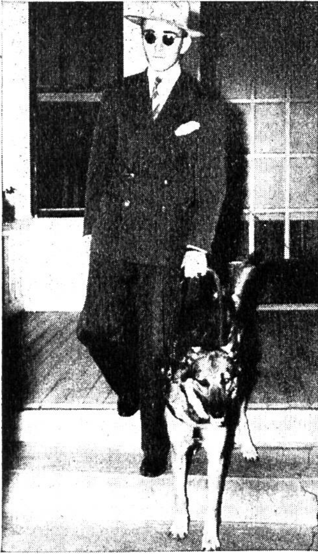
Die Hunde sind die besten Freunde ihrer blinden Meister. In Amerika nennt man sie das „sehende Auge des Blinden“.

Die Blinden aber vermögen die Augen nicht nach fünf Minuten zu öffnen. Sie müssen immer in ihrer Nacht verharren, in jener finsternen Einsamkeit, die sie wie eine Mauer von jenem Leben trennt, das die sehenden Menschen führen. Sind sie darum dem Leben verloren? – Nein, man tut alles, um Tausende von Menschen, die entweder blind geboren wurden oder durch Krieg, Krankheit oder Unglücksfall ihr Augenlicht verloren haben, dem Leben wiederzugeben. In Amerika ist man zum Beispiel dazu übergegangen, den Blinden sogenannte „sehende Augen“ zu verschaffen, das heißt, man richtet besondere Blindenhunde für sie ab, die ihren Meistern bei allen Gelegen-