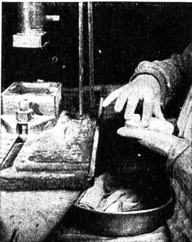
Blinde formen und pressen Seifenstücke.

Arbeit bietet ihnen schönste Befriedigung; sie verbindet sie mit dem Leben des Lichts und der Farben, und sie reiht sie als vollwertige, gleichberechtigte Bürger in die menschliche Gesellschaft ein.