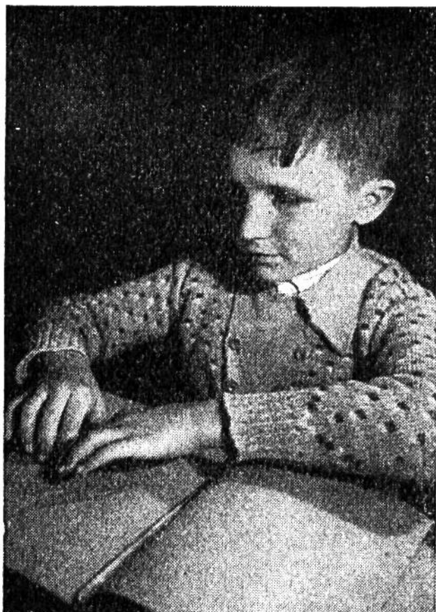
Blinde Schüler lernen in der vom blinden Franzosen Braille erfundenen Blindenschrift lesen u. schreiben.

übergibt man ihn einem Blinden. Es dauert vielleicht Wochen, bis er sich an den neuen Meister gewöhnt hat, doch dann wird er dessen bester Freund und ist ihm überall im Leben das „sehende Auge“. Aber nicht nur durch fremde Hilfe sollen die blinden Menschen dem Leben wiedergegeben werden, sondern vor allem durch ihre eigene Kraft. In besonderen Schulen werden sie unterrichtet; an Stelle des Augenlichtes muss das hochentwickelte Tastgefühl treten. Alles, was der Gesunde sieht, muss der Blinde „ertasten“. Die von dem blinden