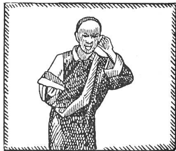
Ein Türke begrüsst seinen Gast. Tibetaner strecken die Zunge heraus.