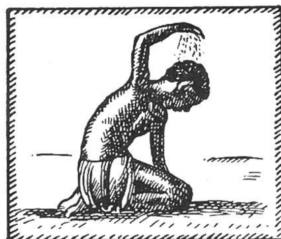
Hindus berühren Brust, Erde, Stirn. Der Kaffer streut Staub aufs Haupt.