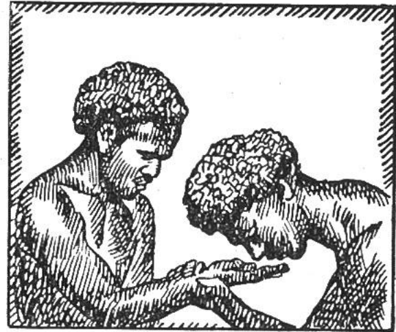
Der Nasengruss bei den Kalmücken. Auf Fidschi beriecht man die Hand.

der Kaffer nimmt Staub, wenn er grüssen will, und streut ihn sich aufs Haupt. Abessinier knien nieder und küssen die Erde, und die Kalmücken reiben die Nasen aneinander. – Bei vielen Naturvölkern ist die Begrüssung eine lange, umständliche Zeremonie, und zwar deshalb, weil sich der Primitive vor allem Fremden fürchtet, weil er Geister und Dämonen wittert und darum den zu Begrüssenden genau kennen will, bevor er sich näher mit ihm einlässt. Die Tubus, ein Volksstamm der östlichen Sahara, leiten die Begrüssungen dadurch ein, dass sie sich in beträchtlicher Entfernung von einander aufstellen, die Gesichter verhüllen und während längerer Zeit Fragen hin- und herrufen. Darauf schreien sie in allen Tonarten: „Ihilla!“ murmeln dieses Wort noch eine Zeitlang und fragen weiter. Schliesslich kommt ein Gespräch