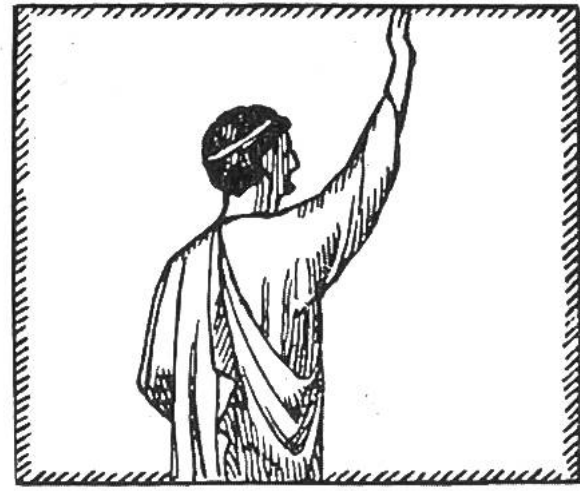
Die Begrüssung bei den Ägyptern. Römergruss: „Ave!“ und „Vale!“

fühl viel ausgeprägter ist als in den Städten, wird richtig und sinnvoll gegrüsst. Kein Bauer lässt einen andern vorbeigehen, ohne ihm ein Grusswort zu schenken; er beweist dadurch, dass jeder zu andern Menschen eine Beziehung hat.