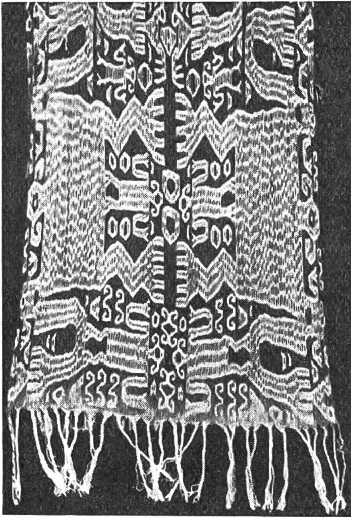
Im Ikat-Verfahren blau-weiss gemustertes Baumwolltuch mit stark stilisierten menschlichen Figuren.

Dies hat zur Folge, dass bestimmte Färbvorgänge sehr lange dauern. Für tiefe Blautöne benötigt man oft bis 2 Jahre und gewisse Rotfärbungen ziehen sich über 6–12 Jahre hin. Nun kennt man aus Asien und Amerika Ikatgewebe, die nicht bloss in einer, sondern in drei bis vier Farben gemustert sind. Sowohl die mühsamen Abbindarbeiten als auch die langwierigen Einfärbungen müssen in solchen Fällen entsprechend oft wiederholt werden. Frauen, die solche Verfahren erfunden haben und in so