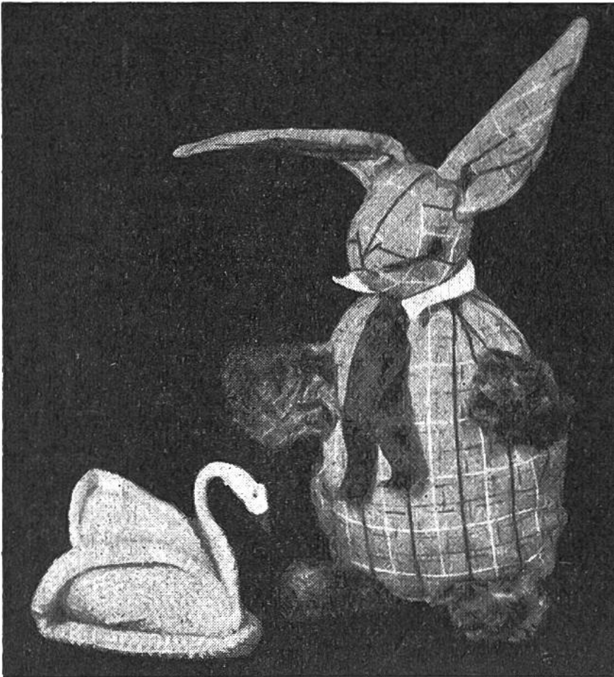
Schwan u. Hase, die lustigen Ge- schenkatrappen.

wir als Boden, linke Seite nach oben. Nun nähen wir zwei Teile (Flügel) links und rechts leicht am Unterteil fest, jeweils die rechte Seite nach aussen; der Rand rollt sich dann von selbst etwas nach aussen ein. Der vierte Teil bildet oben das Mittelstück (Körper); wir nähen es links und rechts an den Seitenteilen an, etwa in deren Mitte. Jetzt sind noch Hals und Kopf des Schwans herzustellen. Wir umwickeln ein 15 cm langes Stück starken Drahts mit weisser Wolle, und zwar am Kopfstück etwas dicker als am Hals. Für den Schnabel nehmen wir rote Seide, und als Augen heften wir zwei Knötchen aus schwarzem Garn ein. Nun wird das Halsende etwa 4 cm tief vorn in der Mitte zwischen Unter- und Seitenteilen eingeschoben. Zuletzt nähen wir alle Teile beim Austritt des Halses fest zusammen.