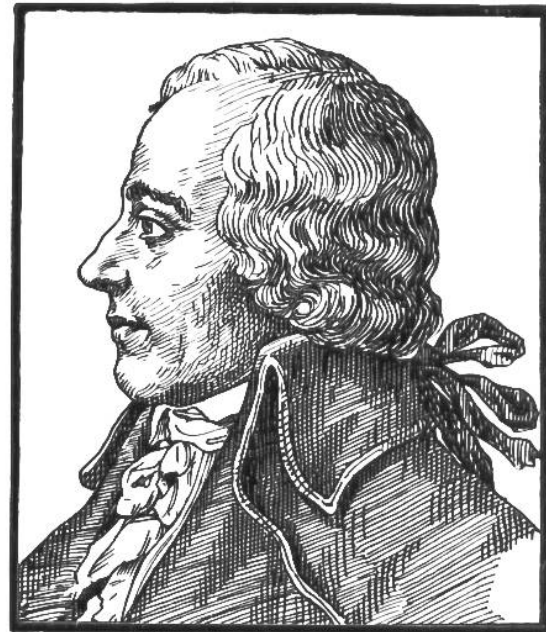
Pierre Simon Laplace,

(200. Geburtstag am 17. Mai) englischer Arzt, Begründer der Pockenschutzimpfung, * 17. Mai 1749 in Berkeley, † 26. Januar 1823 daselbst, war seit 1772 Wundarzt. Eine Bäuerin machte ihn darauf aufmerksam, dass Melker, die ungefährliche Kuhpocken gehabt hatten, gegen Menschenpocken (Blattern) unempfindlich seien. Diese Beobachtung führte Jenner zur Schutzimpfung, die er 1796 erstmals und mit Erfolg anwendete. Dank der bald in der ganzen Welt eingeführten Schutzimpfung ist die gefährliche Seuche, die in Europa jährlich ca. 400 000 Todesopfer gefordert hatte, heutzutage fast ganz verschwunden. Das engl. Volk ehrte Jenners Verdienste durch zwei grosse Geldspenden.