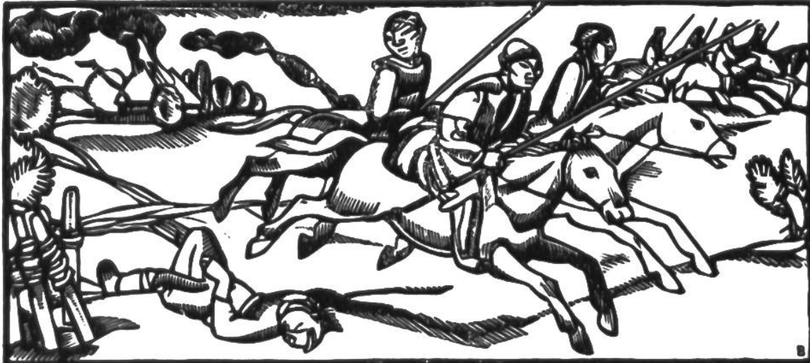
Mongolenvölker dringen in Europa ein.

oberung Galliens durch Julius Cäsar. 49–45 Bürgerkrieg zw. Cäsar u. Pompejus. Triumvirat. 44 Ermordung Cäsars. 30–476 n. Chr. Rom unter Kaisern. 29 Augustus röm. Kaiser. Blüte der römisch. Literatur. Virgil, Ovid, Horaz, Titus Livius. Nach Christus. 9 Der röm. Feldherr Quintilius Varus wird vom Cheruskerfürsten Arminius (Hermann) im Teutoburgerwalde besiegt. 64–311 Zeit der Christenverfolgungen durch verschiedene römische Kaiser. 69 Helvetischer Aufstand, Julius Alpinus. 313 Kaiser Konstantin erhebt das Christentum z. Staatsreligion. 337 Teilung des röm. Reiches. 375 Beginn d. Völkerwanderung.