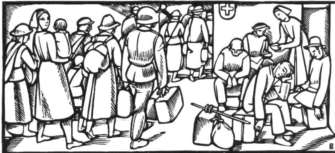
Zivilflüchtlinge erreichen die Schweizer-Grenze.

land u. Frankreich u. zwischen Italien u. Frankreich. Abschluss des Drei-Mächte-Paktes in Berlin zwischen Deutschland, Italien u. Japan.