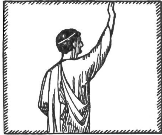
Die Begrüssung bei den Ägyptern. Römergruss: „Ave!“ und „Vale!“

fühl viel ausgeprägter ist als in den Städten, wird richtig und sinnvoll gegrüsst. Kein Bauer lässt einen andern vorbeigehen, ohne ihm ein Grusswort zu schenken; er beweist dadurch, dass jeder zu andern Menschen eine Beziehung hat.