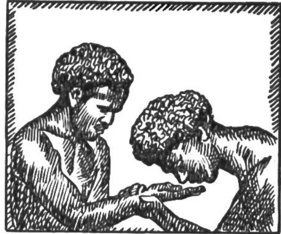
Der Nasengruss bei den Kalmücken. Auf Fidschi beriecht man die Hand.

der Kaffer nimmt Staub, wenn er grüssen will, und streut ihn sich aufs Haupt. Abessinier knien nieder und küssen die Erde, und die Kalmücken reiben die Nasen aneinander. – Bei vielen Naturvölkern ist die Begrüssung eine lange, umständliche Zeremonie, und zwar deshalb, weil sich der Primitive vor allem Fremden fürchtet, weil er Geister und Dämonen wittert und darum den zu Begrüssenden genau kennen will, bevor er sich näher mit ihm einlässt. Die Tubus, ein Volksstamm der östlichen Sahara, leiten die Begrüssungen dadurch ein, dass sie sich in beträchtlicher Entfernung von einander aufstellen, die Gesichter verhüllen und während längerer Zeit Fragen hin- und herrufen. Darauf schreien sie in allen Tonarten: „Ihilla!“ murmeln dieses Wort noch eine Zeitlang und fragen weiter. Schliesslich kommt ein Gespräch