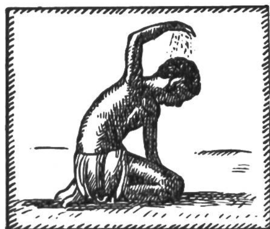
Hindus berühren Brust, Erde, Stirn. Der Kaffer streut Staub aufs Haupt.