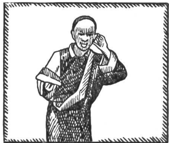
Ein Türke begrüsst seinen Gast. Tibetaner strecken die Zunge heraus.