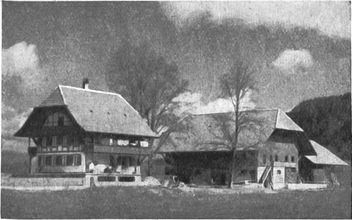
Neue Einzelhofsiedlung bei Gümmenen im Kanton Bern.