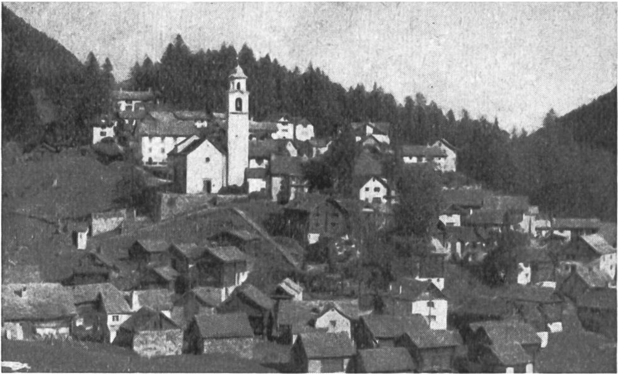
Soglio im Bergell. Haufendorf als Hangsiedlung. Man beachte die verschieden ausgerichteten Firsten im Vergleich zu Glüringen.

hof, Weiler und Dorf. Die Art und die Grösse der Siedlung hängt von den naturbedingten Verhältnissen, von der Verkehrslage und von der geschichtlichen Entwicklung einer Gegend ab. Es gibt in der Schweiz Gemeinwesen, die sich bis zu den ersten Niederlassungen der Pfahlbauer zurückverfolgen lassen. Der Standort vieler blühender Siedlungen wurde also schon von längst ausgestorbenen Völkern bestimmt.