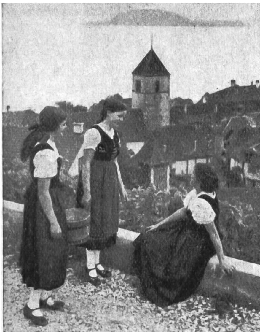
Weinlese ob Twann am Bielersee. Gassendorf des westschweiz. Weinbaugebietes.

Schweiz. Der in die heutige Westschweiz eingedrungene Germanenstamm der Burgunder war weniger zahlreich als die ungestümen Alemannen. Die Burgunder schonten die helvetischen Ansiedlungen und wurden als „hospes“ (Gäste – allerdings kaum sehr willkommene!) bei den Landesbewohnern einquartiert. Sprachlich und kulturell behielt jedoch die keltisch-römische Bevölkerung gegenüber dem fremden Eroberer die Oberhand. So wirken in diesem Landesteil die alten helvetischen Siedlungsformen bis auf den heutigen Tag nach. Typisch für viele romanische Siedlungen sind die engen Gassendörfer mit den in Reihen zusammengebauten Häusern. Die aus Stein erbauten Gassendörfer des welschen Weinbaugebietes drängen sich auf kleinem Raum zusammen, um möglichst wenig von dem höchst wertvollen Rebland zu be-