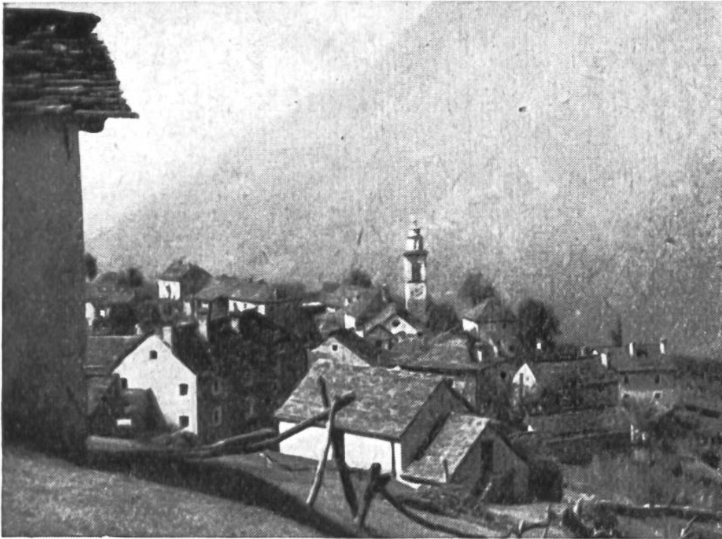
Rasa, Haufendorf im Tessin. Wie Kücken um die Gluckhenne scharen sich die Häuser um die Dorfkirche.

teilte man das Land rings um die geschlossenen Dörfer in drei Gewanne oder Zelgen ein. Bei diesem dreifeldrigen Wechsel folgten nacheinander: Wintergetreide, Sommergetreide, Brache. Das Brachjahr diente zur gründlichen Bearbeitung und Erholung des ausgenützten Bodens. Da jeder Dorfgenosse in einer bestimmten Zelge nur die vorgeschriebene Feldfrucht pflanzen durfte, musste er darnach trachten, in allen drei Zelgen ungefähr gleichviel Land zu besitzen. Von diesem Flurzwang, der in unserem Mittelland rund tausend Jahre lang die Arbeit des Bauern beherrschte, rührt der oft stark zersplitterte Grundbesitz in den Gewanndörfern des alemannischen Siedlungsgebietes her. Je grösser das Dorf, desto stärker ist in der Regel die Parzellierung des Bodens. In vielen Gegenden, so z. B. in der Ajoie und im Tessin, tragen auch die früheren Erbbräuche ihre Schuld an einer übermässigen Zerstückelung der Bauerngüter. Hier ging der Hof nicht an den jüngsten oder ältesten Sohn über, sondern zu gleichen Teilen an alle erbberechtigten Personen. So wurden die Grundstücke von Geschlecht zu Geschlecht kleiner.