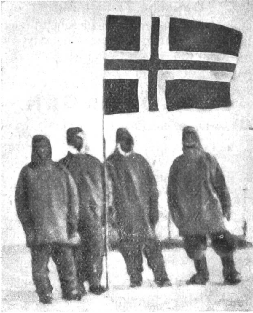
Die norwegische Flagge weht am Südpol.