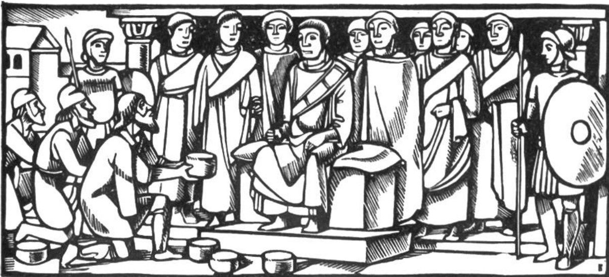
Konstantin der Grosse (306–337) nimmt die Gaben tributpflichtiger Völker entgegen.