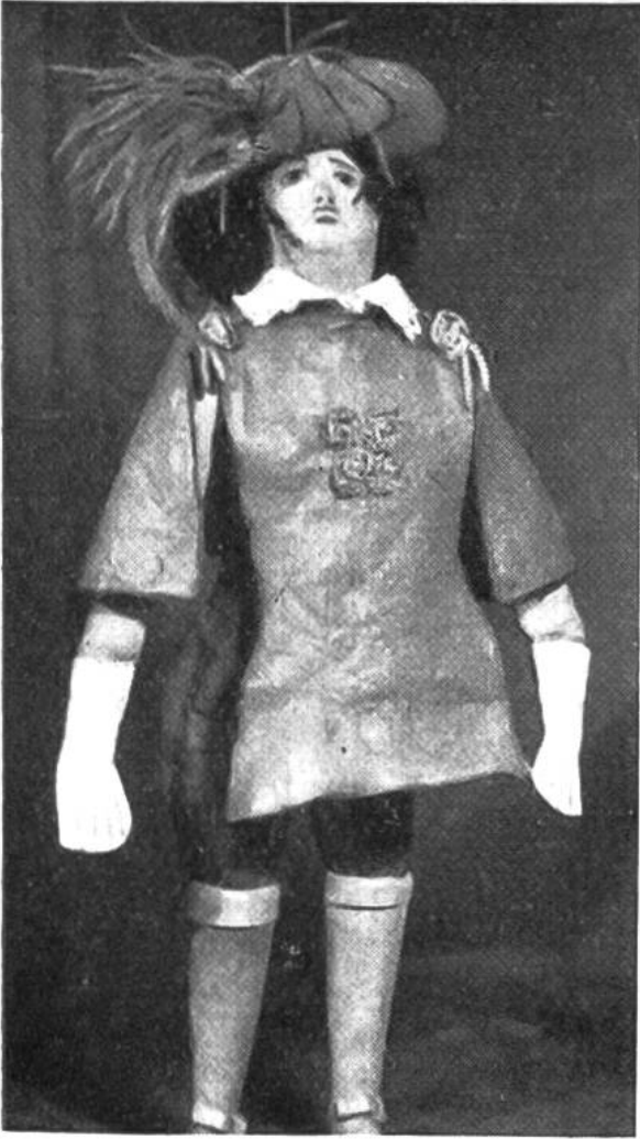
Das ist der Held des Stückes!

Ein besonderer Reiz liegt darin, die Puppen herzustellen. Sie werden aus Holz geschnitzt und dann bekleidet, haben bewegliche Glieder und meist einen ausgesprochenen Charakterkopf. Da der Gesichtsausdruck, im Gegensatz zum alltäglichen Leben, nie wechselt, wirkt die Darstellung allein durch die Bewegung der Glieder um so rührender und stärker.