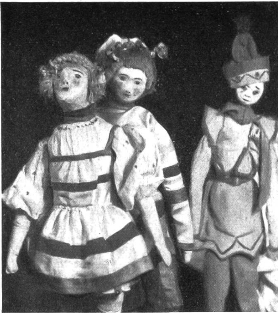
E i n A u s - s c h n i t t a u s d e m v o r a n s t e h e n d e n Z i r k u s b i l d a l s B e i s p i e l v o n G r u p p e n m i m i k .

hinab, rückt er sie über die ganze Breite der Bühne. Von oben schaut er auf die spielenden Puppen hinunter und muss sich ganz in das Wesen und den Charakter jeder seiner Figuren hineinleben, um ihr ein möglichst getreues Eigenleben und den vom Schriftsteller geforderten Typus einzuverleiben. Die charakteristischen Bewegungen werden auf ihre ursprüngliche und einfachste Form gebracht, und gerade diese nicht misszuverstehende Vermittlung eines Gedankens durch Bewegung ist das, was uns beim Marionettenspiel so sehr in Bann hält. Um dem Gedanken aber noch klareren Ausdruck zu geben, muss die Figur auch sprechen; dies zu tun, ist eine weitere Aufgabe der Marionettenspieler. Meist übernehmen die einen das Führen der Puppen, die anderen das Sprechen für dieselben. Immer wird sich die Stückwahl nach der Anzahl und der Geschicklichkeit der Aufführenden zu richten haben.