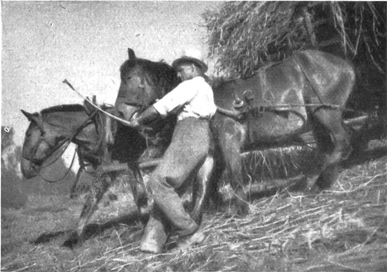
Spannung des Bildes: Zug der Rosse in der Diagonalen (mit Schwergewicht oben rechts) – kraftvolle Gegenwirkung durch das Entgegenstemmen des Mannes.

eben nichts selbstverständlich – wenn es auch nachher so aussieht. Abgesehen von den technischen Mitteln an sich, kommt es vor allem auf den Menschen an, der hinter dem Apparat steht. Fehlt diesem Menschen der Sinn für Wahrheit und Schönheit, fürs Ebenmass, fehlt ihm die künstlerische Schau und das Einfühlungsvermögen, so nützt auch der beste Apparat herzlich wenig.