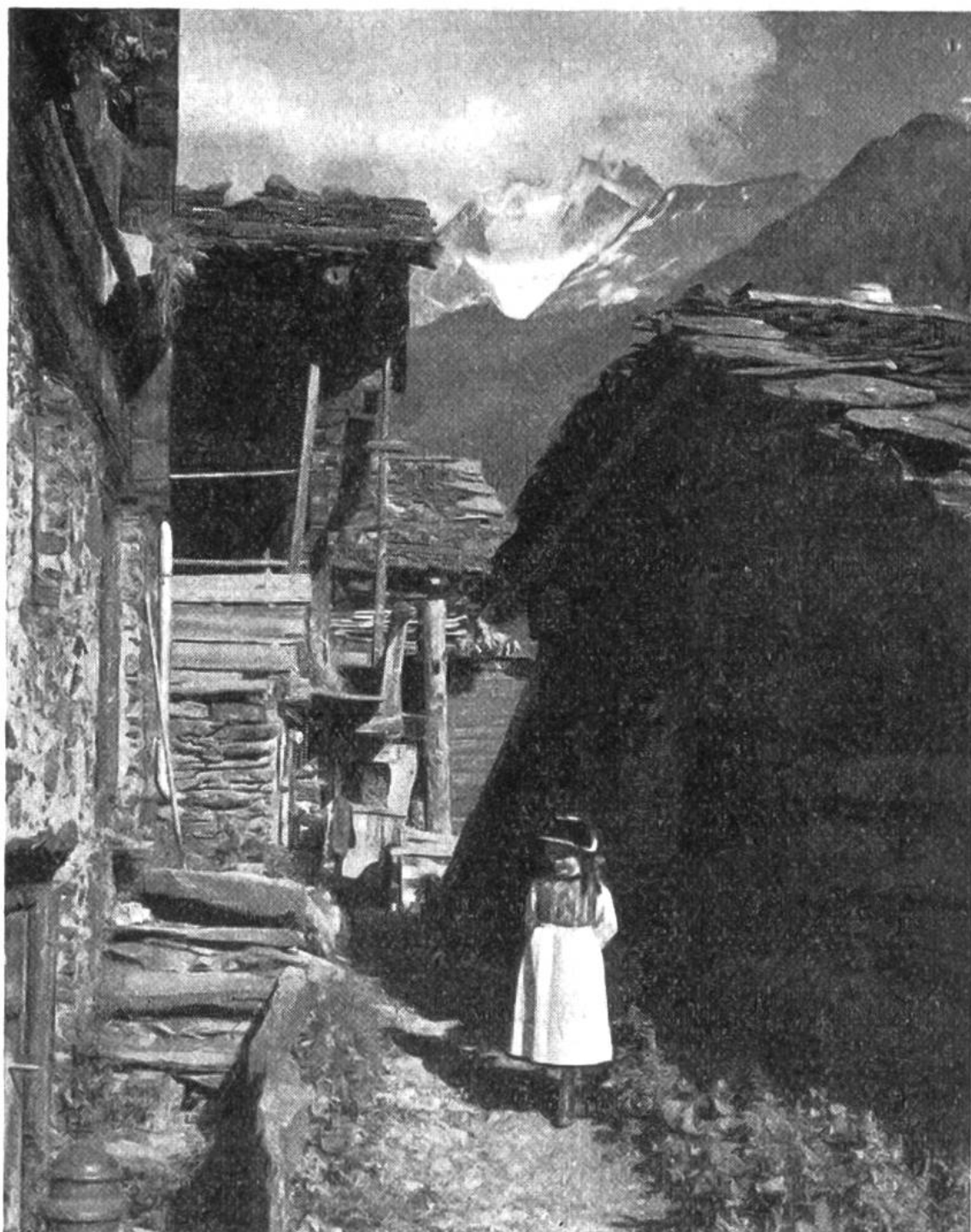
Häuser und Berge im Gleichgewicht (Bietschhorn zwischen den Hausgiebeln). Mädchen vor der dunkeln Hauswand, wo es hell hervortritt.

nügend Abstand ein, damit deine „Opfer“ auf dem Bilde weder den Kopf noch die Füße verlieren. Verlass dich nicht auf den äussersten Rand im kleinen Spiegelsucher, gib lieber etwas Spielraum. Unterlass Kopfstudien (Nahaufnahmen) mit einer Linse gewöhnlicher Brennweite, wegen der unfehlbar sich ergebenden perspektivischen Übertreibung (Nase zu