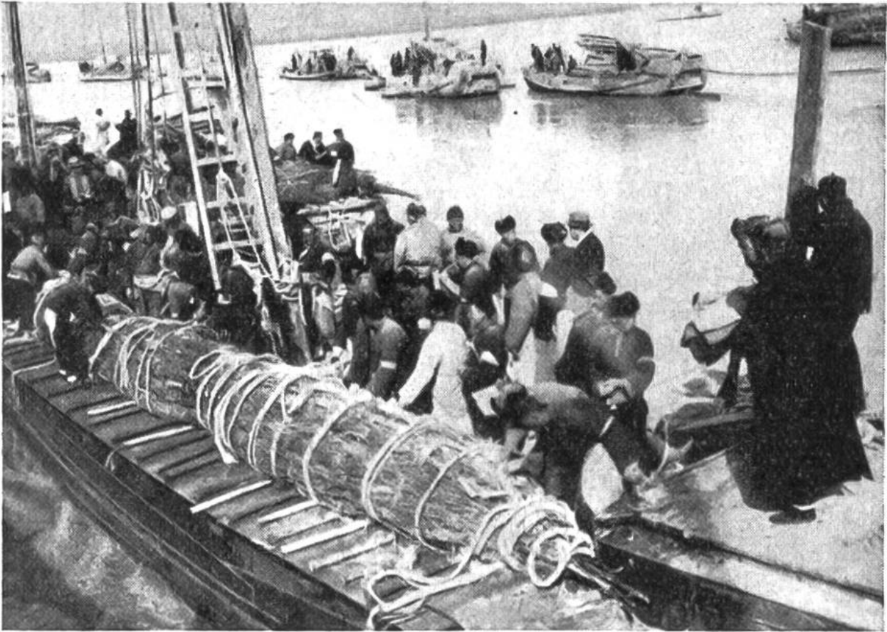
Staubündel aus Holz werden vorbereitet, um die Fluten des Hoangho einzudämmen.