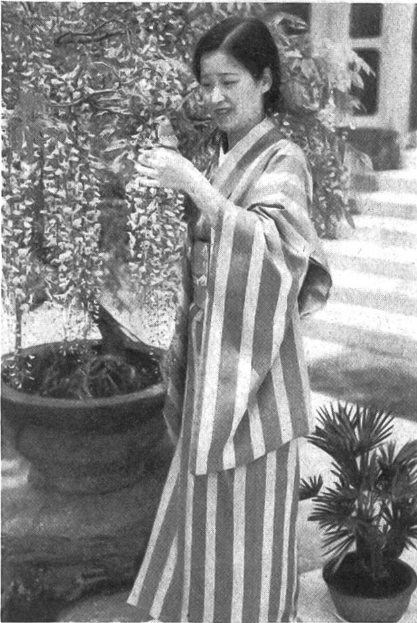
Die Haustochter mit einem Sperling aus Java unter einer blühenden Glyziniestaude.

Matte, die der Mattenflechter seit Menschengedenken nur im Format 90 \times 180 cm flicht. Es ist die Fläche, die ein liegender Mensch beansprucht. Die Massverhältnisse der Matte beherrschen das ganze Haus von der Breite und Höhe der Türen und Fenster bis zum Giebel. In Japan gibt ein begüterter Bauherr etwa ein Wohnhaus mit vier Sechsmattenzimmern in Bau. Das japanische Haus enthält fast keine Möbel, keinen Stuhl, kein Bett. Darin liegt sein besonderer Reiz. Gegenstände, die dem täglichen Leben dienen, sind in ebenfalls genormten Wandschränken untergebracht. Aber es ist nicht der Rede wert, was der Japaner braucht: Kissen zum Sitzen und Schlafen, Decken und Matratzen, einen niedrigen Speisetisch – das