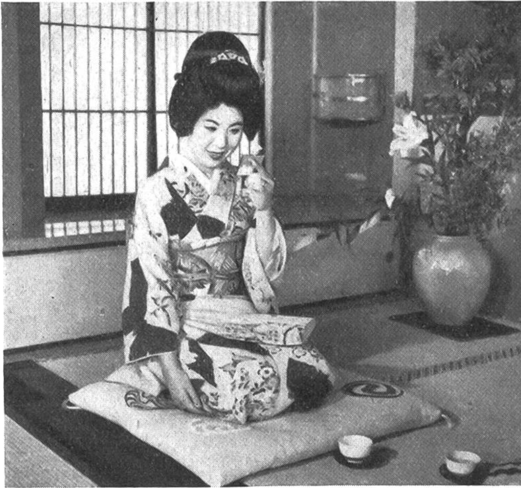
Eine Japanerin im blumengeschmückten Alkoven ihres Hauses.