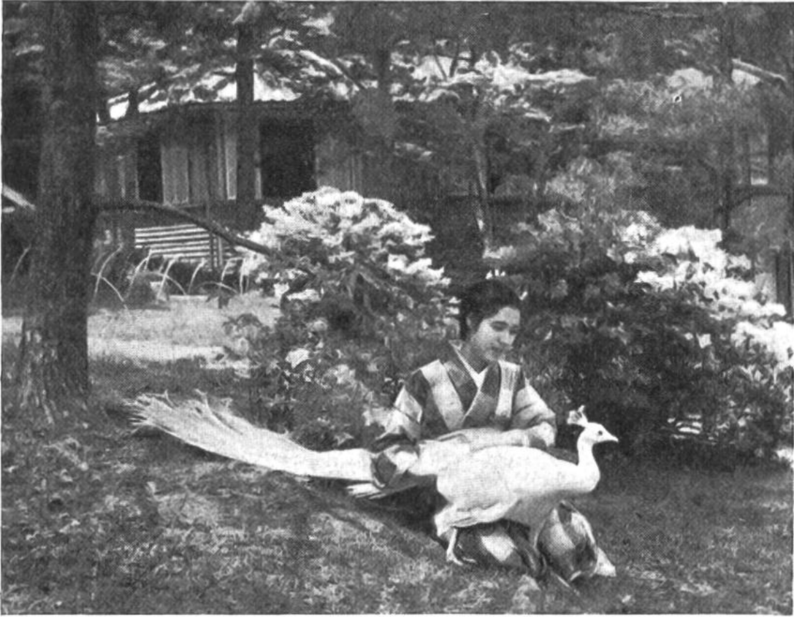
Die Tochter im Garten mit einem weissen Pfau. Im Hintergrund blühende Azaleen.

ist alles. Die feinen Bodenmatten und die Sitzkissen, auf denen jede Tätigkeit des häuslichen Lebens verrichtet wird, ersetzen das Mobiliar.