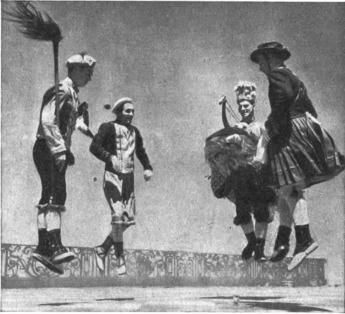
Der „Zamalzin“, ein Dämonentanz der Basken. Zu diesem Tanz gehören der Böse Geist, der Verhexte, der Reitersmann und die Marketenderin.