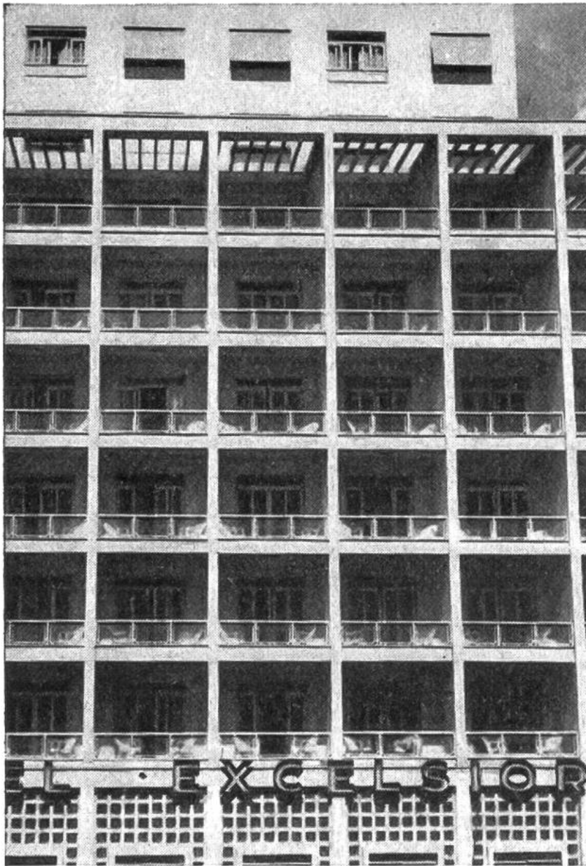
Ein Hotel neuester Baukonstruktion in Sao Paulo. Im gleichen Gebäude befindet sich ein Kino.

hochgewachsenen, modernsten Millionenstadt Sao Paulo; welcher Fleiss und Überfluss in den Handelsstädten Bahía, Santos, Porto Alegre, die meist an günstigen Hafengebieten der Küste liegen! — Und im Innern des überaus locker und dünn besiedelten Landes... welch schroffer Wechsel ins Tief der menschlichen Lebensverhältnisse! Die schon zur Zeit der Eroberung durch die Portugiesen zahlenmässig schwache indianische Urbevölkerung (heute etwa 1,6 Millionen) steht auf kulturell niedrigster Stufe. Sie lebt in den Rändern der Urwälder und kommt zum Jagen und Fischen in die tropischen Grassteppen, die Savannen, und an die Ufer der grossen Ströme heraus. Die vier Millionen Neger, deren Vorfahren