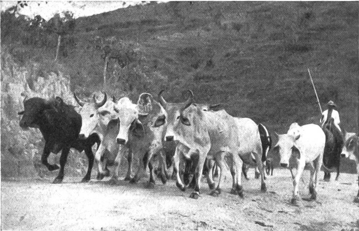
Im Innern Brasiliens. Ein Gaucho treibt seine Zebuherde auf die Weide.

Zuckerrohr oder Baumwolle und wieder andere von Bananen und Orangen. Diese gewaltigen Grundstücke (Areale) gehören jeweils einem einzigen Besitzer, meist einem Nachkommen der portugiesischen Eroberer, der mit einem Heer von Indianern, Negern oder Mischlingen die Felder bebaut und die Ernten einbringt.