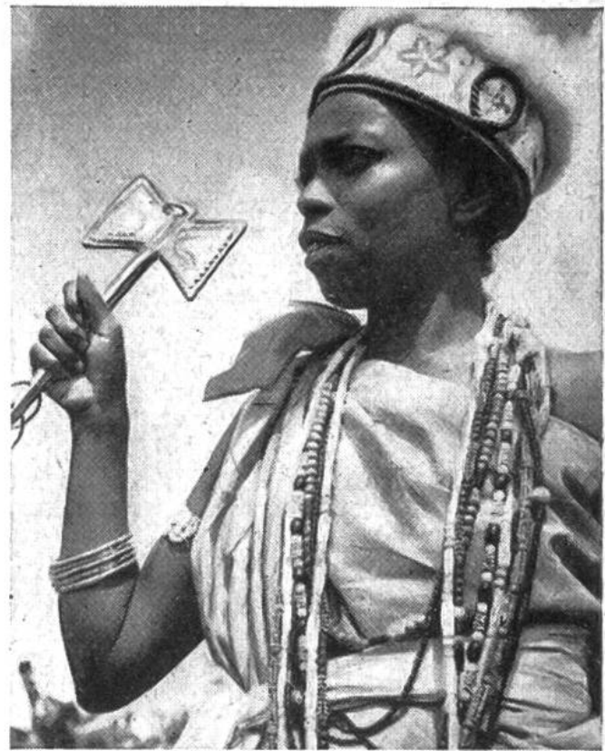
Die Tochter des Geistes – eine Art indianischer Priesterin im Feiergewande. Sie ist für ihr ganzes Leben der Gottheit geweiht, die in rauschartiger Besessenheit von ihr Besitz genommen hat und sich den Mitfeiernden im Fetischtanz offenbart. Dieser entwickelt sich aus einem traumhaften Zustand und führt bis zu der heftigsten Verzückerung.

(Sao Paulo) industrielle Betriebe und Fabriken entstanden, welche die Produkte des Landes verarbeiten. Die Textil- und Nahrungsmittelfabrikation wie auch die Lederverarbeitung bringen neue Reichtümer ins Land, die den grossen sozialen Unterschied der Klassen, die Kluft zwischen Reichen und Armen, noch vertiefen.