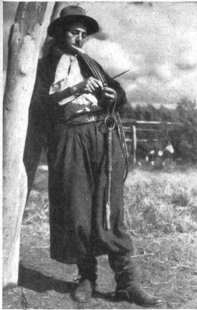
Ein Gaucho dreht sich eine Zigarette. Erschneidet den Tabak in feinen Scheiben von einem Tabakstrick; denn in der Form von langen, gedrehten Stricken wird hierzulande der Tabak verkauft.