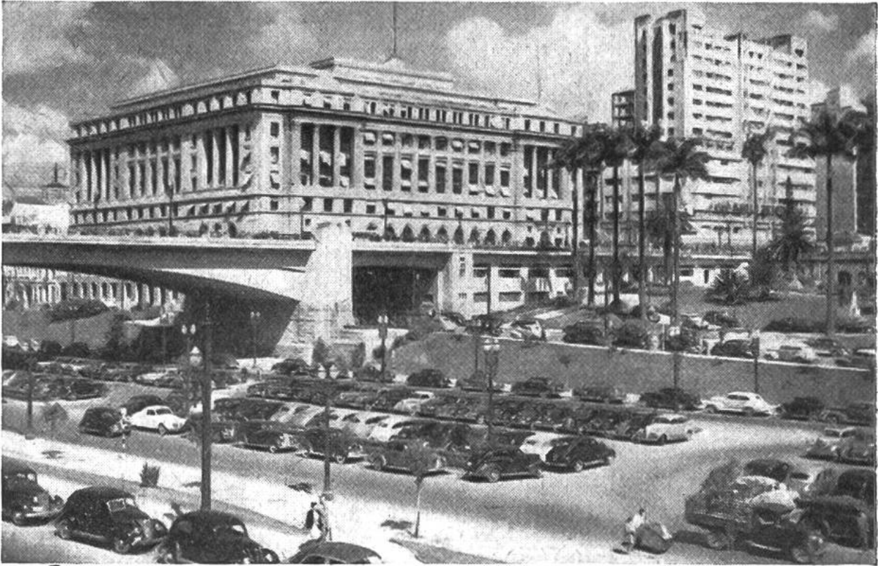
Sao Paulo, die modernste Stadt in Südamerika. Viadukt über einen Autoparkplatz, dahinter ein grosses Warenhaus.