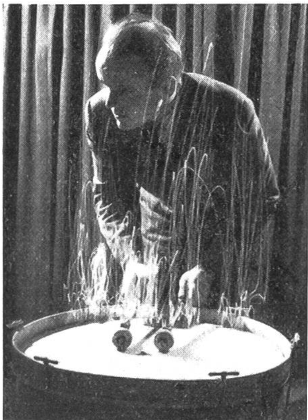
Der Paukenwirbel in der Haydn'schen Symphonie.