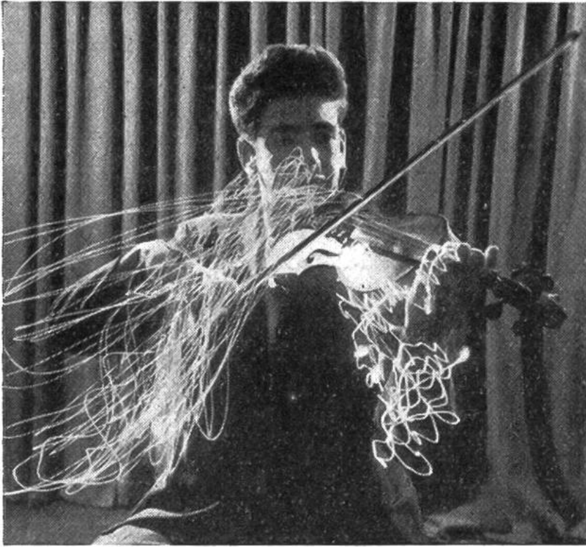
Der Geiger führt den Bogen in fließenden Kurven. Die Finger der linken Hand greifen in die Saiten.

mus, Tonstärke und Modulierung an und formt aus den vielen geigenden, blasenden, trommelnden, flötenden Musikern eine harmonische Gemeinschaft, die wie ein einziges atmen- des Wesen sich dem Leben der Musik hingibt. Den Händen des Dirigenten wohnt gleichsam eine Zauberkraft inne, die imstande ist, die stummen Noten der Partitur zu klingendem Leben zu erwecken. Seine Hände geben auf Befehl seines Geistes der Freude, der Trauer, dem Jauchzen und der Klage – allen Gefühlen, Gedanken, Empfindungen und Stimmungen – Ausdruck und Laut, die der Komponist in das Musikstück hineingelegt hat.