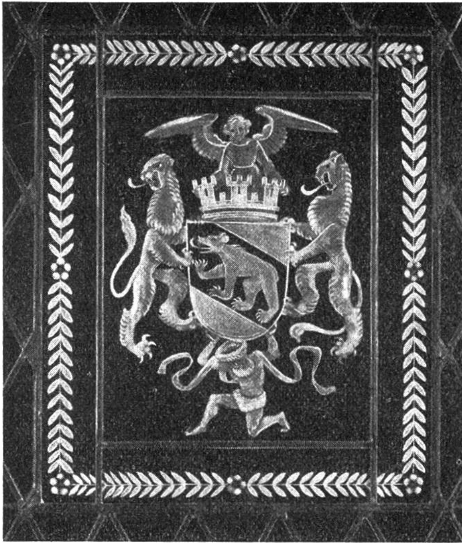
Mittelstück der Wappenscheibe, welche die Stadt Bern 1951 Zürich schenkte. (Gezeichnet von Paul Boesch, Bern, geschliffen von Jakob Werner, Frauentkappelen.)

der Schweiz und im Auslande herrschte: Wenn jemand ein Haus baute, schenken ihm seine Freunde geschnitzte Türbalken und Lädenstützen oder auch Fenster mit eingelassenen Bildscheiben. Vom 15. bis ins 17. Jahrhundert wurden meist Scheiben geschenkt, die aus farbigem Glase zusammengesetzt waren. Danach kamen die farblosen Scheiben mit eingeschliffenem Bild auf. Doch war es nicht nur bei Neubauten, sondern auch bei Hochzeiten, Taufen, sowie beim Antritt und Verlassen eines Amtes und noch bei andern Gelegenheiten üblich, geschliffene Scheiben, Gläser oder Flaschen zu schenken. Auf den Scheiben wurden unter dem Bilde meist die Namen der Schenkenden (nicht der Beschenkten) eingraviert. So konnte ein Bauherr manchmal in den Fenstern seiner neuen Wohnung die Namen aller seiner Freunde lesen, die ihm auf diese Weise täglich gegenwärtig waren. Heute lebt der schöne Brauch, geschliffene Gläser, Flaschen und Scheiben zu schen-