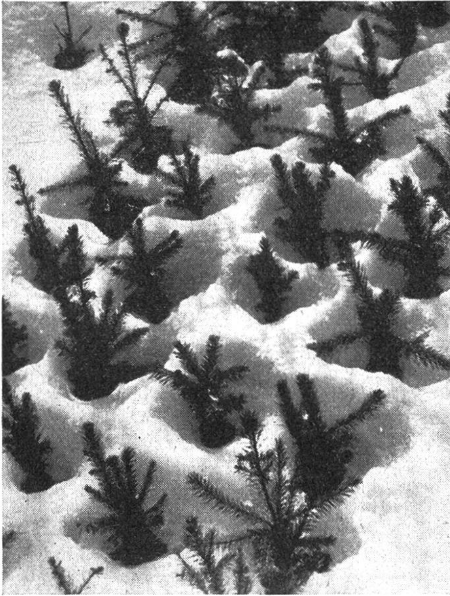
Eine eingeschneite Baumschule.

von kleinsten Kristallen aus Eis übersät er den Halm, er heftet sie an Stamm und Ast und läßt uns die schönen Formen der Natur in ausgeprägterer Form erkennen. Ein Glitzern und Flimmern über allen Wipfeln, eine gläserne, zerbrechliche Schönheit, in der sich die Strahlen der Wintersonne funkelnd brechen. Ganz besondere Blumen – Eisblumen – malt der Winter an die Scheiben, und kleine Rosen aus Kristall setzt er auf die dunkeln, zugefrorenen Seen.