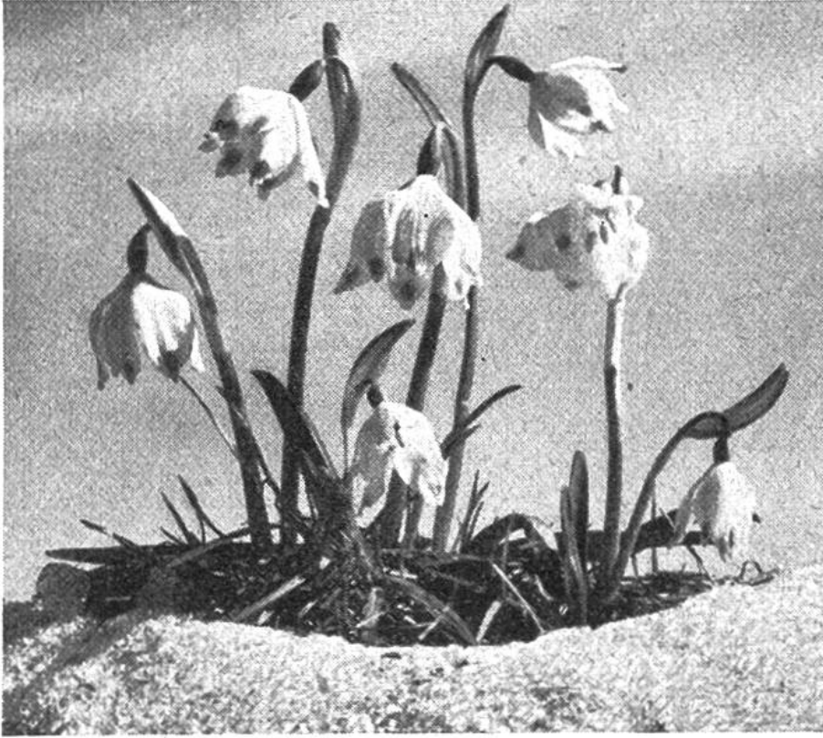
Die ersten Frühlingsboten brechen aus dem Schnee hervor.

und Schneemassen den Weg ins Licht. Die verzauberte Nacht des Winters weicht dem farbenfrohen Morgen des Frühlings: