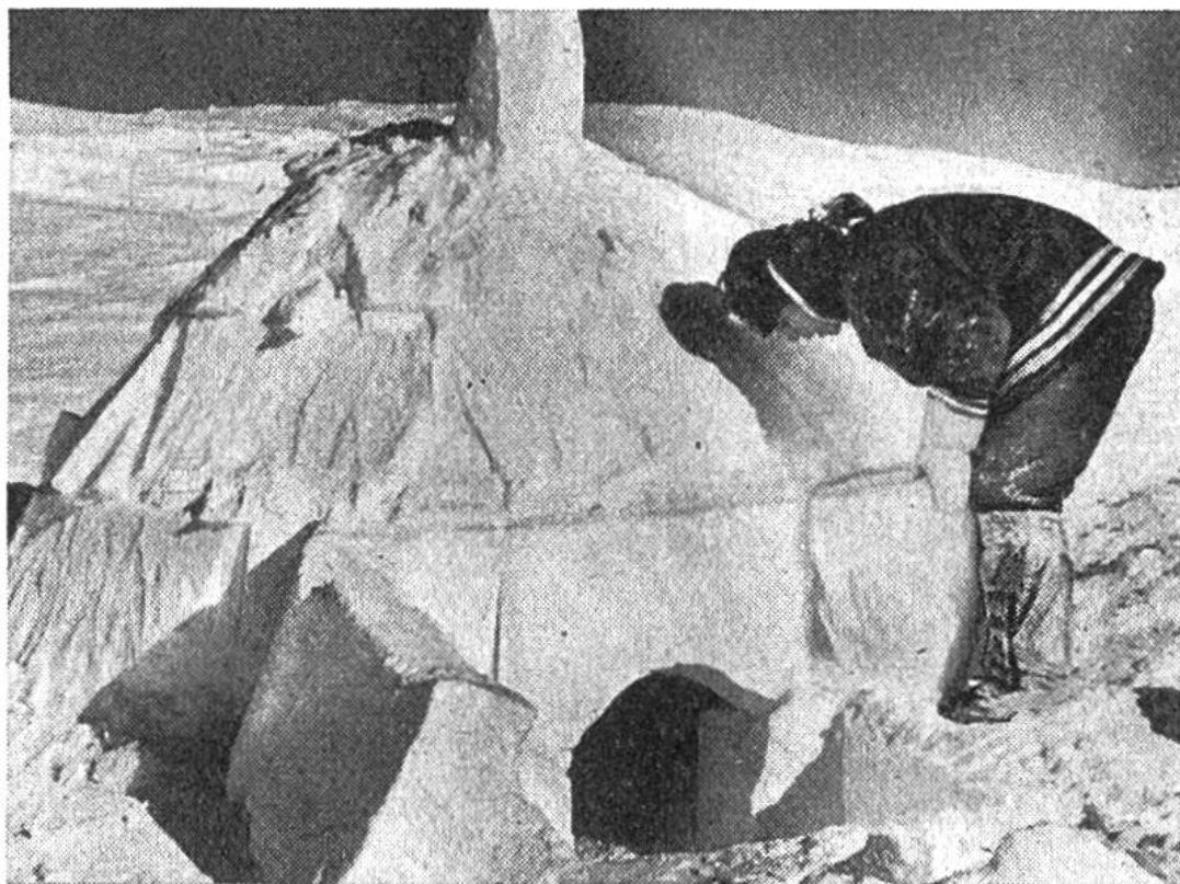
Das aus Schneeböcken errichtete Iglu stellt die Winterwohnung der kanadischen Eskimos dar.

rakteristische Lebensweise an der Meeresküste als Jäger der grossen Seesäugetiere Seehund, Walross und Wal nicht oder nur in sehr geringem Masse kennen: bis vor nicht allzu langer Zeit lebten sie ausschliesslich als Rentierjäger im Inland; erst spät stiessen Teile der Bevölkerung zur Küste vor.