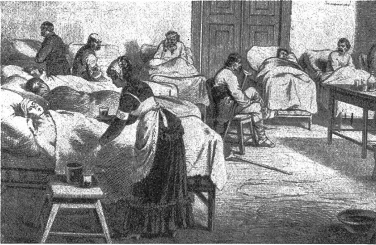
Englisches Kriegsspital in Belgrad 1877. Freiwillige des Roten Kreuzes, Frauen und Männer, pflegen und laben Kriegsverwundete.

Wie und wo entstand der Rotkreuzgedanke?