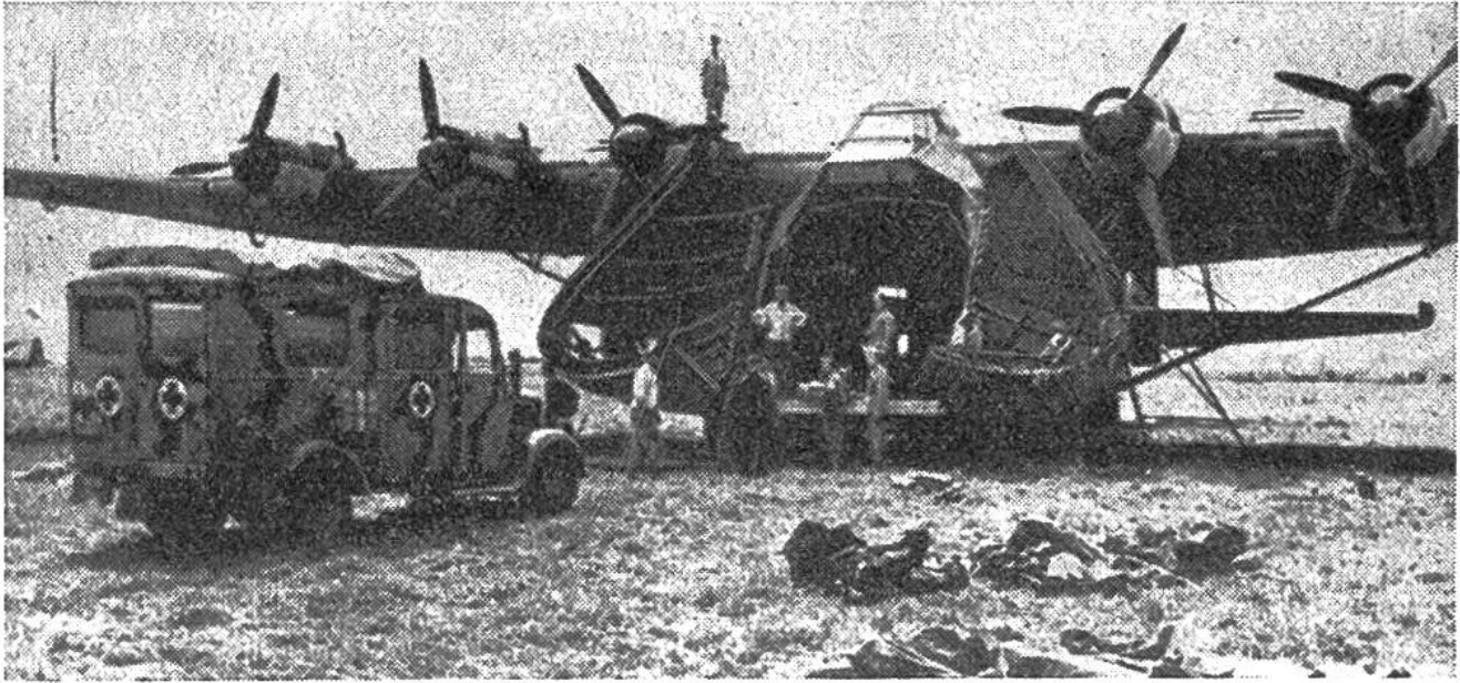
Moderner Transport von Kriegsverwundeten mit Ambulanzen und Grossraumflugzeug.

besserung des Loses der Verwundeten und Kranken der Heere im Felde, zur Verbesserung des Loses der Verwundeten, Kranken und Schiffbrüchigen der bewaffneten Kräfte zur See, über die Behandlung der Kriegsgefangenen und über den Schutz der Zivilpersonen in Kriegszeiten – den Erfahrungen im Koreakrieg und den mutmasslichen Kriegsmitteln eines künftigen Krieges entsprechend schon wieder erweitert werden. Denn die Zerstörungen gehen immer dem Heilen voraus. So wird das Rote Kreuz sein Ziel wohl erst dann erreicht haben, wenn es auf der Erde keine Kriege mehr gibt.