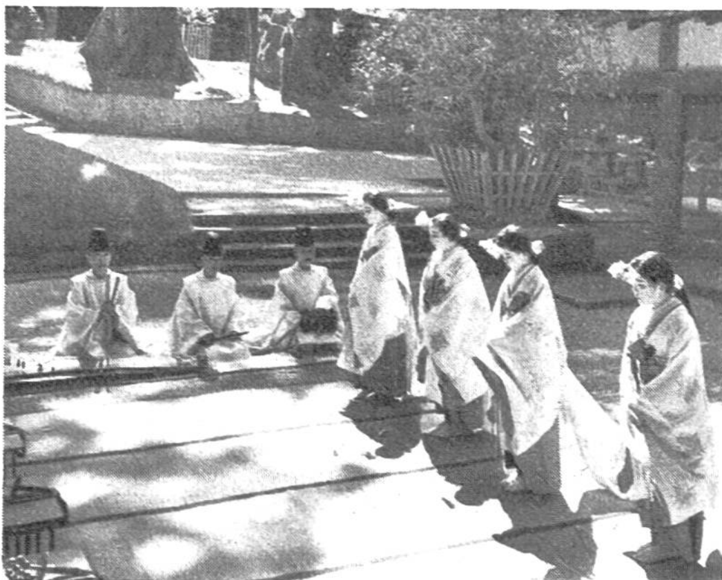
Am Shinto-Fest tanzen Tempelmädchen zur Musik der Priester im Tempelgarten.

Feste vor den heiligen Torbögen und Tempeln, die als „Schreine“ der Gottheiten betrachtet werden, sind reich an Besuch, Farbe und Klang.