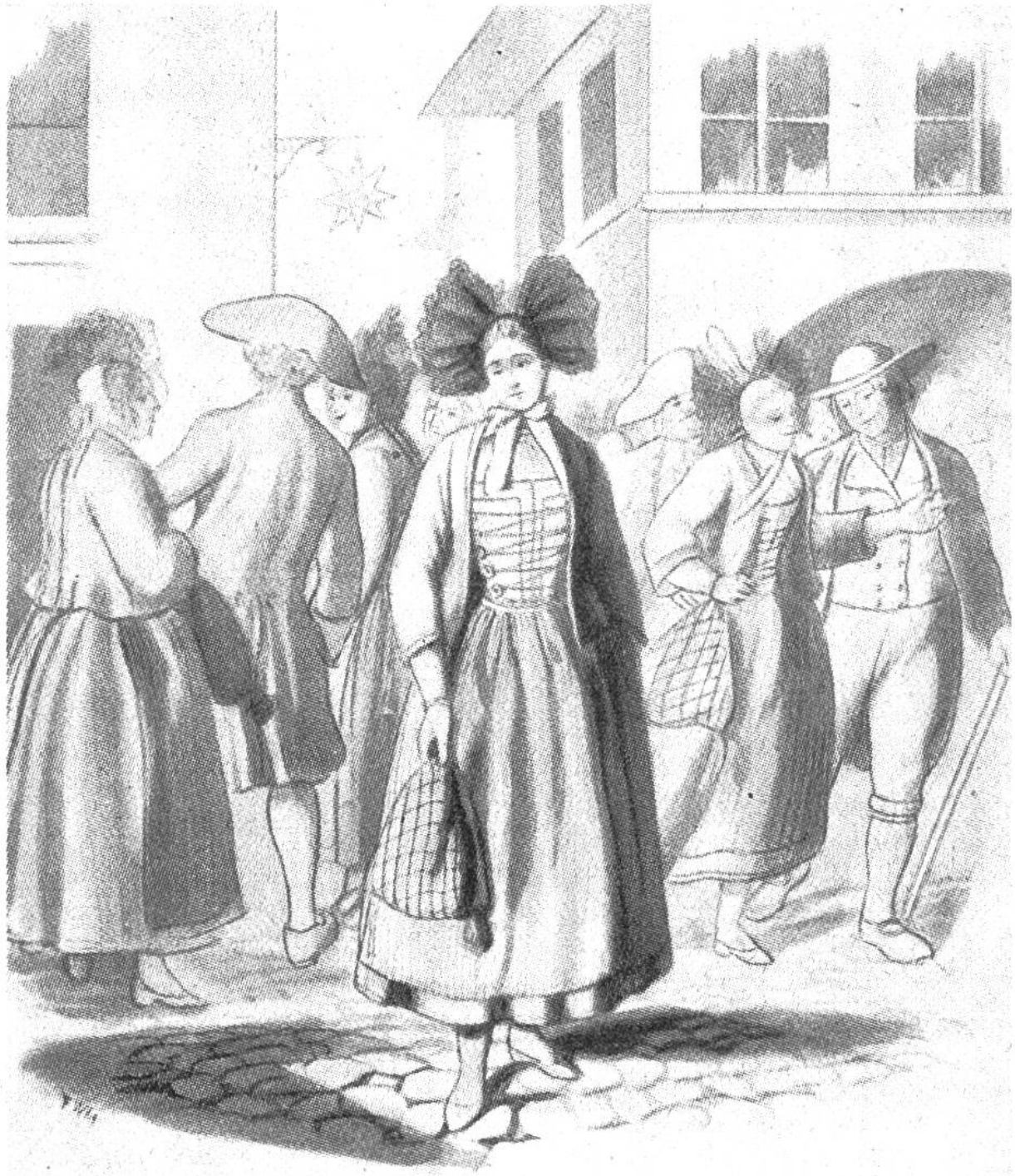
Am Markttage. Illustration von Friedrich Walthard zu „Elsi, die seltsame Magd“.