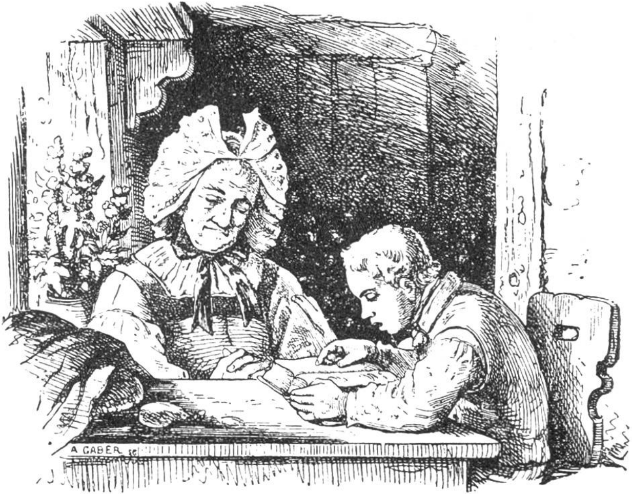
Illustration von Ludwig Richter (Dresden, 1803–1884) zu „Der Besenbinder von Rychiswyl“.

Bekannte Werke Gotthelfs sind: „Leiden und Freuden eines Schulmeisters“, „Uli, der Knecht“, „Anne Bäbi Jowäger“, „Die Käserei in der Vehfreude“. Kürzere Erzählungen: „Elsi, die seltsame Magd“, „Hans Joggeli, der Erbvetter“, „Das Erdbeeri Mareili“, „Der Besenbinder von Rychiswyl“. Gotthelfs einzigartige, zeitlos gültige Darstellungen fanden schon zu seinen Lebzeiten auch in Deutschland grosse Verbreitung und erschienen in illustrierten Ausgaben. Neben anderen schuf vor allem Ludwig Richter, der unerreichte Schilderer des Volksgemüts, fein empfundene Zeichnungen. Nach 1850 erstand Gotthelf in dem Berner Friedrich Walthard endlich auch ein vorzüglicher einheimischer Illustrator, dem später weitere folgten, wie Anker, Paul Robert und besonders Rudolf Münger.