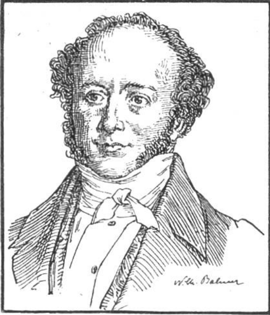
JEREMIAS GOTTHELF (100. Todestag am 22. Oktober)

* 4. Oktober 1797 in Murten, † 22. Oktober 1854 in Lützelflüh.