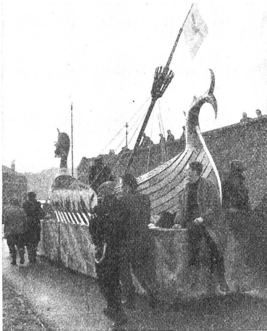
Das selbstgebaute Wikingerschiff wird an den Strand gebracht.