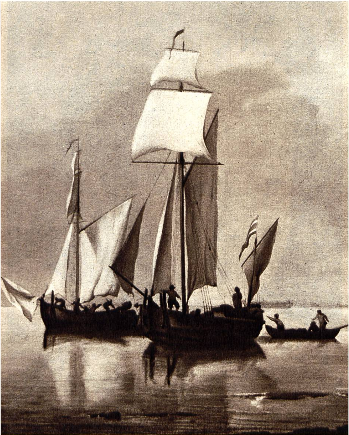
Schiffe im Hafen, von Willem van de Velde d. Jg., Amsterdam, 1633 - 1707. (Galerie Thyssen, Lugano.)