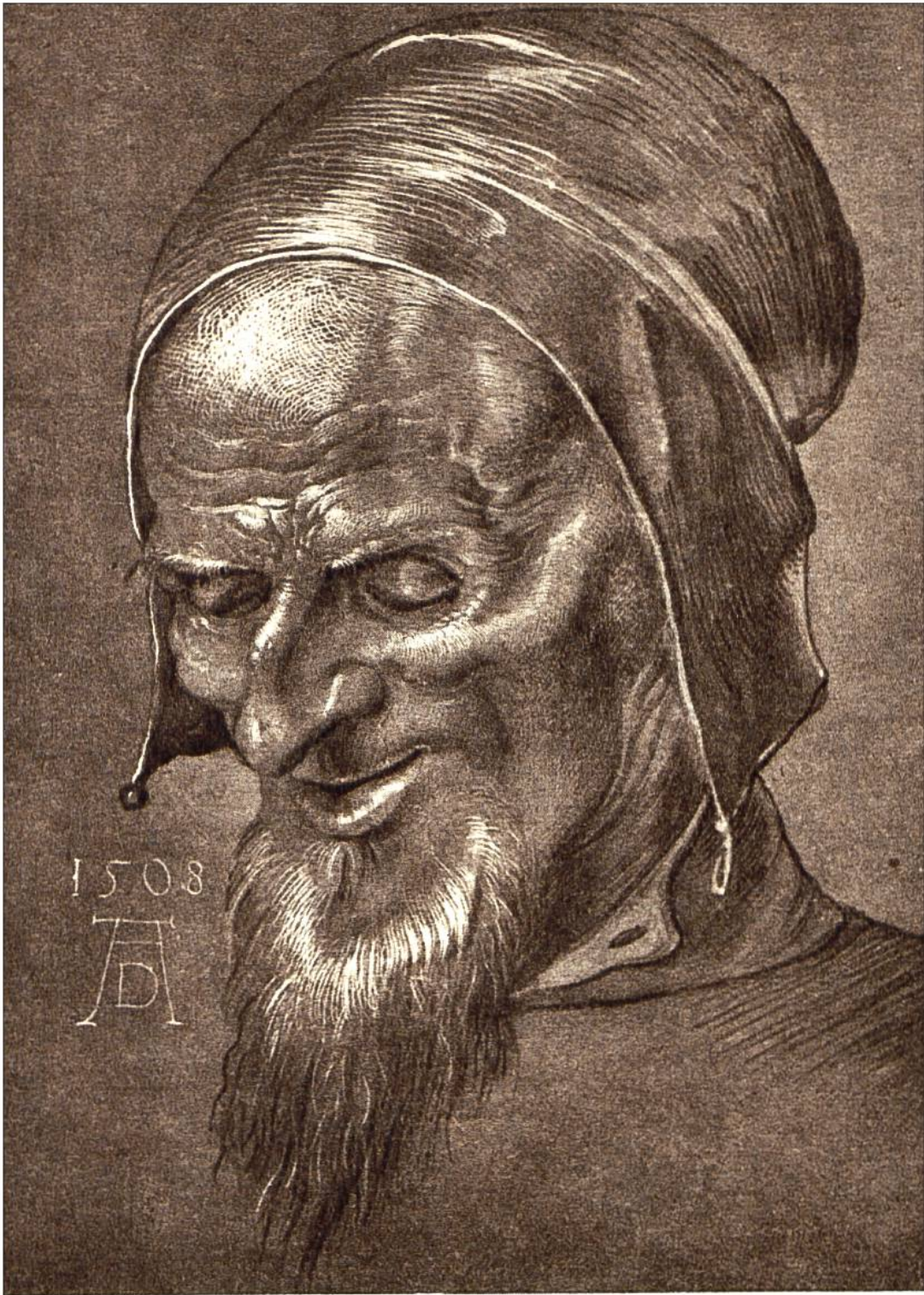
Alter Mann, Zeichnung von Albrecht Dürer, Nürnberg, 1471-1528.