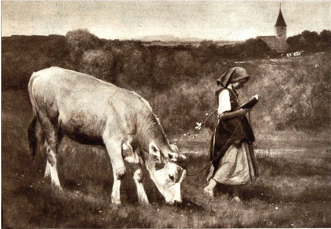
Heimkehr vom Felde, von Johann Rudolf Koller, Zürich, 1828-1905.