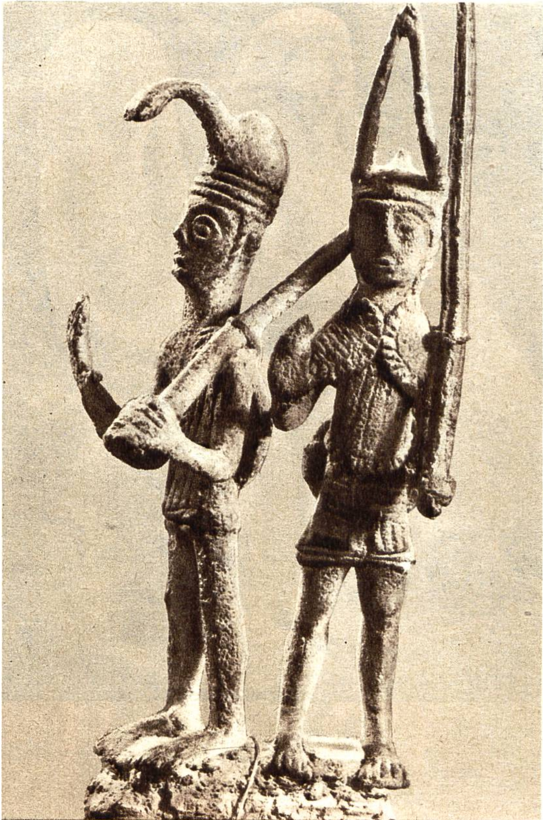
Kriegergruppe, 14,5 cm hoher Bronzeguß aus der Zeit von 800-500 v. Chr., gefunden in Teti (Nuoro), Sardinien.