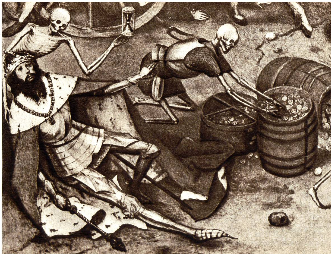
Der Triumph des Todes (Teilstück), von Pieter Brueghel der Aeltere (genannt Bauernbreughel), Brüssel, 1525 - 1569.