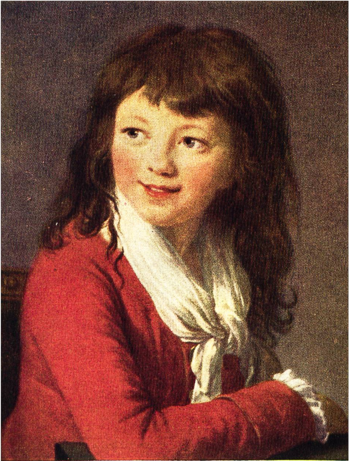
KNABENBILDNIS, von Elisabeth Louise Vigée-Lebrun, Paris, 1755–1842.