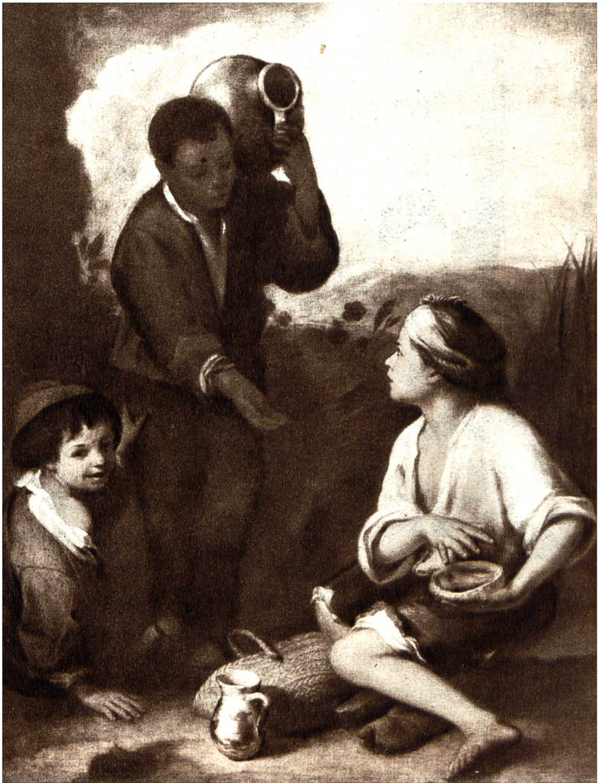
Spanische Bauernkinder, von B. E. Murillo, Sevilla, 1617-1682.