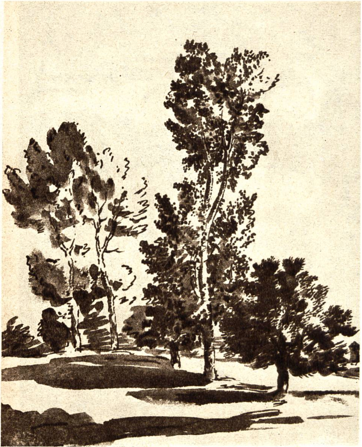
Baumstudie, von Nicolas Poussin, Paris und Rom, 1593-1665.