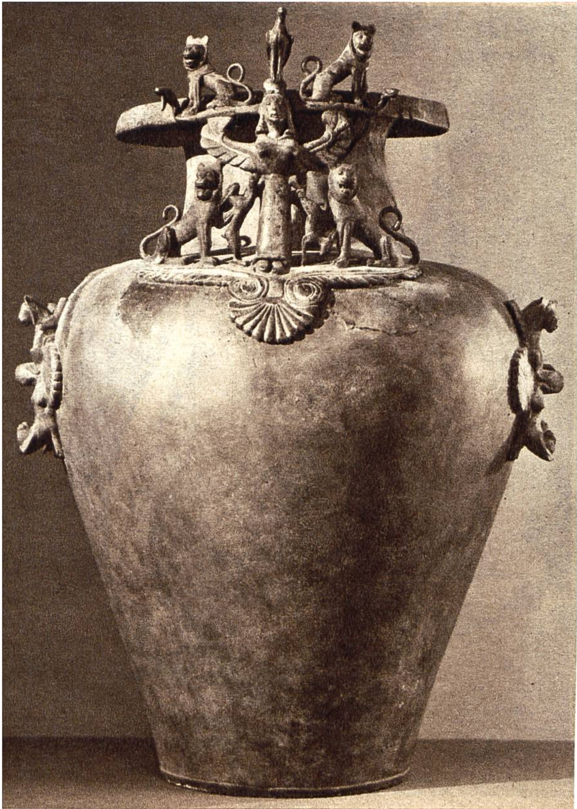
Griechisches Bronzegefäß, gefunden in einem Fürstengrab der älteren Eisenzeit (um 600 v. Chr.) in Grächwil (Schweiz).