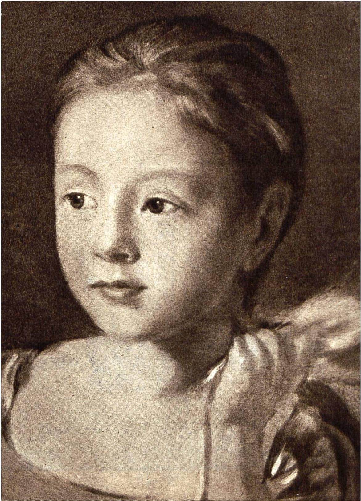
Mädchenbildnis (Tochter des Malers), von Thomas Gainsborough, London, 1727 - 1788.