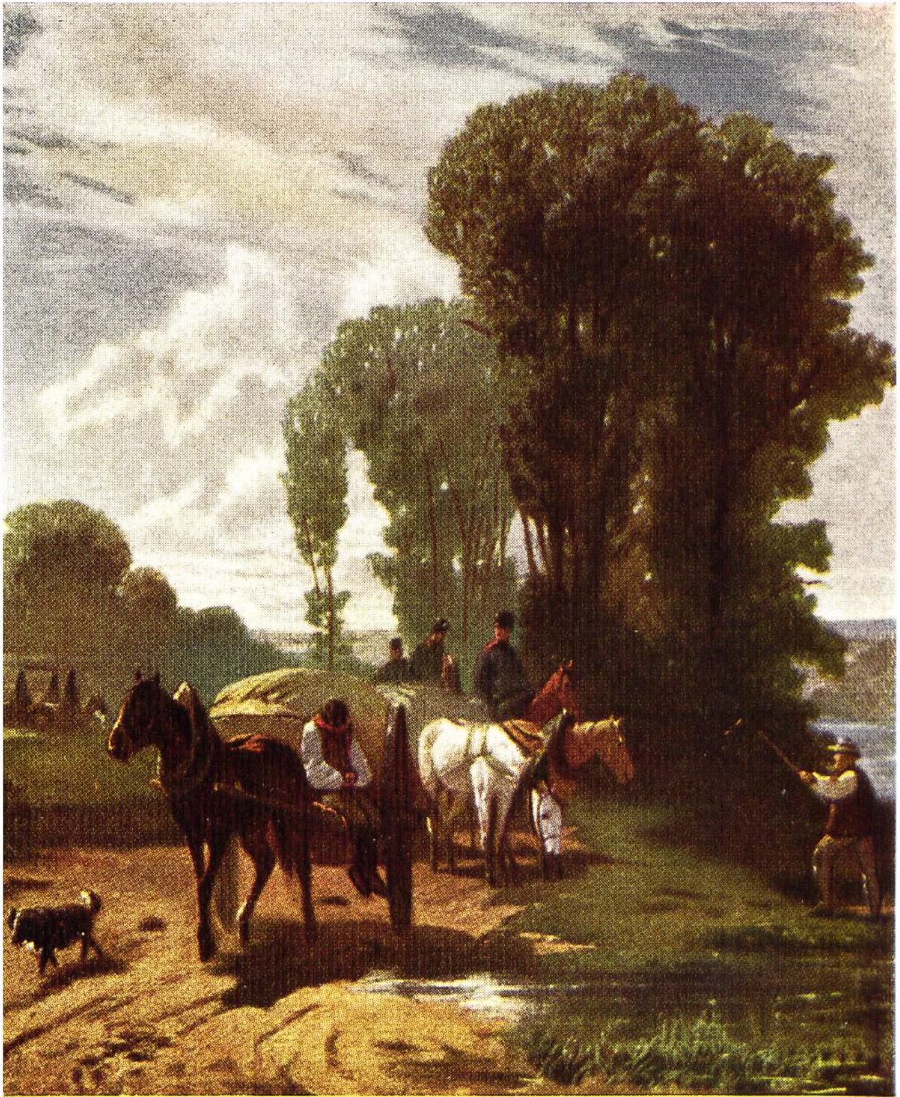
HALT AN DER TRÄNKE, von Hans von Marées, München, 1837-1887.