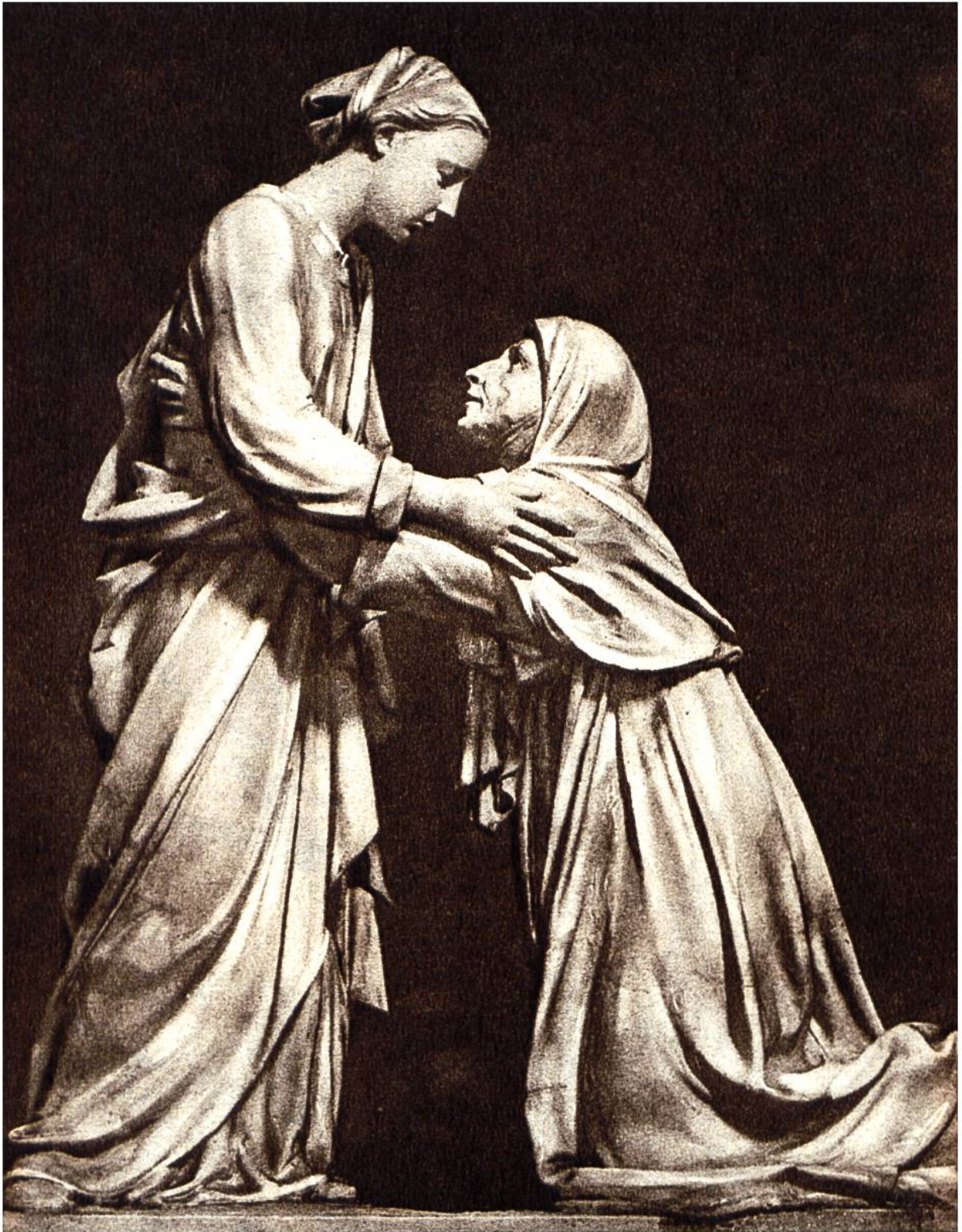
Begegnung der Elisabeth und Maria, Gruppe aus glasiertem Ton von Luca della Robbia, Florenz, 1399-1482.