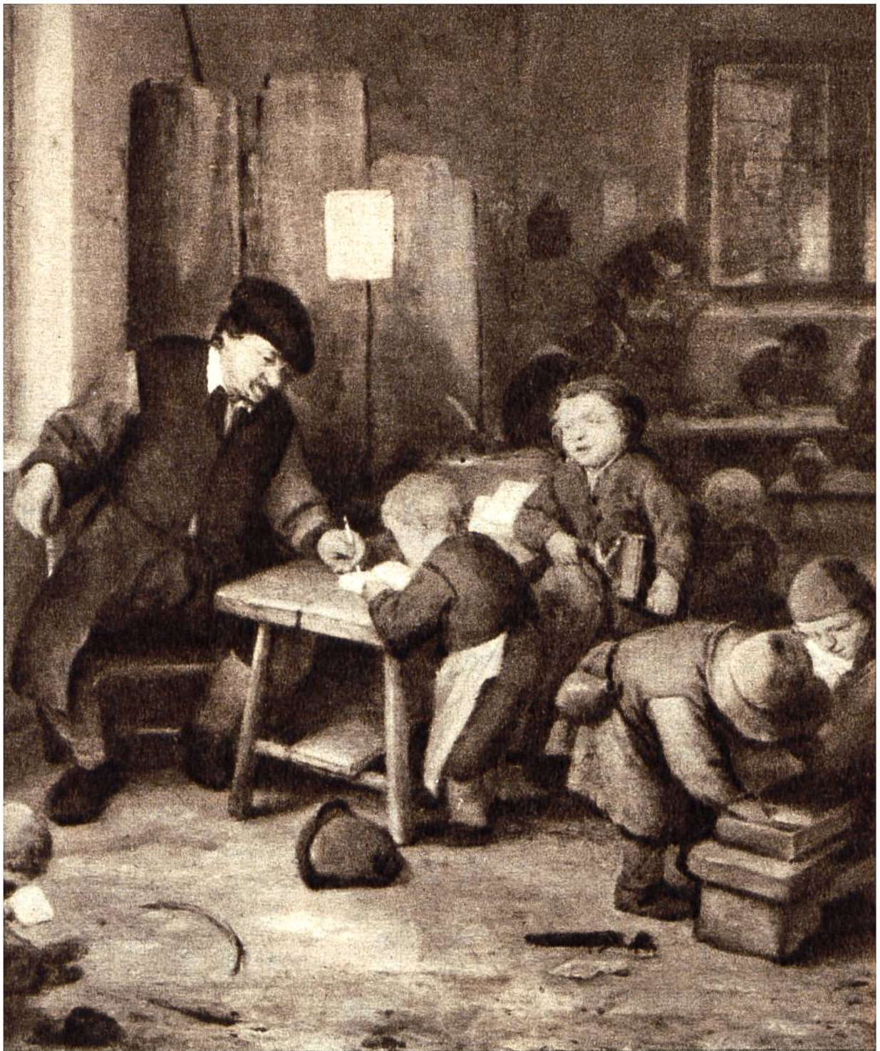
In der Landschule, von Adriaen von Ostade, Haarlem, 1610 - 1685.