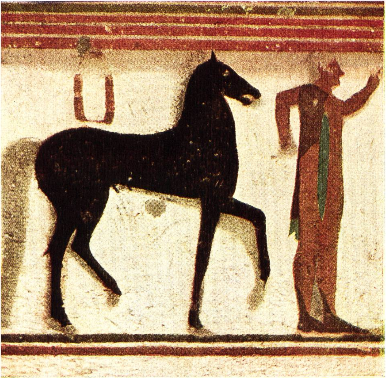
TARQUINIER, EIN PFERD FÜHREND. Wandmalerei in einem etruskischen Grab aus dem 6. Jahrhundert v. Chr.