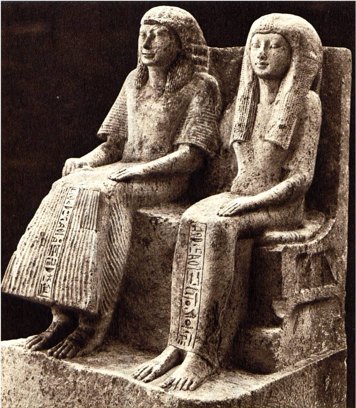
Aegyptisches Ehepaar, 1 m hohes Sandstein-Bildwerk aus dem 13. Jahrhundert v. Chr.