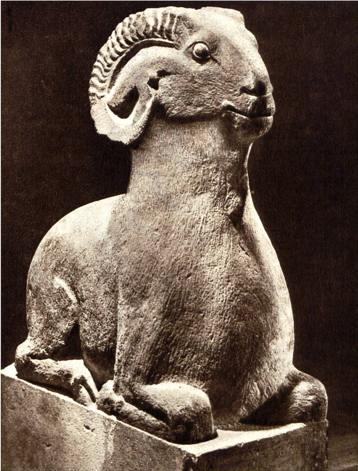
Widder, chinesische Sandsteinfigur aus dem 7.-9. Jahrhundert. (Leihgabe von der Heydt im Rietberg Museum, Zürich.)