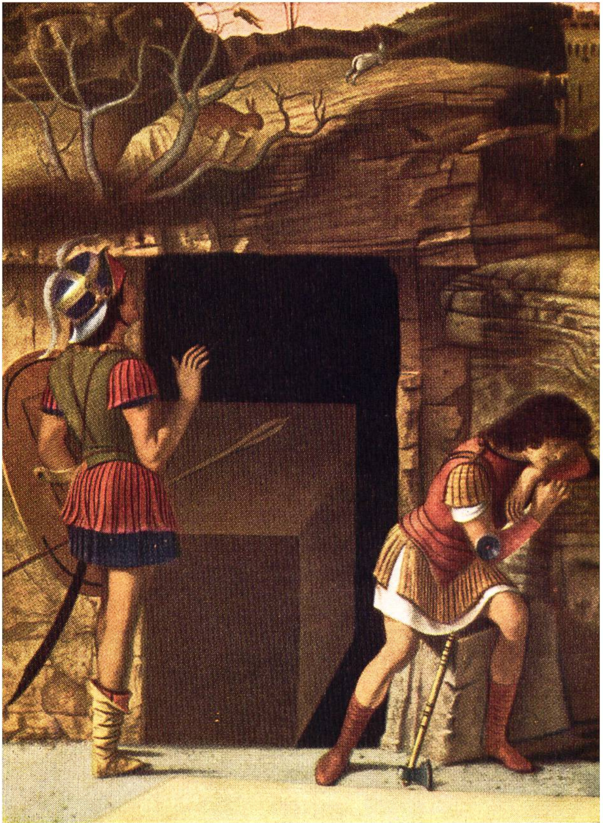
DIE WÄCHTER, Teilstück aus dem Gemälde « Auferstehung Christi » von Giovanni Bellini, Venedig, um 1430–1516.