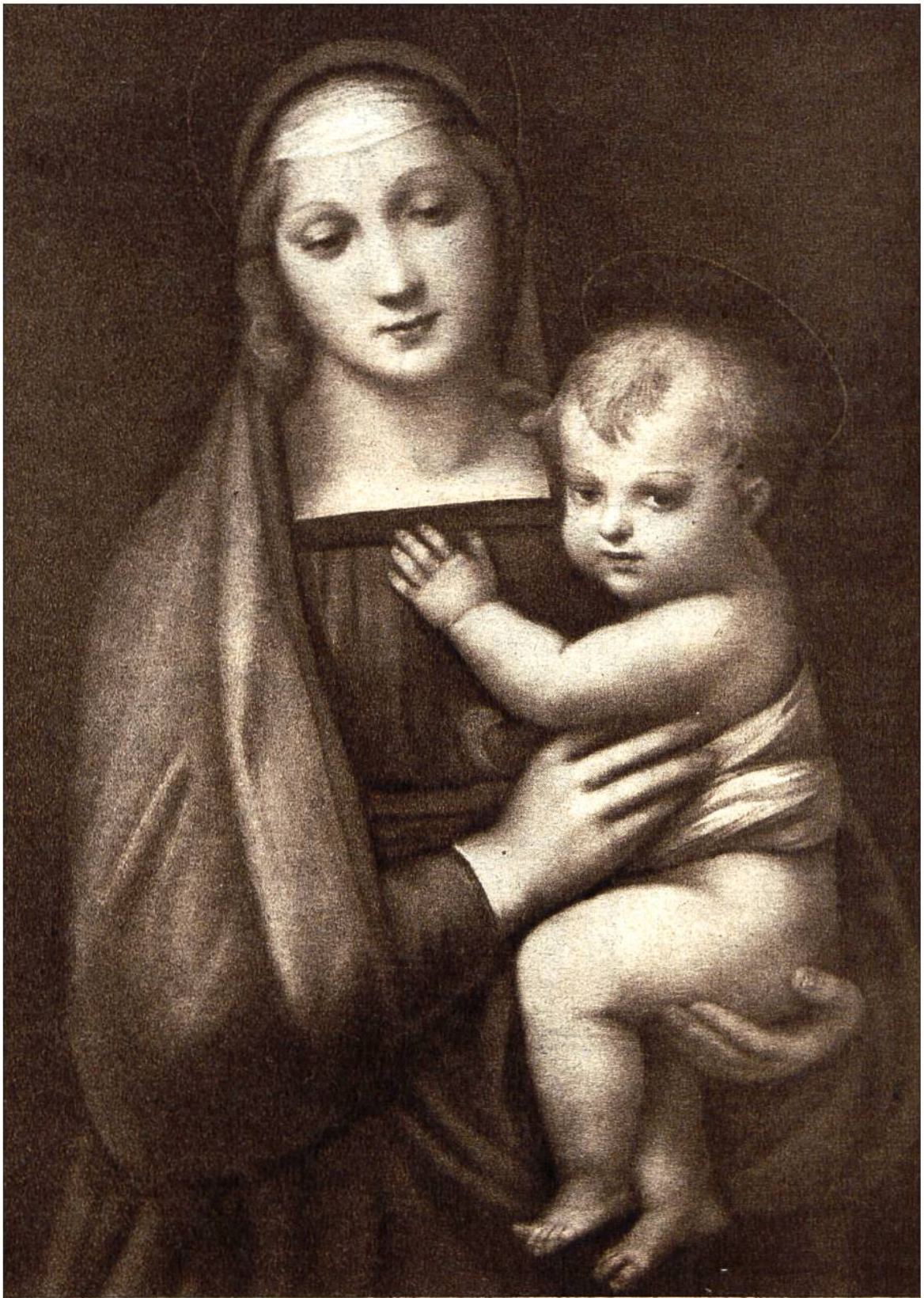
Madonna del Granduca, von Raffael, Rom, 1483-1520.