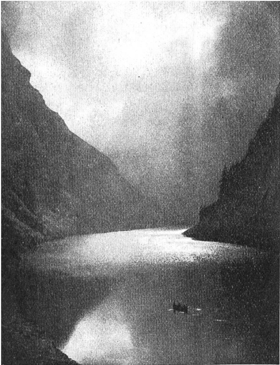
Abendstimmung am Fählensee im Alpsteingebiet (Säntis).