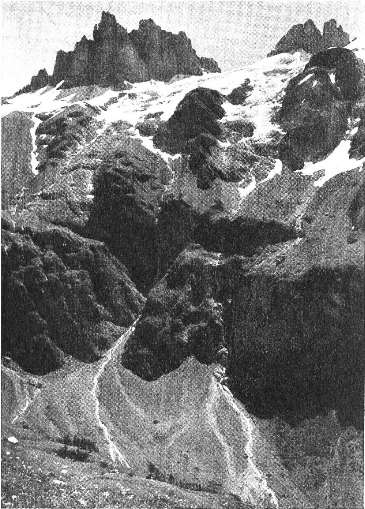
Sommormorgen in den Bergen. Spannörter in den Urner Alpen (Links Gross-Spannort 3202 m).