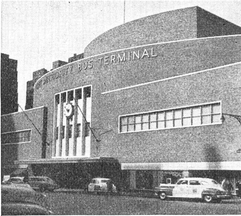
Die Fassade des modernen Auto-bus-Bahnhofs in Manhattan. Der Beschauer kann sich kaum vorstellen, welch

riesiger Verkehr sich tagtäglich innerhalb dieser Mauern abwickelt.