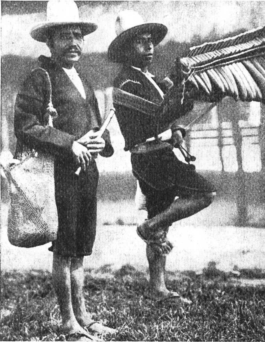
Zwei Musikanten aus Guatemala

in Mittelamerika. Ihre Instrumente sind denkbar primitiv, die kleine Maramba und die einfache Holzpfeife – aber sie tönen und klingen.