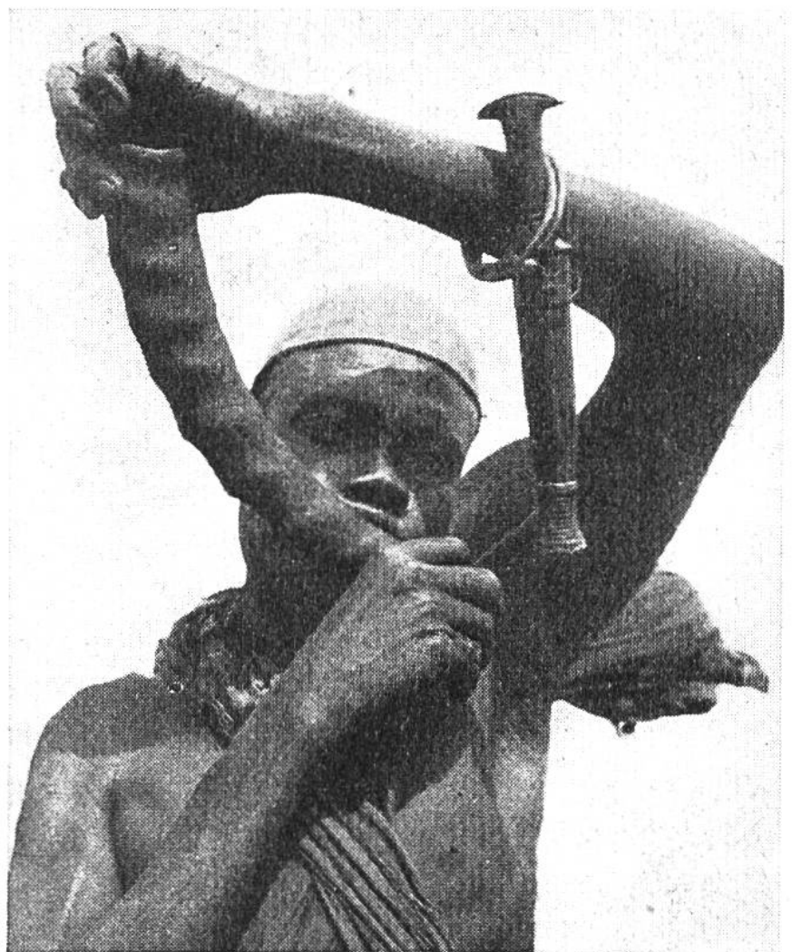
Von den Negern Kameruns wird die Kirdi-Trompete geblasen, wobei mit der Handfläche über der grossen Öffnung des Horns der Ton nach der gewünschten Höhe abgeändert werden kann.

tall, die es auf der weiten Welt gibt, ist Legion. Aus einigen Rohrpfifen von verschiedener Länge, die sie aneinanderklebten, verfertigten die Hirten in frühesten Zeiten (wie heute noch die Gauchos in Südamerika) die Panflöte. Sie ist in unserem Kulturkreis fast vergessen; aber eines der wundervollsten Musikstücke der Welt erklingt heute noch auf diesem Instrument: Papageno spielt in Mozarts «Zauberflöte» darauf. Die Querflöte mit ihren reinen Tönen und hohen Vogeltrillern wird quer an den Mund gehalten. Sie fehlt in keinem Orchester. Zusammen mit den Wirbeln und Schlägen der Trommel ergibt das schrille Pfeifen der Kleinen Querflöte, der Piccolo-Flöte, wie sie auch genannt wird, eine flotte Marschmusik. Oboe, Englischhorn, Klarinette und Fagott sitzen im Orchester nebeneinander. Die Oboe klingt klar und hell, anmutig und doch spitzer als ihre weicheren, drolligen und zuweilen elsternhaft geschwätzigen Schwestern, die Klarinette und das