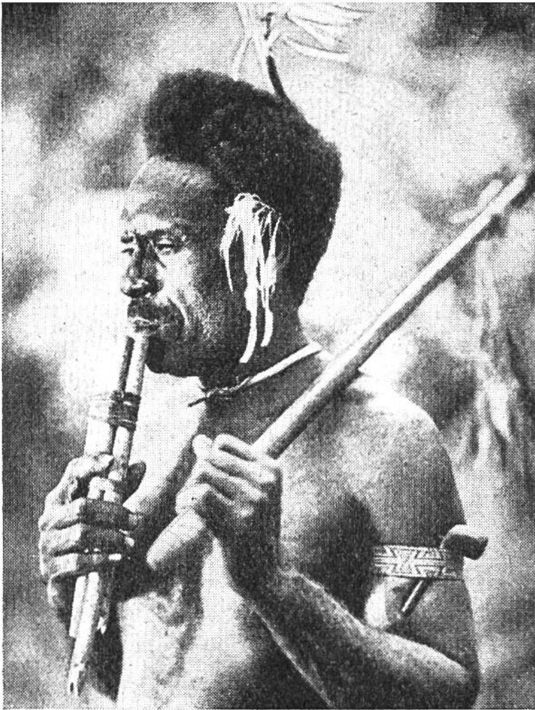
Ein Nasioi-Insulaner der nördlichen Salomon-Inseln im Fest- und Tanzschmuck. Die Rechte hält eine Bocksflöte, auf der er zum Tanz aufspielen wird. Mangels Taschen hat er seine Rauchpfeife in den Armreif gesteckt.

Zupfinstrumente der primitiven Völker gehören hierher. Zur Zeit der Renaissance war die Laute bei Musikfreunden so beliebt und für das Musikleben so bedeutungsvoll wie bei uns das Klavier. Heute ist sie wie Gitarre, Mandoline und fast alle Zupfinstrumente zum Haus- und Familieninstrument geworden, und man vernimmt ihre vollen Klänge selten im Konzertsaal. Die Harfe, deren Akkorden wir bei der Aufführung der grossen Oper ergriffen lauschen, ist eines der ältesten Instrumente. Zum Klang der Harfe sang König David seine Psalmen, feierten die Ägypter und die Römer ihre Feste, und die Minnesänger des Mittelalters begleiteten ihre Weisen auf der kleinen Harfe, wie die bildlichen Darstellungen des berühmten Sängerkriegs auf der Wartburg bezeugen. Die altgriechische Lyra, die in der Bauart einfache, kleine Kitharis, von der wir nicht mehr wissen, wie sie klang, ist zum Sinnbild der holden Kunst der Frau Musica geworden.