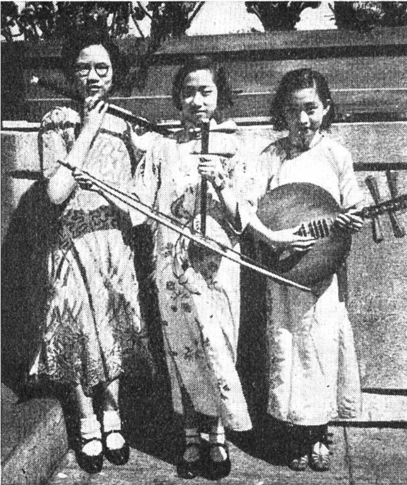
Japanische Mädchen spielen ein Trio auf ihren heimatischen Zupf-, Streich- und Blasinstrumenten.

Musikinstrumente gibt es in Tausenden von Arten. Holz und Metall, Knochen und Horn, Muscheln und Glas, Fell und Pergament sind die bevorzugten klingenden Stoffe, aus denen sie seit alters hergestellt sind. Der Mensch bringt sie durch Schlagen und Zupfen, Streichen und Reiben, Tasten und Blasen zum Schallen und Tönen.