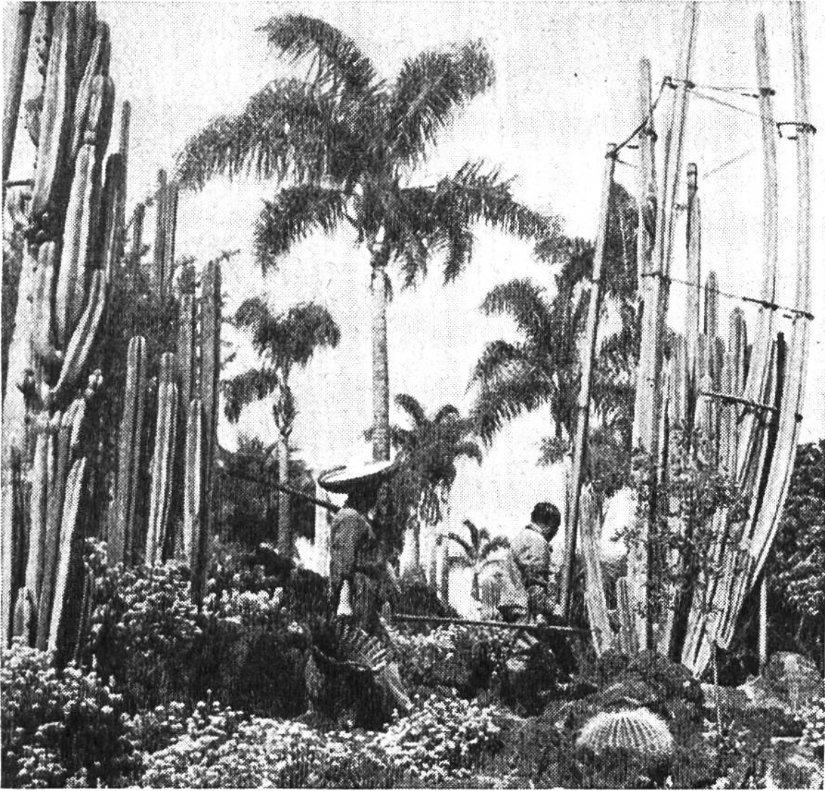
Wie man sieht, brauchen auch die stacheligen Kugeln und die hohen Säulen der Kakteen gärtnerische Pflege und Stütze. Im Hintergrund stehen Palmen.

welken, wenn sie nicht genügend Wasser bekommen, tragen einige Arten Dornen, die fast kein Wasser verdunsten. Bei anderen Arten sind die Blätter ganz zurückgebildet, in den Blattachseln haben sich Haar- oder Stachelbüschel entwickelt. Wenn die Kakteen einmal bei Regen viel Wasser bekommen, so können sie es aufnehmen und in ihrem dicken Stamm für die kommenden Dürrezeiten speichern. Bei manchen Arten benutzen die Menschen dieses aufgespeicherte Wasser sogar als Trinkwasser.