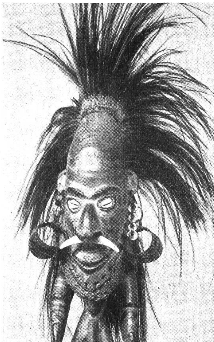
Statuette, Darstellung eines Verstorbenen. Aus der Gegend des Yuat-Flusses im Sepik-Gebiet auf Neuguinea. Sammlung L. Eckert.