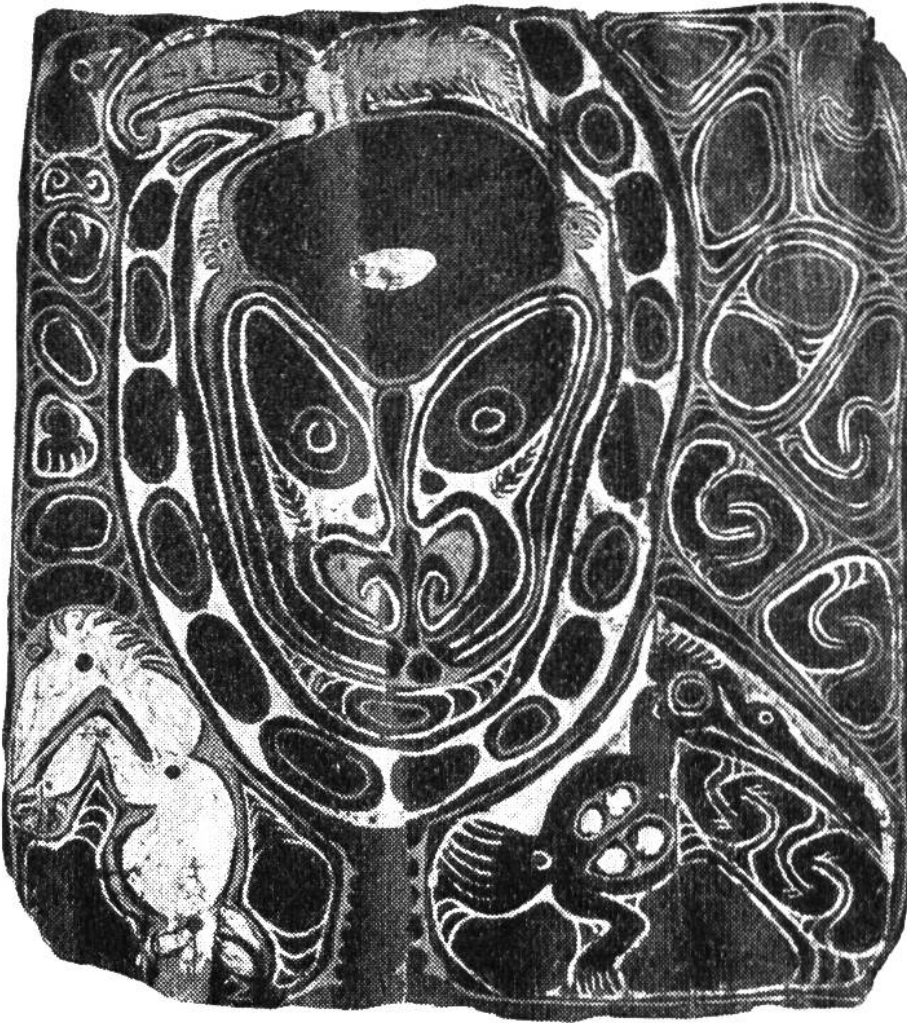
Malerei auf Blütenscheiden einer Palme. Aus dem mittleren Sepik-Gebiet auf Neuguinea. Sammlung F. Speiser.

schalen, einem geflochtenen Bart, Haaren aus Kasuarfedern, Ohrgehängen aus Schildpatt und einem Nasenschmuck aus Eberhauern. Figuren dieser Art stellen Verstorbene dar. Sie wurden früher an einem Nebenfluss des Sepik angefertigt und in den Häusern zur Erinnerung an die Toten und zur Verehrung derselben aufgestellt.