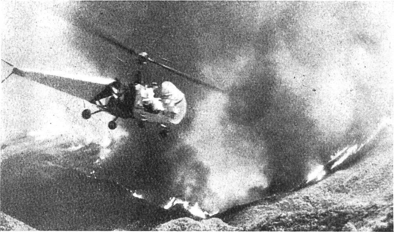
Helicopter bei der Auskundschaftung eines Waldbrandes und der Möglichkeiten seiner Bekämpfung.

dert, wobei sie oft grosses Unheil anrichten. Auch bei frühzeitiger Feststellung des durch den qualmenden Rauch weithin auffallenden Feuers verstreicht oft längere Zeit, bis genügend Menschen und technische Hilfsmittel zur Abwehr des Feuers an Ort und Stelle sind. Reine Nadelholzbestände sind stärker gefährdet als Laubholz- und gemischte Wälder.