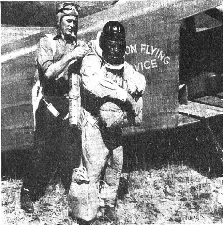
Als Feuerwehrmann ausgebildeter Fallschirmabspringer vor dem Abflug zum Brandherd.

Feuerwehr. Unsere Bilder geben einen anschaulichen Begriff von dieser mustergültigen und leistungsfähigen Abwehrorganisation gegen die im trockenen amerikanischen Sommer so häufigen Waldbrände. Vor der Aufnahme des Kampfes gegen das Feuer erkunden Helicopter das gefährdete Gelände und suchen die für den Absprung der Feuerwehrleute geeigneten Stellen aus. Alsdann springen die Fallschirmer von einem andern Flugzeug zu zweit, zu viert, manchmal sogar dutzendweise ab, um den Kampf gegen das rasende, waldfressende Element aufzunehmen. Diese Fallschirmer sind schwer bepackt. Auf dem Rücken tragen sie den schneeweissen, sorgfältig zusammengelegten Fallschirm und an der Brust einen im Notfall zu gebrauchenden Reserveschirm. Prall angefüllte Säcke im Fallschirmeranzug bergen ferner starke Seile zum Heruntergleiten von den Baumwipfeln, falls die Landung dort erfolgen sollte. Ausserdem enthalten diese Taschen feuerfest verpackte Nahrungsrationen, eine gefüllte Feldflasche, eine