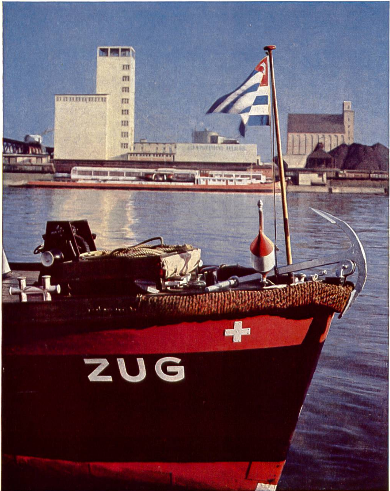
Bug des Hafenschleppers ZUG, welcher die Frachtschiffe im Basler Rheinhafengebiet von einer Umschlagstelle zur andern verbringt. Im Hintergrund: Dieselschlepper URI und zwei Getreidesilos, von denen jeder 16 000 t Getreide fasst. Rechts: Berge von Kohlen, die im Hafen eingelagert sind, bis sie vom Verbraucher in der Schweiz benötigt werden.