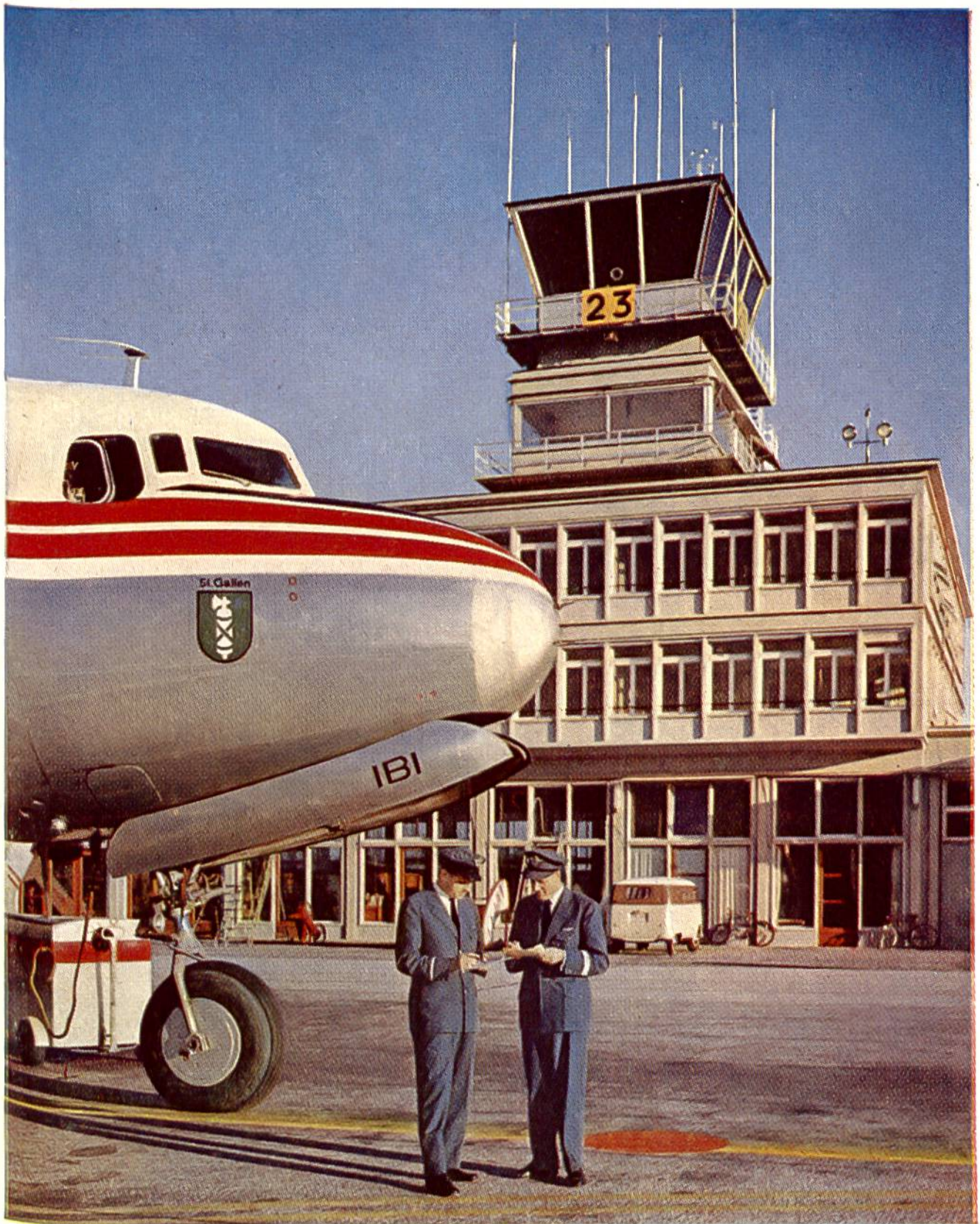
Ein DC-6 B der Swissair in Genf-Cointrin vor seinem Abflug. Diese Maschinen dienen dem Langstreckenverkehr. Der Flight Simulator ist eine genaue Nachbildung des DC-6 B (siehe Seite 229).