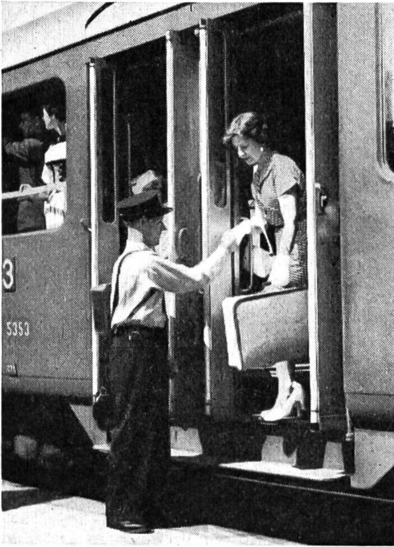
Die helfende Hand des Kondukteurs – ein vertrautes Bild.

Sehr große Bahnhöfe, welche mehr als 13000 Verkehrspunkte aufweisen, tragen die Bezeichnung Bahnhofinspektion . Einige Beispiele: Basel SBB (73281 Verkehrspunkte), Zürich (71 473), Bern (32167), Genève-Cornavin (22 092), Lausanne (16 163). Der Bahnhofinspektor Zürich ist Chef von 2200 Beamten und Angestellten.