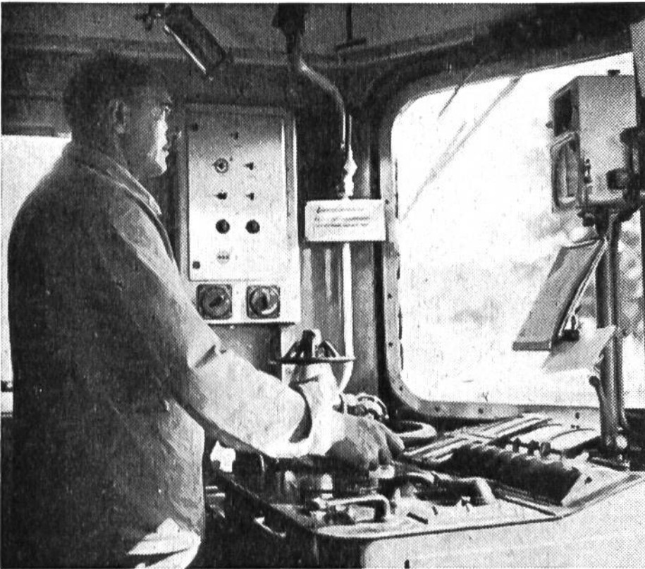
Die Hand am Steuer, den Blick auf die vorbeiflitzen- den Signale gerichtet – so beherrscht der Lokomotivführer die Lokomotive.

(2152 Verkehrspunkte), Martigny (2396), Lugano (5736), Arth-Goldau (5829), Rorschach (7386) und Aarau SBB (11 776).