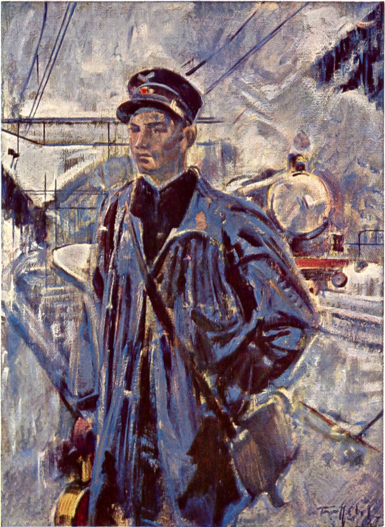
Der Kondukteur, Gemälde von Friedrich Traffelet, 1897–1954, Bern.