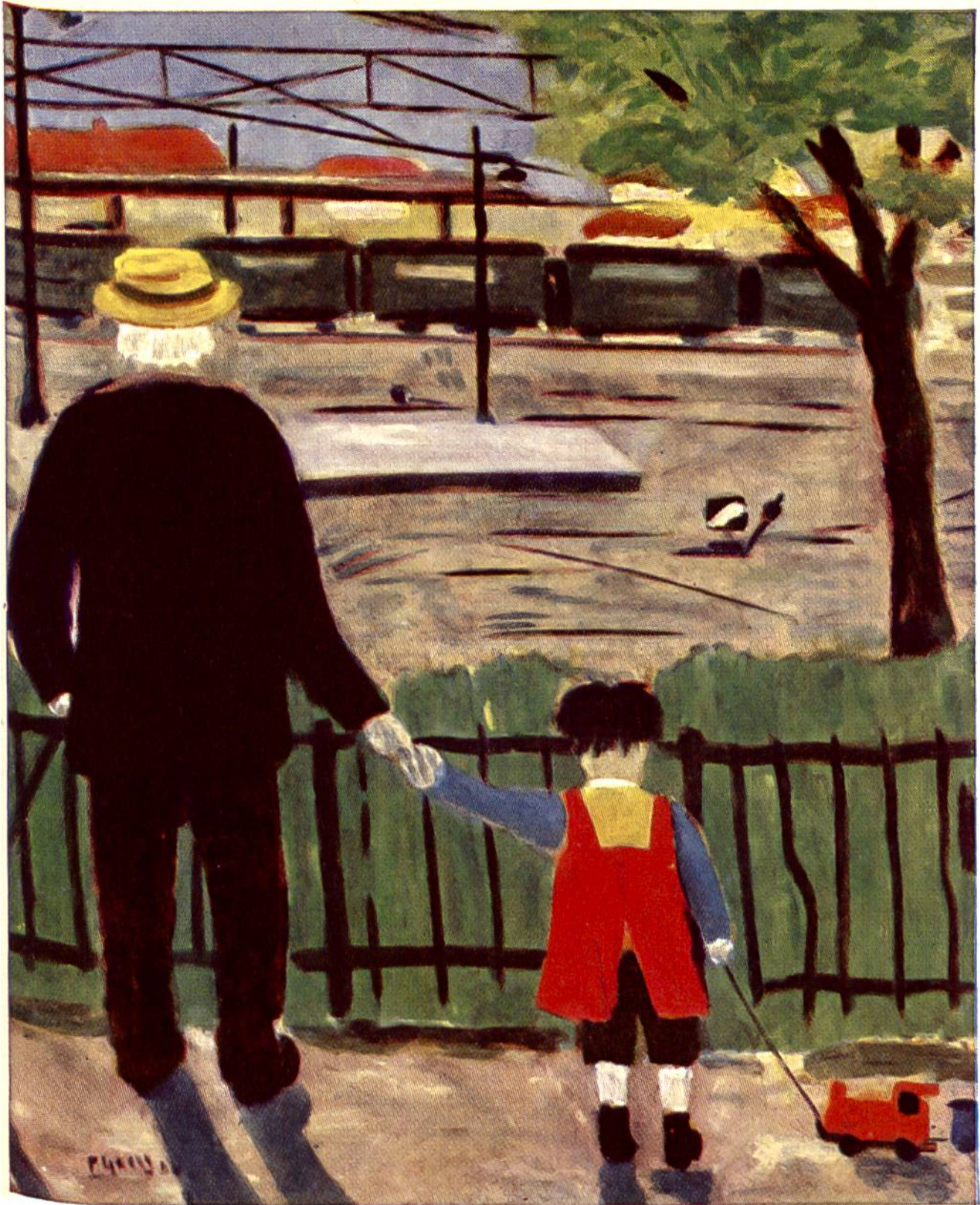
Der Pensionierte, von Paul Gross. (Paul Gross ist von Beruf Rangierarbeiter und malt in seiner freien Zeit als Amateur.)