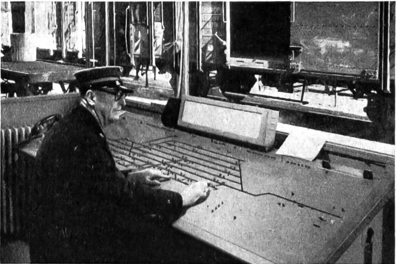
Ein Souschef bedient sitzend das neue elektrische Pult-Stellwerk eines kleineren Bahnhofes.