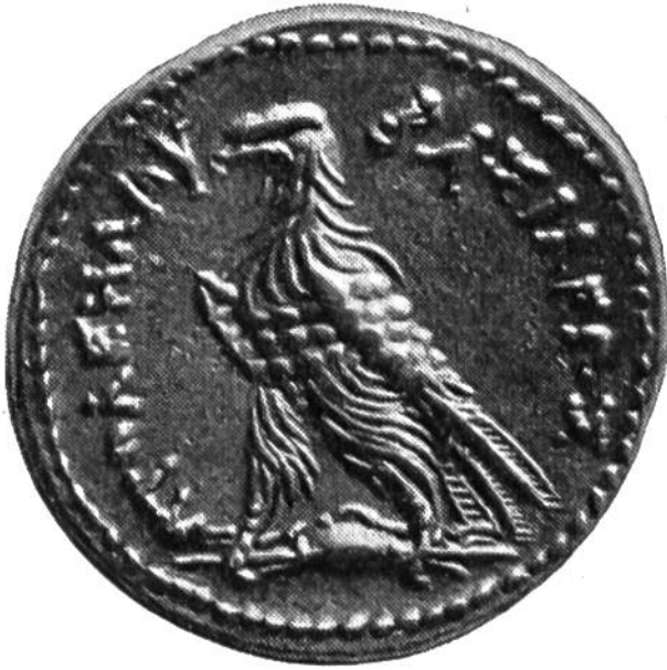
5. Silbermünze des ägyptischen Königs Ptolemäus III., geprägt um 230 v. Chr. (Dm.: 26 mm).