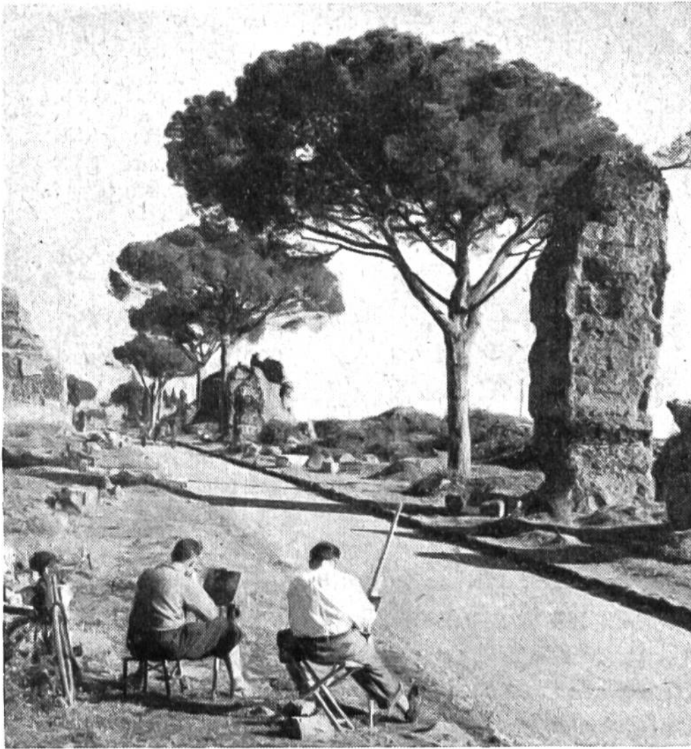
Die malerische römische Via Appia Antica. Ruinen gewaltiger Grabdenkmäler.

Einverleibung der Städte Athen, Rhodos, Pergamon und Alexandria in das Römische Reich Rom zur alleinigen Hauptstadt der antiken Welt geworden war und damit auch den Geschmack und den Baustil bestimmte, erhielt die römische Architektur ein besonderes Gepräge. Es entwickelte sich ein griechisch-römischer Prunkstil, und es entstand eine römische Reichskunst, die gleicherweise den Osten wie den Westen beherrschte. Diese Kunst der Römer stellte den Künstlern und Baumeistern verlockende und dankbare Aufgaben. Sie sollte die Macht, den Einfluss und die Grossartigkeit des Römischen Reiches den unterworfenen Völkern vor Augen führen und die Römer selbst in dem Glauben bestärken, dass ihre Stadt zum caput orbis terrarum , zur Hauptstadt der Welt und zu deren Beherrschung berufen sei.