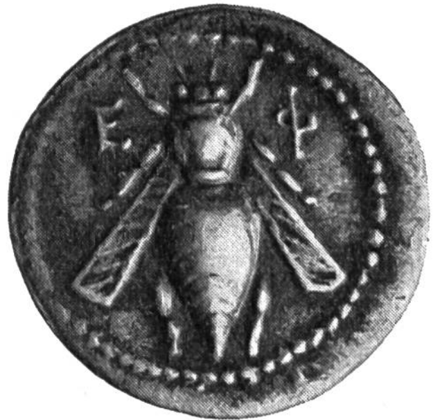
6. Silbermünze der Stadt Ephesus in Kleinasien, geprägt um 200 v. Chr. (Dm.: 17 mm).

heute noch nicht genau. Jedenfalls wurden sie auf einem Amboss mit schweren Hämmern von Hand geprägt, wobei man das Metallstück vorher stark erhitzte, um es geschmeidig zu machen. Das Münzbild selbst wurde mit primitiven Instrumenten spiegelverkehrt in ein hartes Stück Metall eingeritzt. Die wenigen Bilder aber zeigen uns, dass es sich bei den Herstellern der Münzen um ganz hervorragende Künstler handelte. Der Wert des Geldes war diesen gleichgültig. Wichtig war ihnen nur, künstlerisch erstklassige Arbeit zu leisten und mit den schönen Münzbildern Freude zu bereiten.