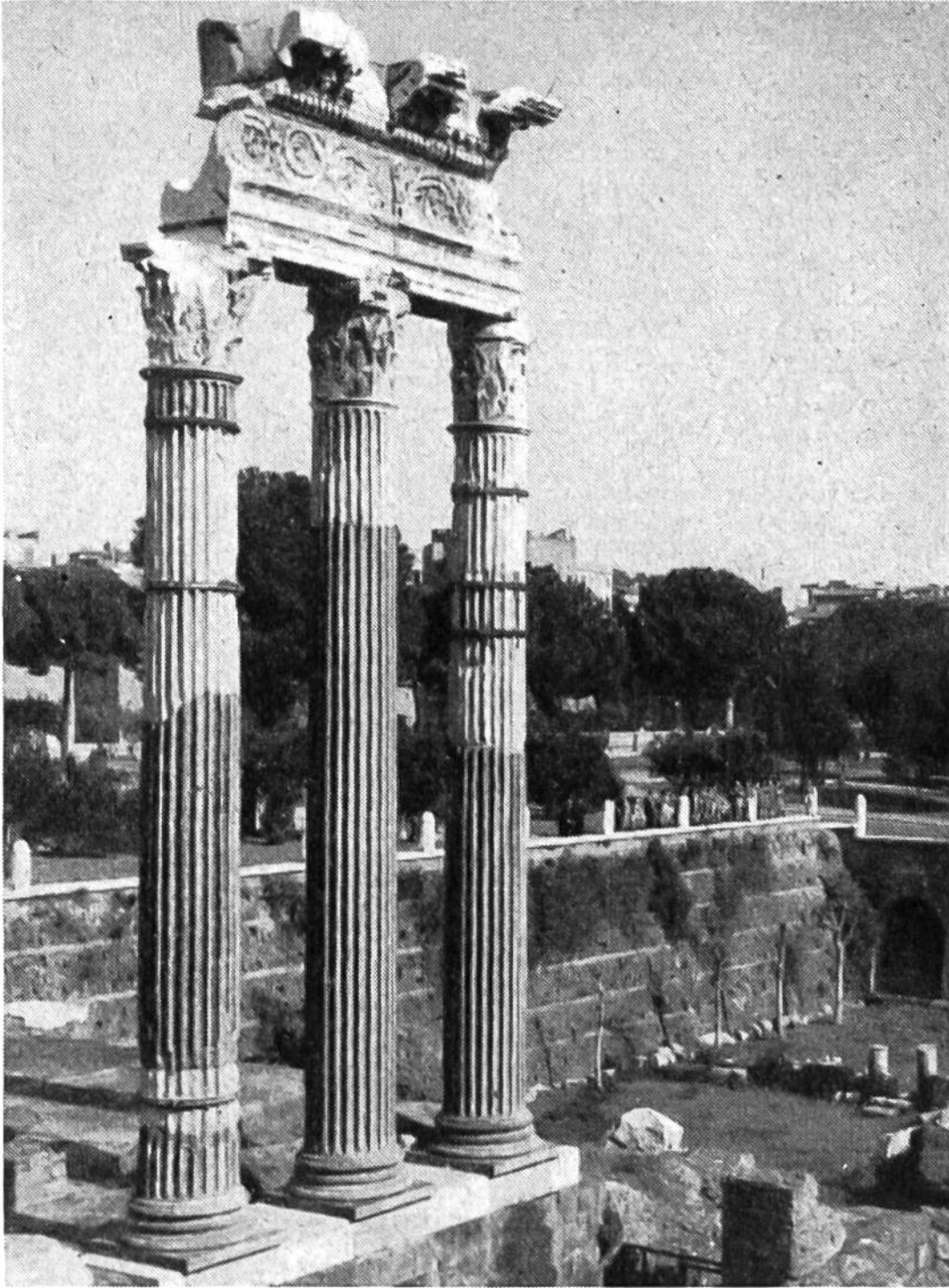
Rom. Auf dem Forum des Julius Caesar. Die prächtigen Säulen des Venustempels. Das höher gelegene Erdreich des Platzes wurde von zwei Jahrtausenden aufgetragen.

noch an die Etrusker erinnern. Zu den Tonnen- und Kreuzgewölben kamen die Kuppeln, und es entstanden um die Baukörper herum riesige Platz- und Gartenanlagen, die den Eindruck der gewaltigen Gebäude noch vergrößerten. Die Stadt Rom besonders erhielt unter den Kaisern ein glänzenderes Gewand. Eine Pracht in Bauten wurde entfaltet wie seitdem in keiner Stadt der Welt.