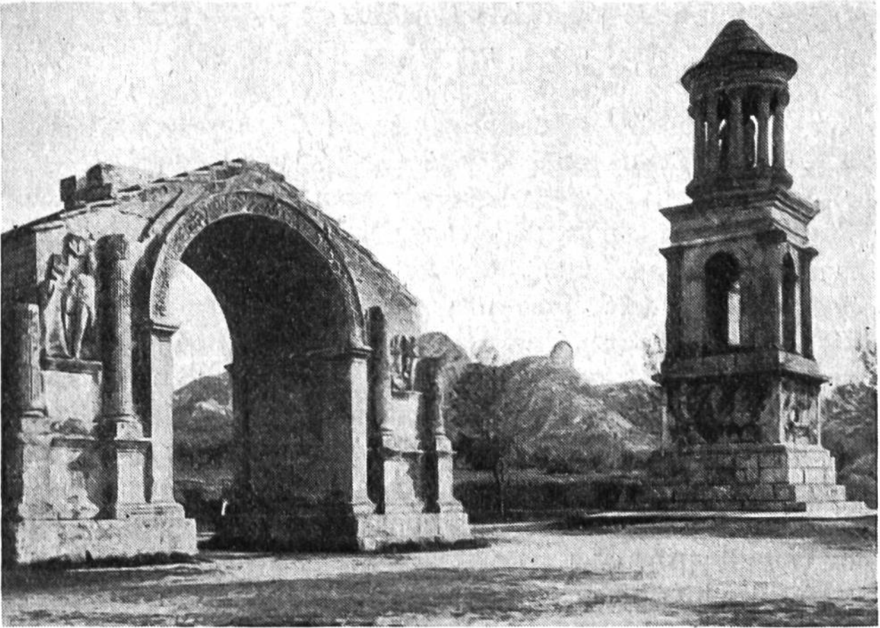
Triumphbogen und Grabmal der Julier bei St. Rémy in der Provence (Südfrankreich). Die alte Römerstadt wurde 480 n. Chr. von den Westgoten zerstört.

baute der Kaiser Hadrian das Pantheon, einen Rundbau, dem die Form einer Kugel zugrundeliegt, was bedeutet, dass die Raumhöhe der Raumweite entspricht. In diesem Tempel wurden alle Götter verehrt, die heimischen wie auch die fremden der unterworfenen Völker, um zu zeigen, dass Rom gewissermassen auch die Hauptstadt der Götter sei. So wurden Rom und im Gefolge der Eroberungen viele andere Städte des römischen Erdkreises mit Tempeln, Marktplätzen, Badehallen (Thermen), Triumphbögen, Grabdenkmälern und Ehrensäulen geschmückt, die noch heute von der Pracht und von der Macht des Römischen Reiches zeugen.