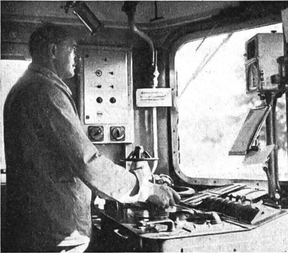
Die Hand am Steuer, den Blick auf die vorbeiflitzen- den Signale gerichtet – so beherrscht der Lokomotivführer die Lokomotive.

(2152 Verkehrspunkte), Martigny (2396), Lugano (5736), Arth-Goldau (5829), Rorschach (7386) und Aarau SBB (11 776).